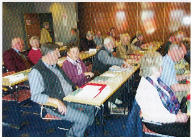
Endel av deltagerne på lederkonferansen.

Spørsmålet om synliggjøring av pensjonistforeningene overfor Telenor, og mulighetene for påvirkning av eldrepolitikken på kommune-, fylkes- og statsnivå ble drøftet. Disse sakene er nærmere omtalt på annet sted i bladet.