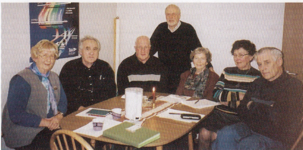
Styret i Steinkjerforeningen i 2001: