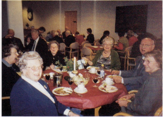
Glade pensjonister under 45 års feiringen

har utlodning. Det har vi også på våre medlemsmøter. Våre medlemmer er flinke til å gi gevinster samt kjøpe lodd. Det er flere kreative medlemmer så det er mange flotte gevinster.