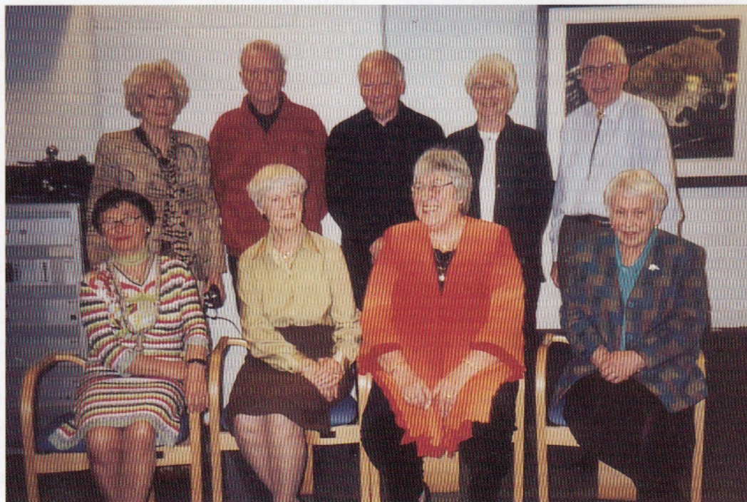
Styret i Osloforeningen i 2002.