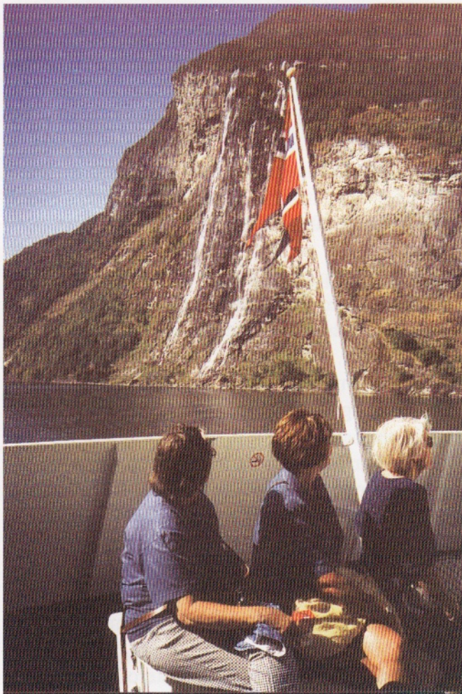
Med hurtigruten til Geirangerfjorden og Brudesløret