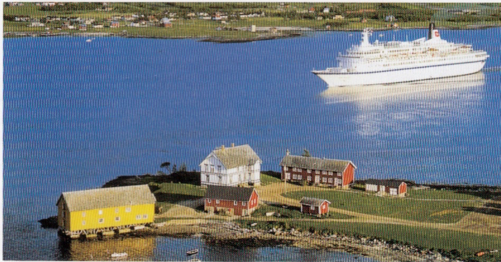
Sandtorgholmen hotell og gjestehus ved Tjeldsundet

Ofoten og Sør-Troms telepensjonistforening, som har sete i Harstad, har medlemmer fra tidligere Harstad og Narvik kontrollkretser samt fra tidligere Nord distrikt.