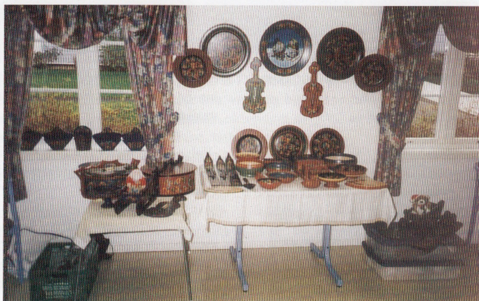
Noen av de utstilte hobbyarbeidene

“Min hobby” var tema på medlemsmøtet til telepensionistene i Østfold i november 2001, og her skulle de nevenyttige blant oss få vise fram sine hobbyarbeider. Dette ble meget populært og til stor fornøyelse for de ca. 90 av medlemmene som var tilstede. De kunne beskue treskjæringsarbeider, rosemaling, veving, kniplinger, vugger, bunadsøm, akvareller, malerier, neverarbeider, med mer. Vi fikk se forskjellige “produksjonsmetoder”, som utstillerne villig demonstrerte, selvfølgelig til vår