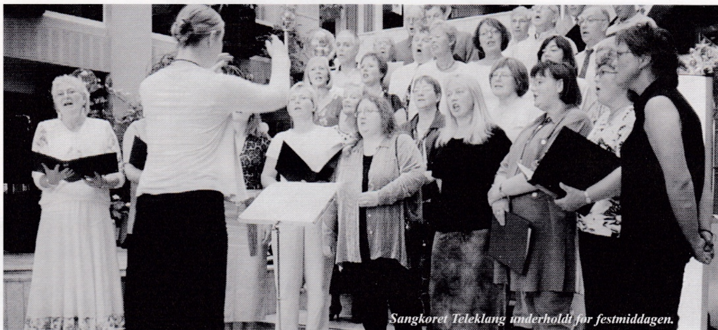
Sangkoret Teleklang underholdt for festmiddagen.

tilsluttet Terra-gruppen som består av 86 banker, og Telespar er blant de ti største.