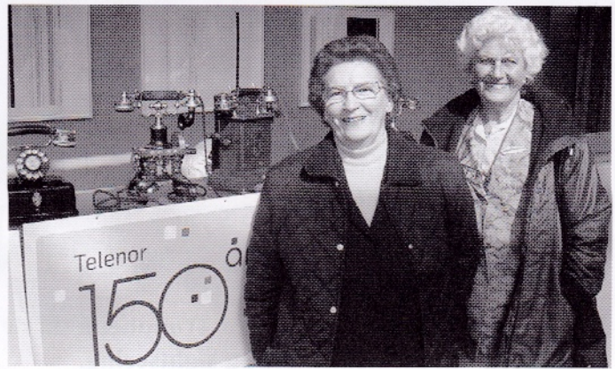
God gammel årgang på Tyholt under jubileumsmarkeringen.

Are og Odin var et blinkskudd som frydet gamle og unge. Ikke mange forunt å være toillat med stil og håve inn penger på det. "Tore på sporet" lurte i kulissene som kon-