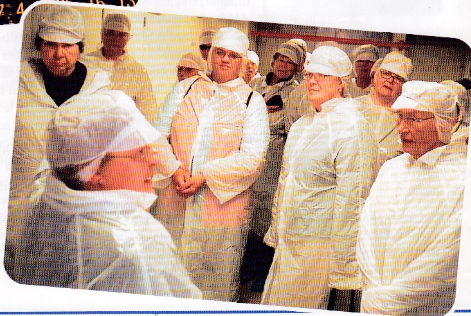
Oppkledde teledamer på besøk i klippfiskfabrikken i Kristiansund