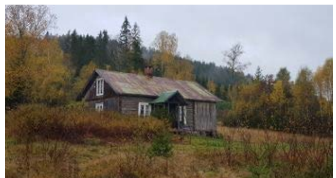
Det gamle våningshuset på husmannsplassen Kletta under Lier i tidligere Vinger kommune (nå Kongsvinger kommune).

Kongsvinger - Vinger Historielag har et prosjekt på Lokalhistoriewiki som er et eksempel til inspirasjon for mange historielag. Dette er en oversikt over husmannsplasser i Kongsvinger kommune og i første omgang et arbeidsdokument for å registrere plassene på Lokalhistoriewiki. Artiklene legges ut på wikien av Kongsvinger - Vinger Historielag. Klikk og les her: https://lokalhistoriewiki.no/wiki/Husmannsplasser_i_Kongsvinger_kommune