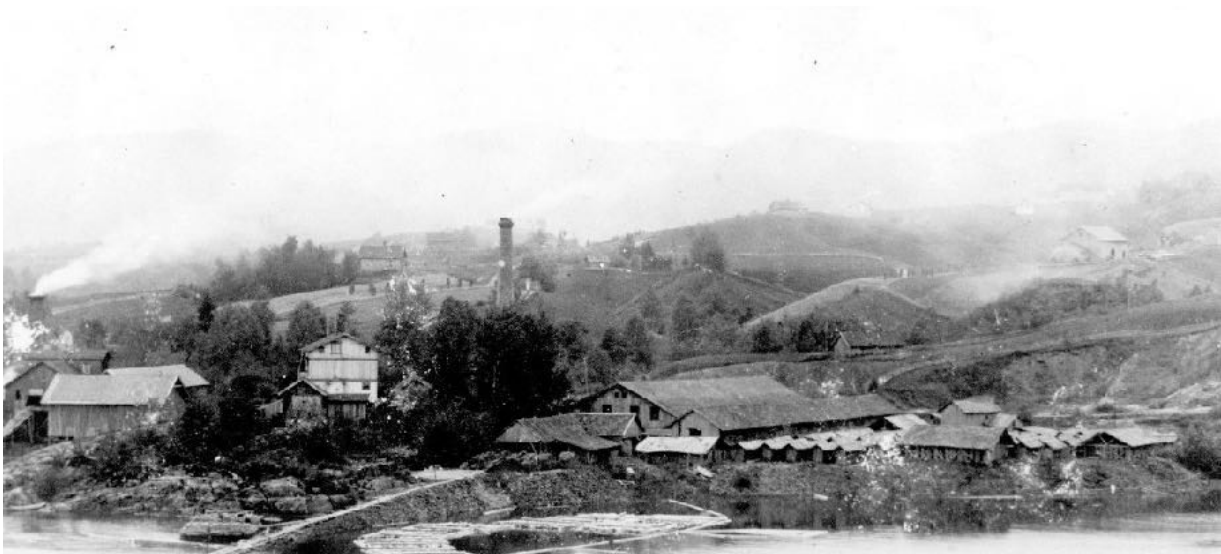
Nordby bruk i Rælingen.

I en befolkning på rundt 5000 var ikke dette dramatisk, sett på bakgrunn at millioner av mennesker skal ha dødd verden over. Og når man blar i bøkene og ser hvor mange som døde av lungetæring eller tuberkulose blir man glad man lever i dag. I Fet var det faktisk mer uhyggelig med lokale tyfusutbrudd som blusset opp år om annet, først og fremst om sommeren. Tyfus gir feber, svettetokter, ingen appetitt, hoste og hodepine og pasienten blir sløv før forstoppelsen avløses av kraftig ertesuppe-lignende diaré. Det er en annen og glemt historie, men jeg husker besteforeldrene mine fortalte at det var melka fra meieriet som var smitekilden. I 1917 skrev Aftenposten at 28 var syke. Klokkeboka forteller at 3 døde det året, mens sommeren 1919 døde 10 personer av denne skremmende sykdommen som hele tida var begrenset til Fetsund. Fetsund meieri kom tidlig i søkelyset som smittekilde, men det tok mange år før man fant sammenhengen og da hadde man famlet i blinde og utpekt farlige sumper og urent vann fra elva som smitekilden. Men det var melk som var