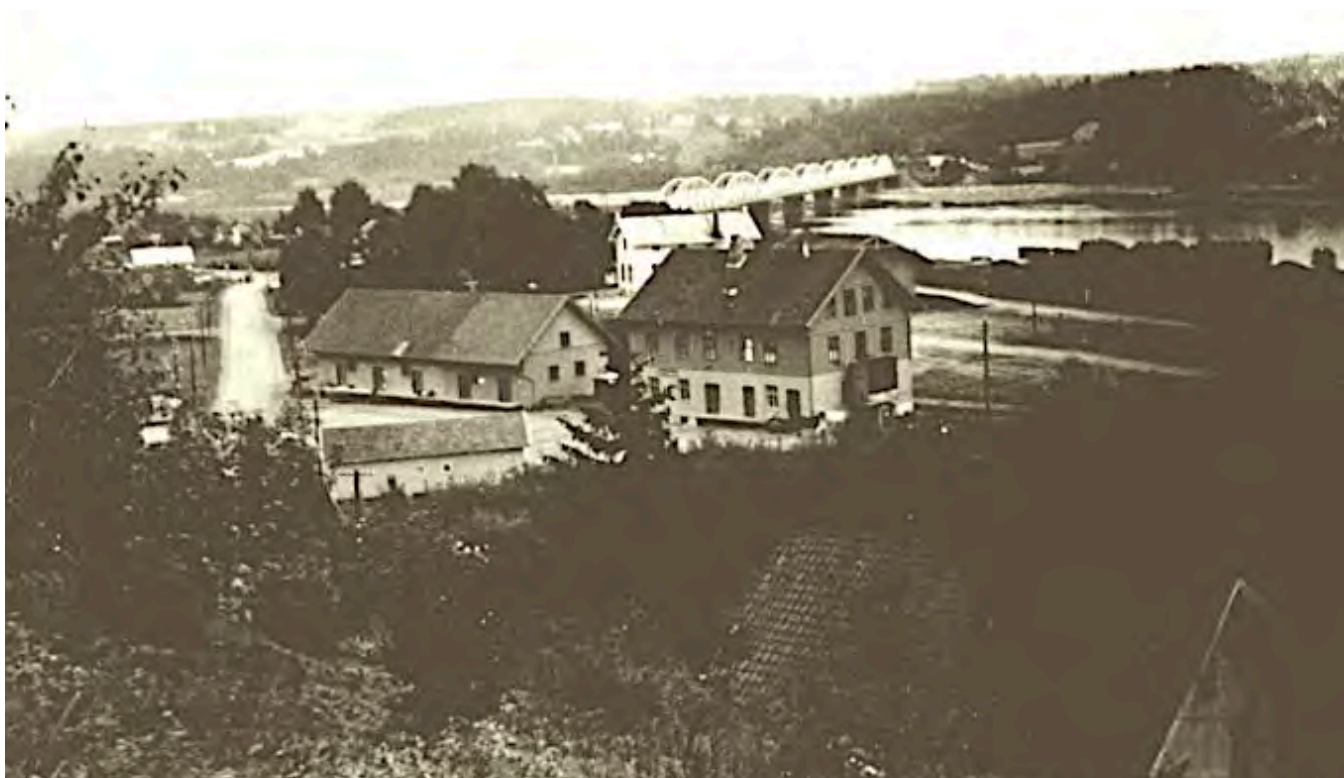
Fet Spareforening, Fet Meieri og Godsekspedisjonen.

konflikter kom nyhetene uhindret derfra. Sykdommen ble derfor kalt Den spanske syke, etter hvert spanskesyken. 27 juli skrev avisen Indre Akershus som utkom i Lillestrøm: «Hvordan man kan undgaa den spanske syke?» Rådene er ikke så ulike de vi får nå. Mye om smitte var godt forstått i gamle dager, selv om de ikke