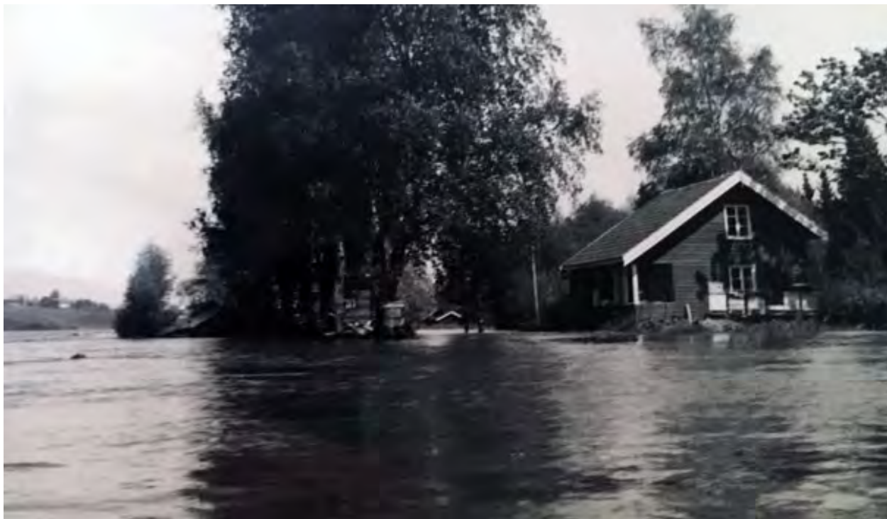
Hennisand under flommen i 1967

kirke ble bygd i 1878 var Nes kirke også kirke for østsida av Glomma. At gamle Nes kirke brant etter lynnedslag i 1854 aktualiserte også ny kirke på østsida. Videre var Vormsund