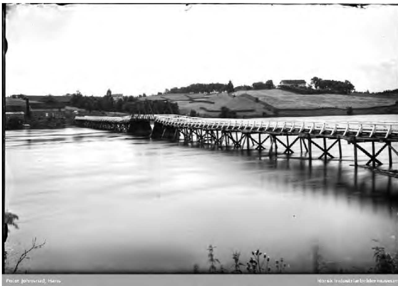
Vormsundbrua. Akershusbasen.