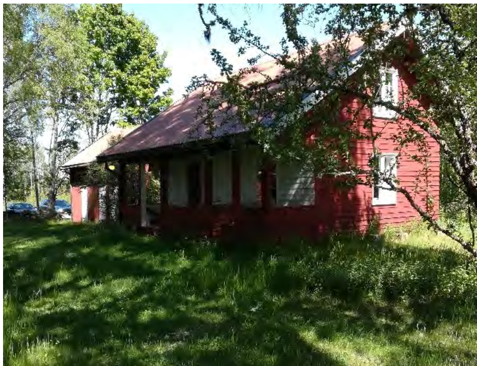
Husa på Hennisand

nedenfor elvemøtet muligens litt mer sikker før en begynte å regulere Mjøsa fra Svanfossen (1906-1910) og fikk mer dypvann i Vorma fra Mjøsa om vinteren.