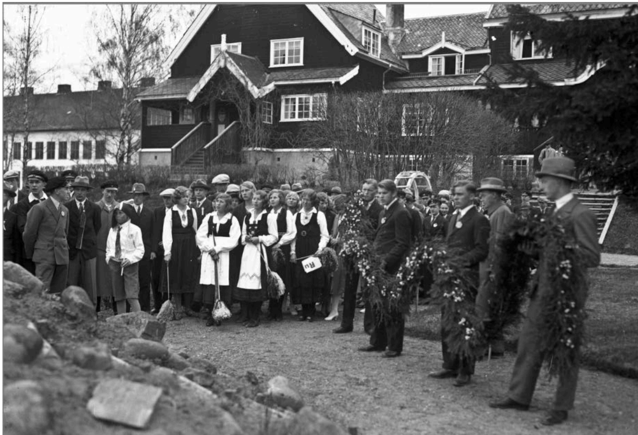
Kransnedleggelse ved Wergelandsmonumentet utenfor Eidsvoll Landsgymnas. Fotografering 1930 - 1940.