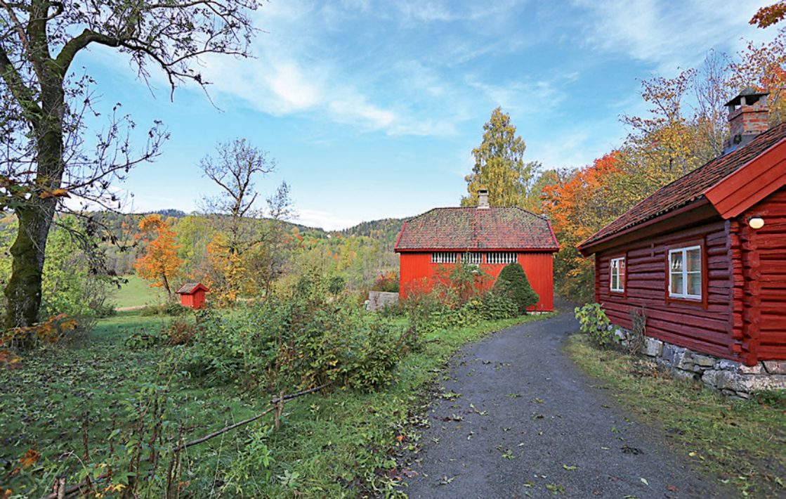
Søndre Skotta gård.