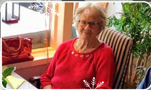
Ildri møtte klassekameratene