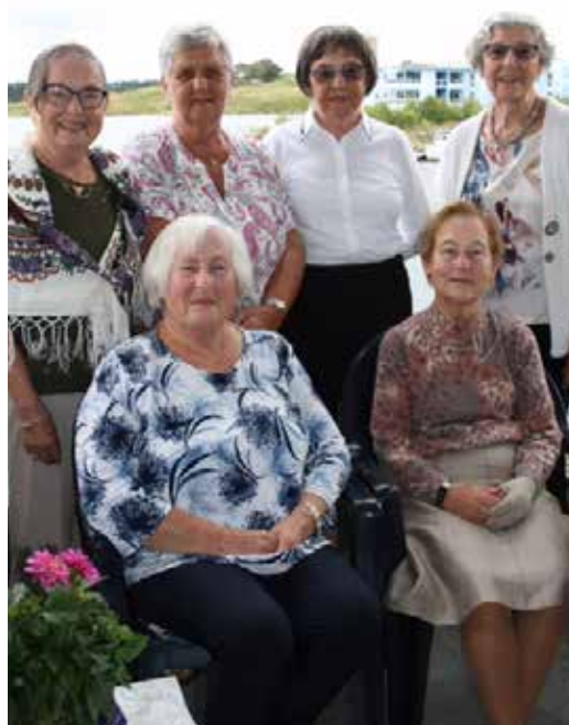
Læseforeningen i Haugesund har holdt det gående i over tjuer år.

Men utviklingen gikk sin gang, og de driftige damene var omstillingsvillige. Gjennom videreutdanning og intern opplæring var de klare for kontorarbeid og ansvarsfulle stillinger.