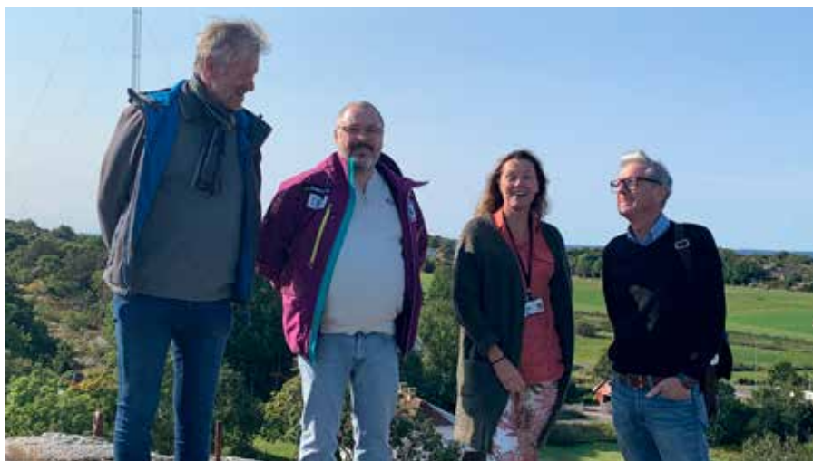
Til topps på Radioberget etter befaring på Villa M, Tjøme.

Hyttestiftelsen kan du kontakte på e-post hytte-ost@telenor.com