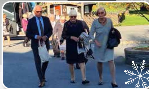
Jubileum på Kirkenær