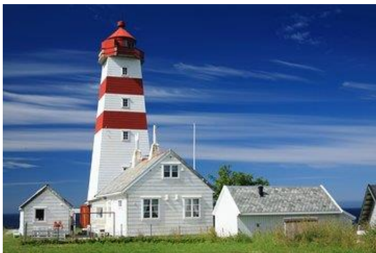
12) Her har du kanskje vært flere ganger?

-Ta gjerne bilde av veteranbilen på stedet, og legg dette gjerne på Facebook siden til SAK!