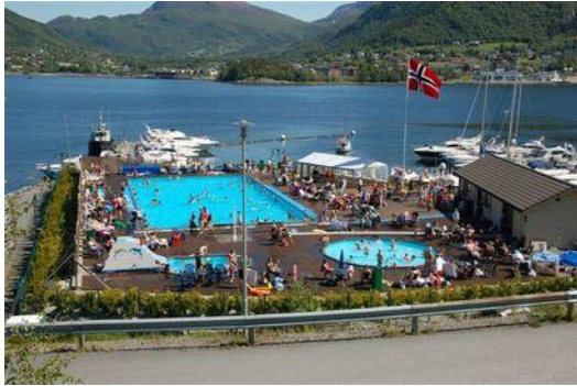
22) Her er det alltid badetemperatur i vannet.