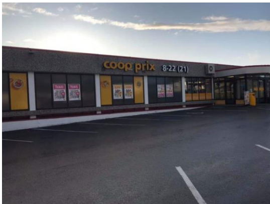
32) Hit blir det snart ny veg uten ferge.

-Ta gjerne bilde av veteranbilen på stedet, og legg dette gjerne på Facebook siden til SAK!