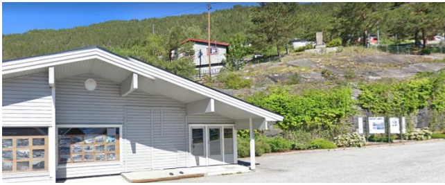
4) Populær sommercamping for fastliggere