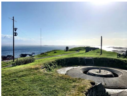
15) Viktig krigsminnesmerke

-Ta gjerne bilde av veteranbilen på stedet, og legg dette gjerne på Facebook siden til SAK!