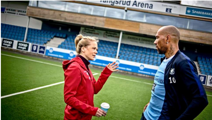
28) Heimebane for Tangsrud fotball.