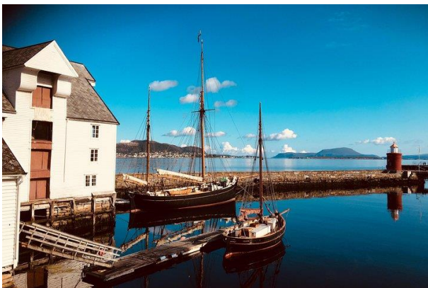
6) Kjent landemerke

-Ta gjerne bilde av veteranbilen på stedet, og legg dette gjerne på Facebook siden til SAK!