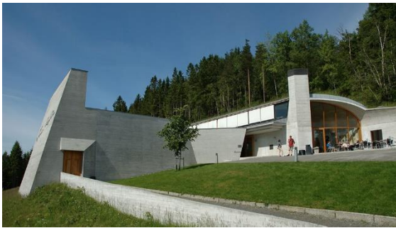
31) Røynde ferdafolk kjenner nok att staden