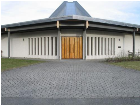
14) Kirke med spesiell arkitektur.

-Ta gjerne bilde av veteranbilen på stedet, og legg dette gjerne på Facebook siden til SAK!