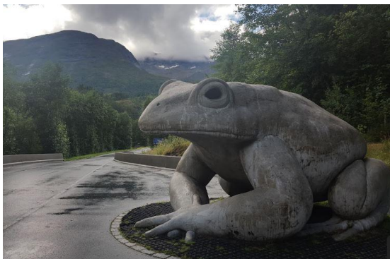
11) Kyss prinsen

-Ta gjerne bilde av veteranbilen på stedet, og legg dette gjerne på Facebook siden til SAK!