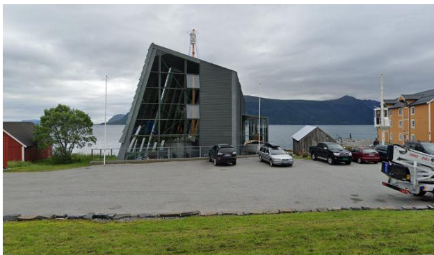
8) Monument over svunnen tid.

-Ta gjerne bilde av veteranbilen på stedet, og legg dette gjerne på Facebook siden til SAK!