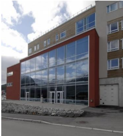
7) Kanskje er det konsert her i dag?