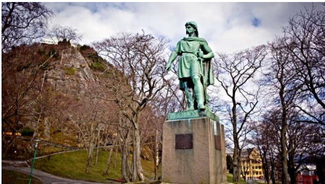
10) Navnet minner om idrett