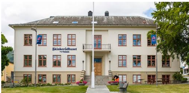
16) Gjenbruk av rådhus