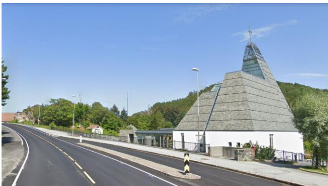
9) Nybygd etter brann

-Ta gjerne bilde av veteranbilen på stedet, og legg dette gjerne på Facebook siden til SAK!