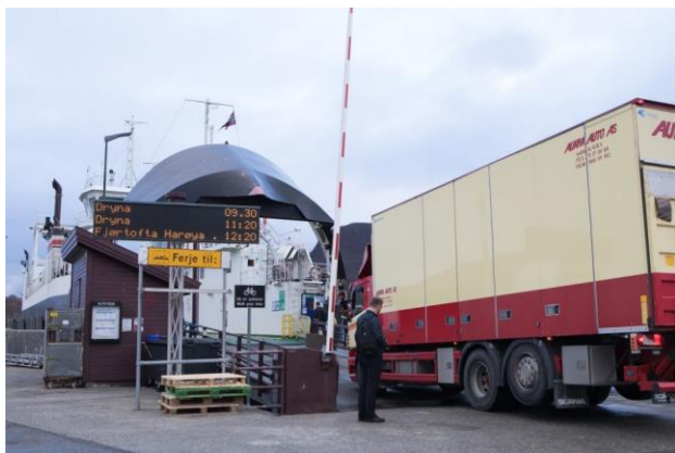
5) Viktig fergeleie

-Ta gjerne bilde av veteranbilen på stedet, og legg dette gjerne på Facebook siden til SAK!