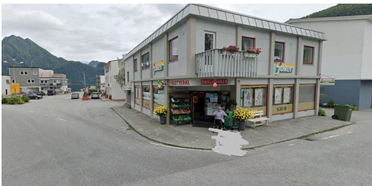
30) Her får du kjøpt is mens du venter på ferga

-Ta gjerne bilde av veteranbilen på stedet, og legg dette gjerne på Facebook siden til SAK!