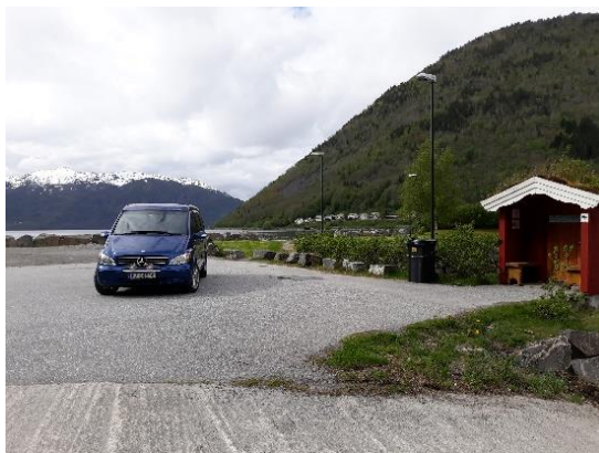
27) Her kan du fortøye båten når du er på fjordtur.

-Ta gjerne bilde av veteranbilen på stedet, og legg dette gjerne på Facebook siden til SAK!