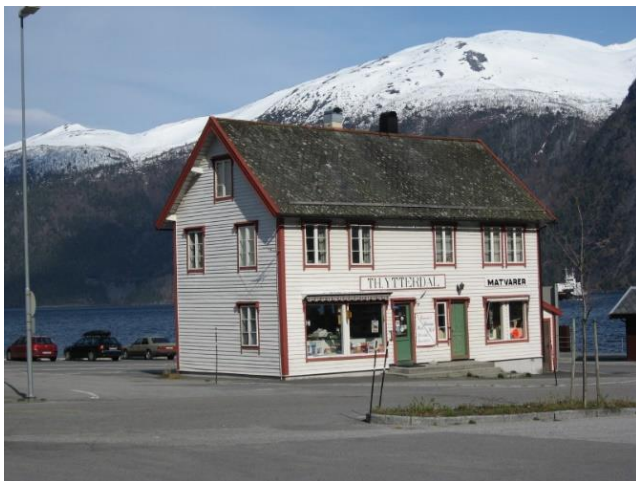
24) Tradisjonsrik landhandel langs turistvei