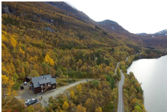
33) Turisthytte med bilvei helt frem

-Ta gjerne bilde av veteranbilen på stedet, og legg dette gjerne på Facebook siden til SAK!