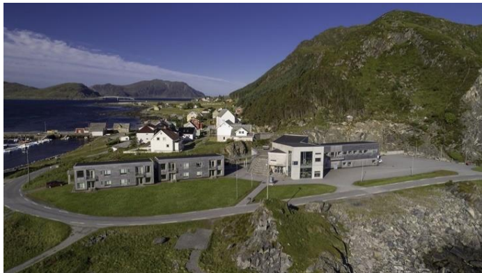
26) Her forskes det på miljø

-Ta gjerne bilde av veteranbilen på stedet, og legg dette gjerne på Facebook siden til SAK!