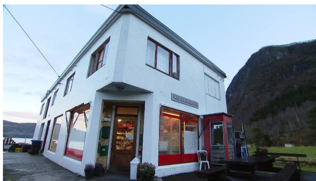
3) Idyllisk landhandel