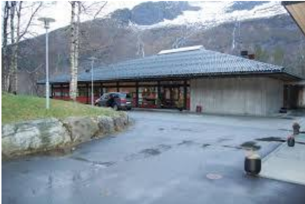
25) Grendahus i aktivt grendalag