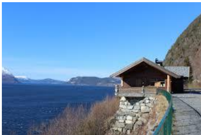
1) Sommeråpent serveringssted langs en kjent turistveg.