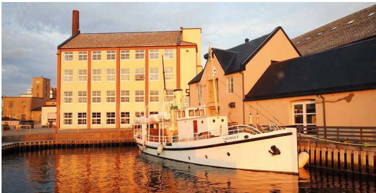
29) Et mål for togentusiaster

-Ta gjerne bilde av veteranbilen på stedet, og legg dette gjerne på Facebook siden til SAK!