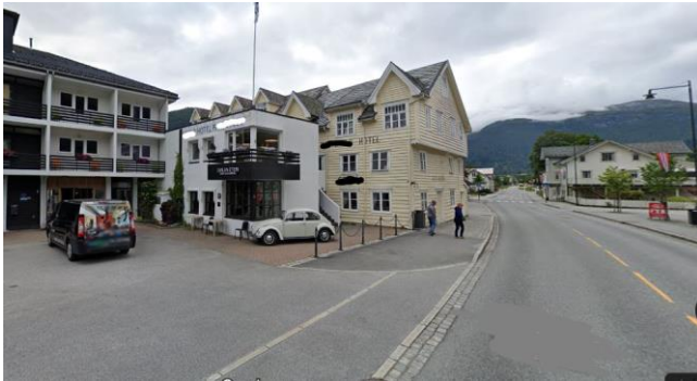
13) Har nettopp byttet fylke.