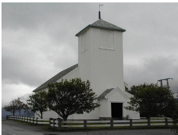
2) Gudshus ved havet