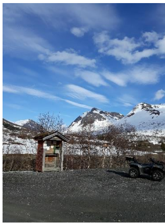
23) Mange tar langrennsturen her.