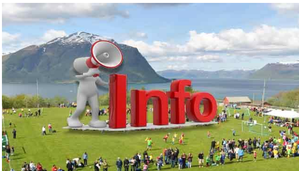
18) Bygd kjent for dugnad, fotballfestival, russisk båt mm.