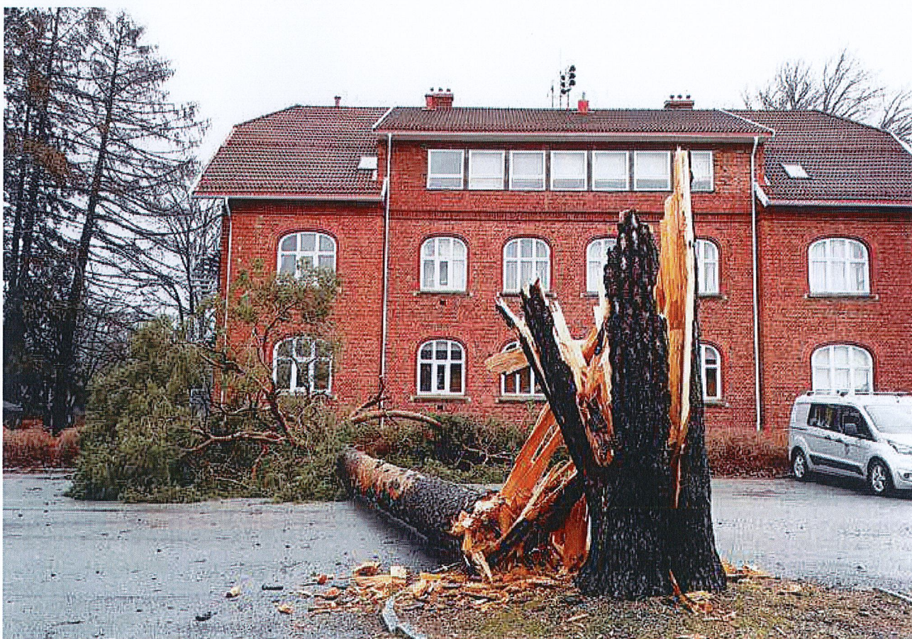
Det store treet knakk i kulingkastene natt til en søndag – heldigvis uten å føre til skade på materialer eller mennesker.

Furutreet er, sammen med et par nabotrær, sannsynligvis det eldste treet i sentrum av stasjonsbyen. Det blåste ned under uværet natt til søndag 16. februar. Treets alder er usikker, men frøet spirte trolig en gang i første halvdel av 1800-tallet. Anslått alder er 170-180 år.