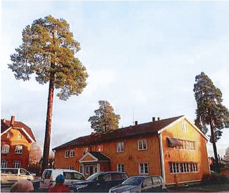
«Vi møtes ved furua» – furutreet på Åsgård (t.v) var i mange generasjoner et naturlig sted å treffes for folk i Ås. Furu bak den gule bygningen falt i fjor høst, mens treet ved hjørnet til høyre er det eneste gjenstående av trioen.