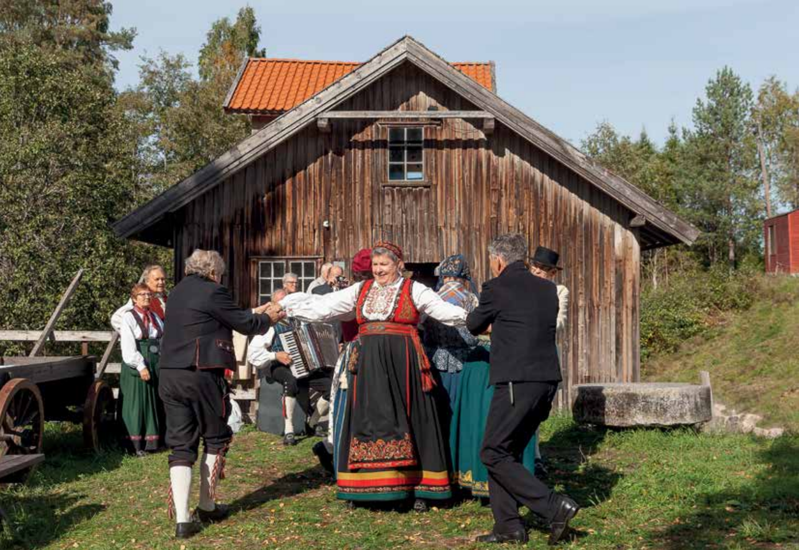
Sørum Leikarring viser fram tradisjonell dans under Slora Mølles Dag i juni 2018.