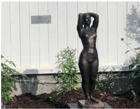
Skulpturen som ble avduket i Nod-Odal sommeren 2019. Den står utenfor menighetshuset ved Mo kirke.