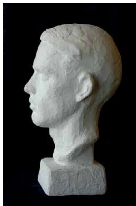
Bysten er et selvportrett av en ung Bergersen.