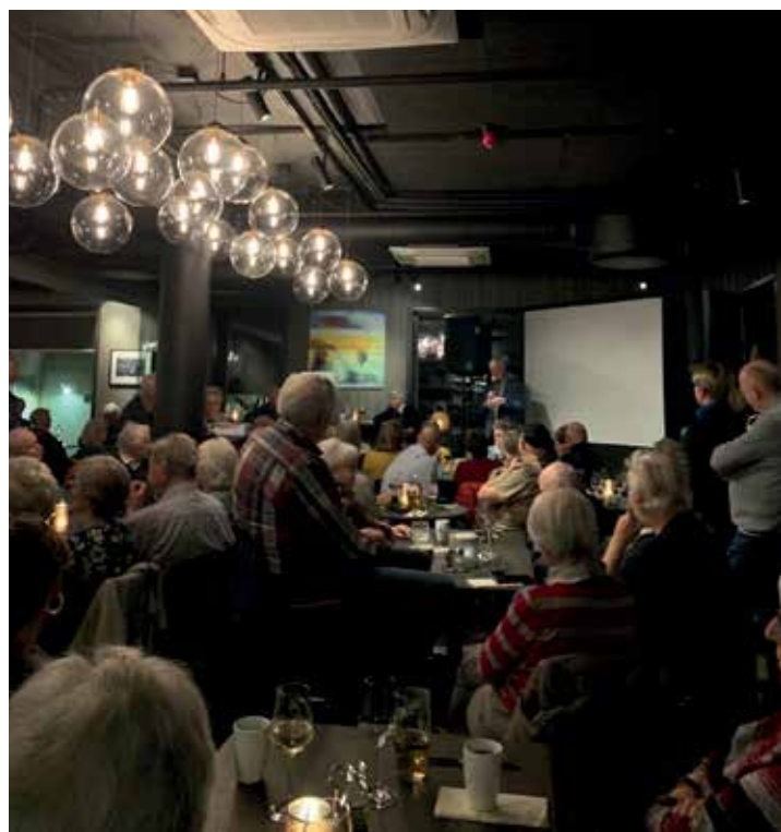
Bra oppmøte og god stemning på Frauna.

Då slutten av kvelden var det åpen mikrofon, hvor de som ønsket det kunne dele sine egne minner fra Frogner den gang da. Dette var det flere som gjorde, til stor glede for publikum. Vertskapet på Frauna hadde en hektisk kveld med anslagsvis nitti fremmøtte til Mimrekveld, i tillegg til gjester utenom. De la ned en stor innsats for at kvelden skulle bli så vellykket som mulig. Det frister til gjentakelse av Mimrekveld på Frogner, gjerne med innsamling av privatpersoners bilde-