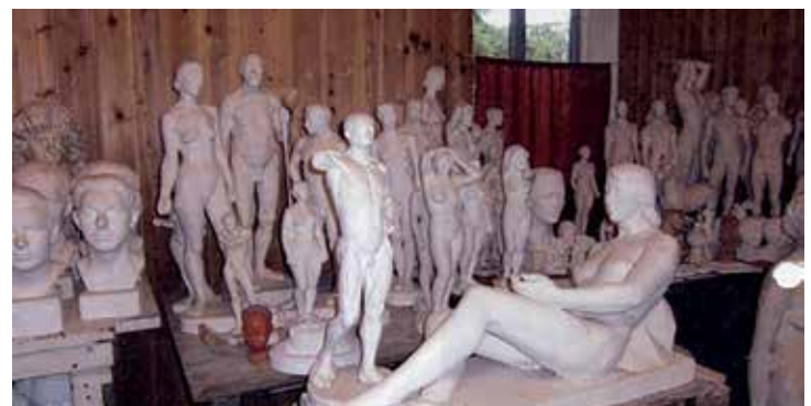
Glimt fra Bergersens atelier i Svennerudveien.