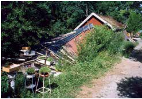
Det gamle lageret i Svennerudveien har rast ut.