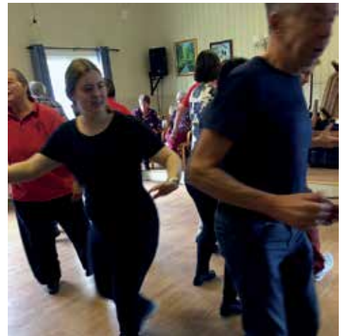
Nå får vi det till!