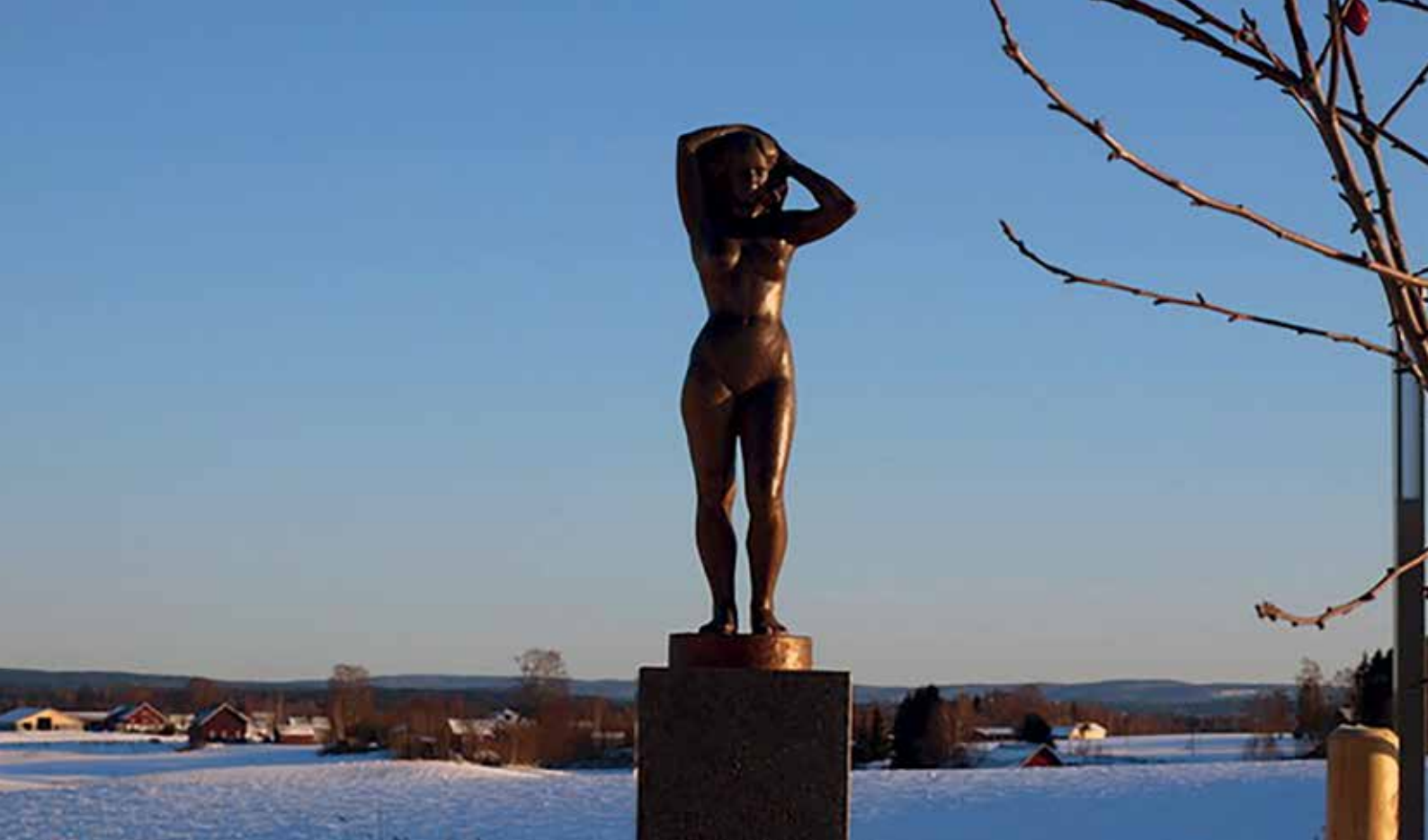
Bergersens skulptur som står utenfor Sørvald Bo- og behandlingssenter.