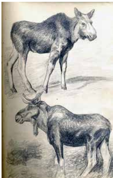
Fra Bergersens tegneblokk. Han var en meget dyktig tegner, og glad i dyr.