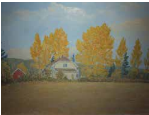
En akvarell Bergersen har laget av Villa Solheim. foto: Randi Fjørstad