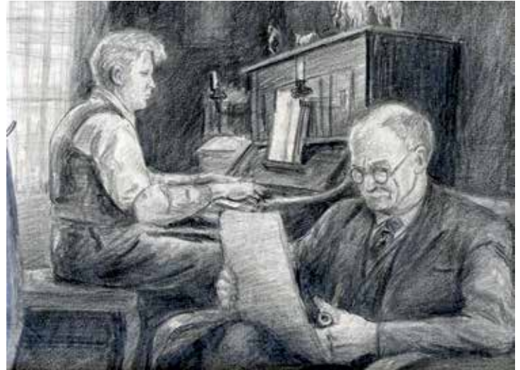
Her har Bergersen tegnet sin far og eldste bror i stua i Villa Solheim. Tegningen er fra skisseboken hans.