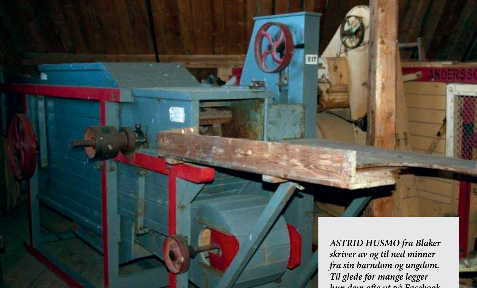
Norskbygd treskeverk fra Globus Maskinfabrikk.