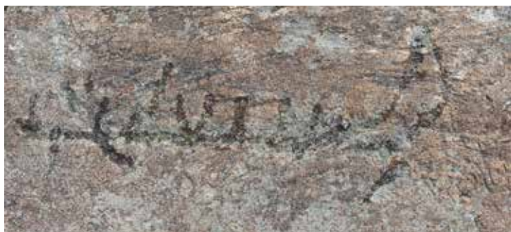
Skipshelleristning. Belyst på kvelden.

Fotsåler er tolket som et nærvær av en person eller en ånd/guddom, og en kan nesten føle det her. Hjordedyret kan være et uttrykk for at jakt var en viktig næringsvei i innlandet, selv om bronsealderens ristninger domineres av tamdyr. Men den vanligste tolkningen er å se på helleristningene som religiøse symboler og forestillinger.