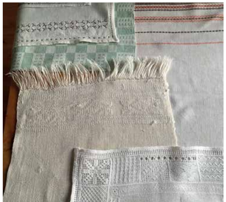
Vevd og brodert - noen av de vakre tingene Louise lagde på ungdomsskolen på Sørumsand for 70 år siden.