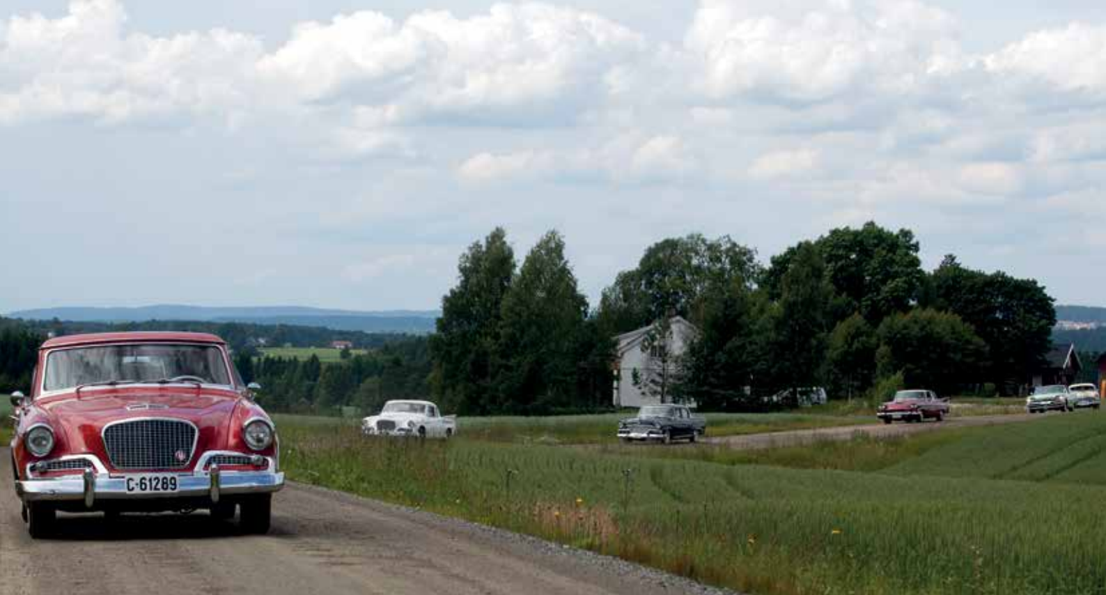
Eight Amcars Club er ofte ute på tur. Her kjører de på den gamle Aasgaardsvegen ved Leikvoll.