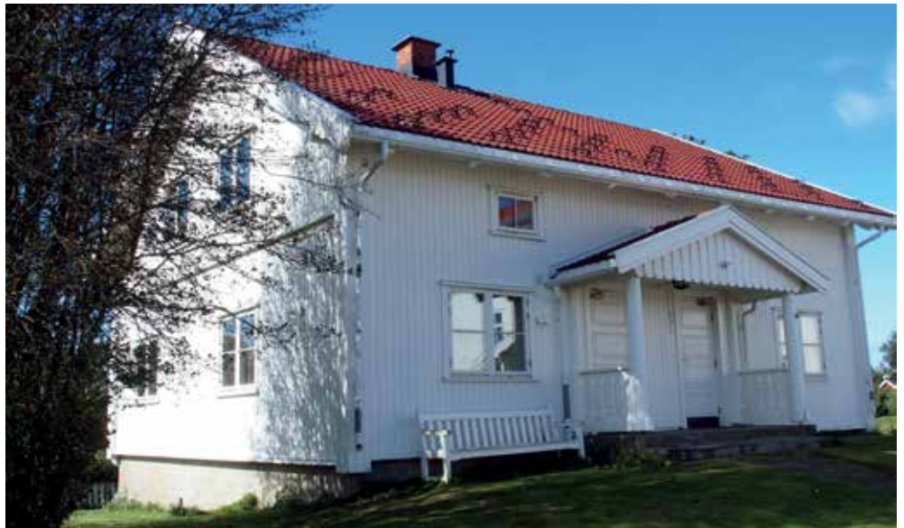
Veslebygningen på Nordli.