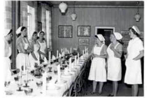
Husmorelevne ser stolt på et festdekket bord.

Husmorelevne hadde også produkter å vise fram. Alt det fine barnetøyet var