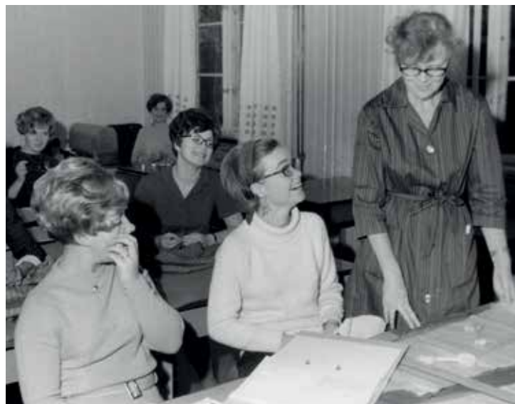
God kontakt mellom læreren og elevene!