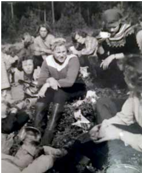
Tyttebærtur til Mangen på 50-tallet