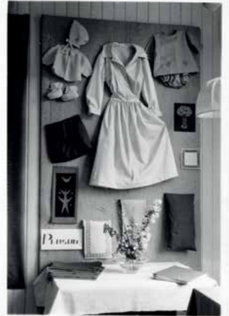
Flotte arbeider som viser variasjonen i det som ble produsert.

mest iøynefallende. Det var nydelige, små plagg, både strikket, heklet og sydd.