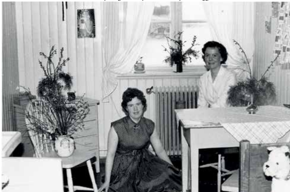
Jentene gjorde det koselig på rommene sine.