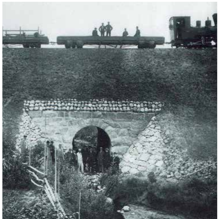
Kulverten ved Jødalsbekken var en imponerende konstruksjon da den stod ferdig 14. september 1896. Bildet er hentet fra boka Banen og Bygda .