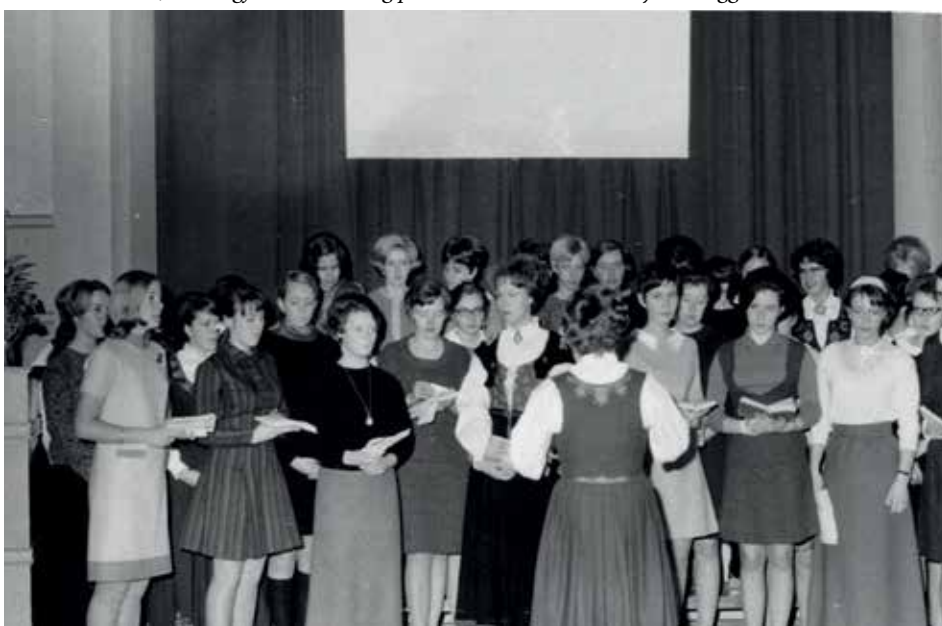
Skolens sangkor

Renhold og rydding av rommene var elevenes ansvar. Vask av trapper, ganger og vaskerom gikk på omgang. På vaskerommet kunne elevene vaske og stelle klærne sine. Rommet ble mye brukt og var ofte et samlingsted. Det var populært når det ble satt fram knekkebrød og brunost på vaskerommet om kvelden, slik at småsultne jenter fikk seg litt å tygge på før sengetid.