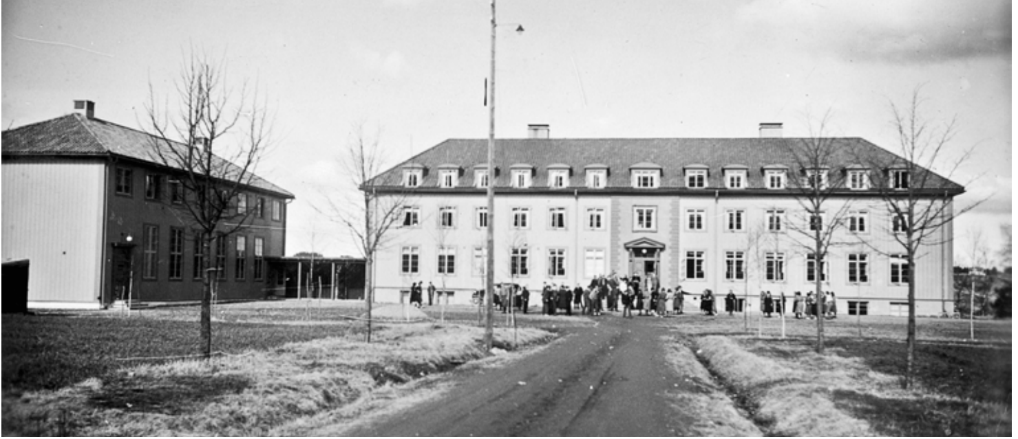
Her er skolen ganske ny, for alléen ser ut til å være nyplantet.

Det er flere skoler på Sørumsand, men når vi sier «Skolen» tenker nok mange på det som i dag heter Sørumsand videregående skole. Her har det vært skole for ungdommer på vei inn i voksenlivet i nitti år, og den er en viktig del av vår lokalhistorie. Vi vil ta et tilbakeblikk på det som har skjedd fram til nå, med hovedvekt på siste del av 1900-tallet.