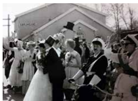
Nå legger brudeparet ut på bryllupsreise.