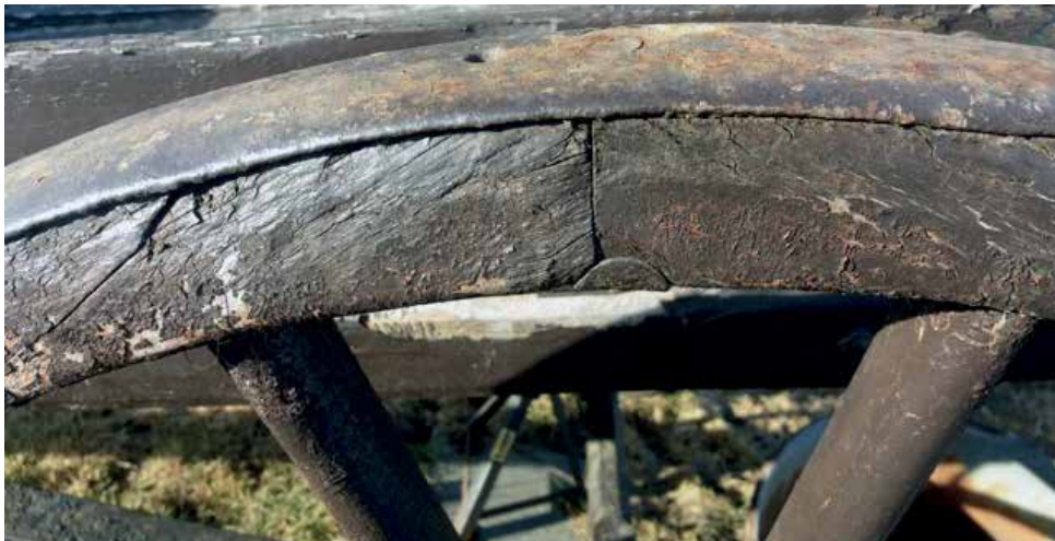
Disse to bildene viser eksempel på låsing av slitebane og segmenter med ett beslag i hver segmentskjøt.