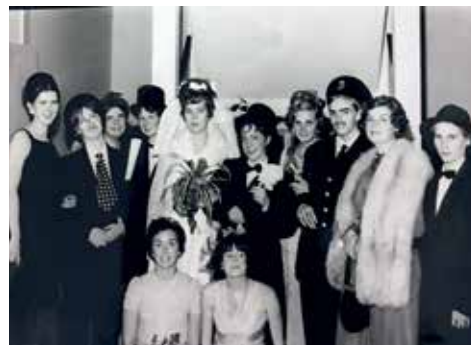
«Brudeparet» med brudepiker og sine respektive familier.

Kanskje noen fra Sørumsand også minnes bryllupene? Elevene skulle lære å stille til bryllup på ordentlig vis, og det ble mye moro og mye læring ut av det. I 50- og 60-årene da dette var et årvisst innslag, var det bare jenter på skolen, men alle roller ble besatt, brud, brudgom, forlovere og brudeparets familie. Bryllupsklær ble sydd (eller omsydd), festmiddag ble lagd, bryllupskake bakt og pyntet, bryllupsbord dekket, borddekorasjoner satt opp, og de obligatoriske talene etter skikk og bruk, ble skrevet og innøvd. Mange fag og ferdigheter kunne integreres i et slikt arrangement, der elever og lærere stod for det meste selv. Men selve brudebuketten ble bestilt fra blomsterforretningen, den skulle være profesjonelt utført! På den store dagen ble bryllupsfesten gjennomført, og noen ganger ble festlighetene avsluttet med opptog til stasjonen, der alle vinket farvel til brudeparet som dro på bryllupsreise med toget. Opptoget fikk alltid følge av