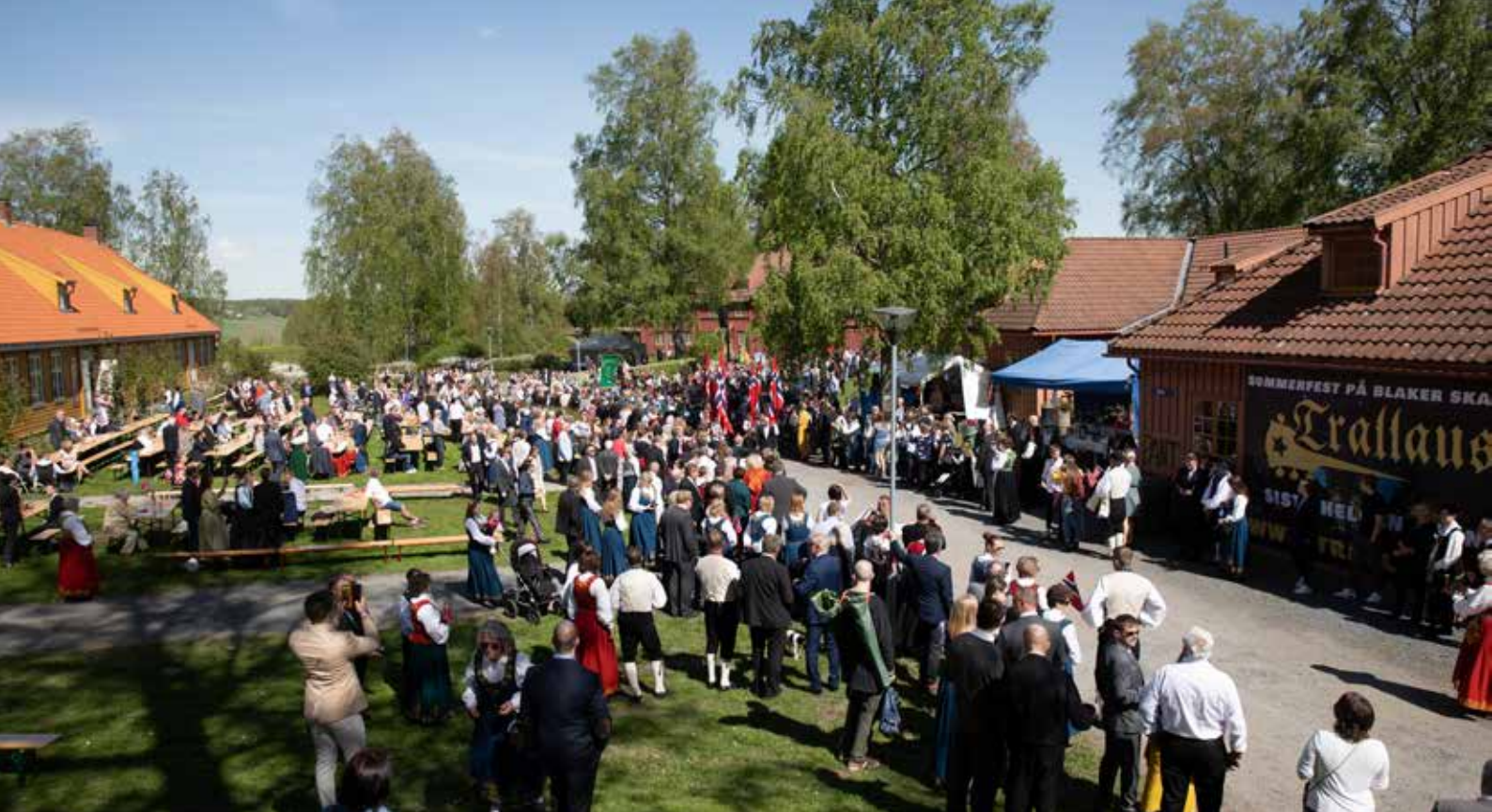
17. mai på Blaker Skanse 2019.