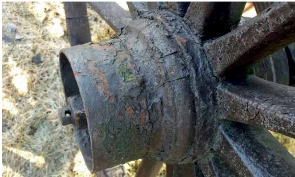
Dette er et boss med en stålring inne ved eikene og en del av et rør ytterst, som beskytter akseltappen og mutteren. Disse mutterne var låst med splint, men var også gjenget reks, henholdsvis links på høyre og venstre side av vogna. Dette for at mutteren ikke skulle skru seg av under kjøring forover.

En dag jeg, som skolegutt, var med far min i smia, kom et aldeles nytt hjul fra en hjulmaker. Det var trehvitt og alt for pent i ei svart smie. Hjulet ble lagt på to stålbukker. Hjulet hadde en diameter på litt over 40 tommer og 14 eiker. Hjulbanen besto av 7 segmenter og det var tappet inn 2 eiker i hvert segment. Bosset var også av tre.