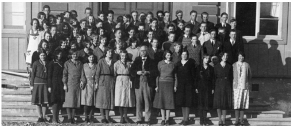
Lærelystne ungdommer med sine lærere. Her er et av de første kullene på Romerike ungdomsskole.