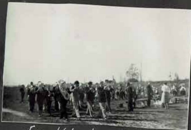
Fra Vølneberg skolen.

Feiringen av 17. mai de første etterkrigsåra var lagt opp nokså likt i alle bygder. Barnetog, gudstjeneste i kirka og samling ved skolene etterpå var opplegget som alle fulgte. Men dagen kunne nok likevel oppleves nokså forskjellig i de ulike skolekretsene, så også i Sørum. Sørum-Speilet vil her gi et lite innblikk i hvordan de som var skolebarn de første åra etter krigen opplevde 17. mai.