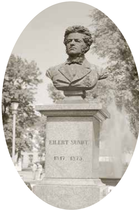
Bysten av Eilert Sundt er laget av billedhuggeren Mathias Skeibrok og står på Olaf Ryes plass i Oslo.

Vassvilling var kjennetegnet på kostholdet på Romerike, skriver Eilert Sundt. På de store gårdene var kjøkkenjenta i gang med arbeidet klokka fire på morgenen. Da satte hun på villinggryta for å ha den kokt til føredugurd klokka fem. Villinga ble kokt i vann på blandkornmjøl, blanding av bygg og havre, men husmennene fortalte at det ofte var bare havremjøl. Når villinga var kokt, trådte gjerne husmora til og hadde i litt surmelk som hun rørte i til det dannet seg små osteklumper. Disse osteklumpene var ansett som det beste ved villinga. Etter dette ble villinga øst opp i fat, og