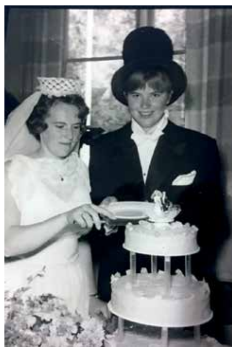
Tre etasjer må det være på bryllupskaken!