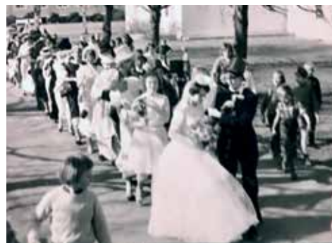
Brudfølget på vei opp alleen.