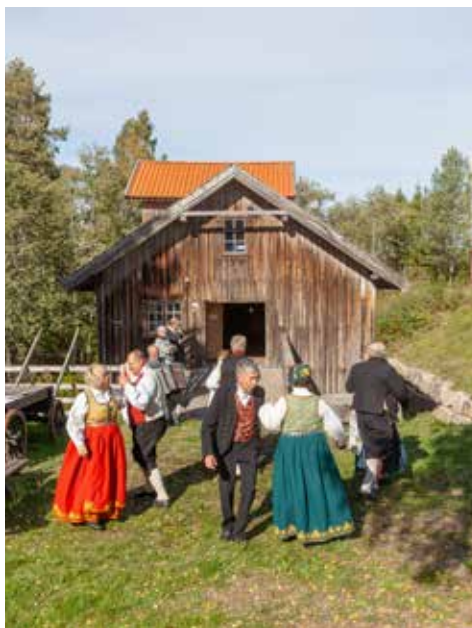
Sørum Leikarring i aksjon