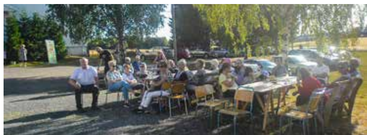
Godt oppmøte og hyggelig Olsokfeiring på Vølneberg.

Sørum Bygdekvinneleg, som bidrar stort til arrangementet, sørget for salg av rømmegrøt, kaker og kaffe. Historielagets loddsalg gikk også så det suste, og bidro til 7000 kroner i foreningskassen.