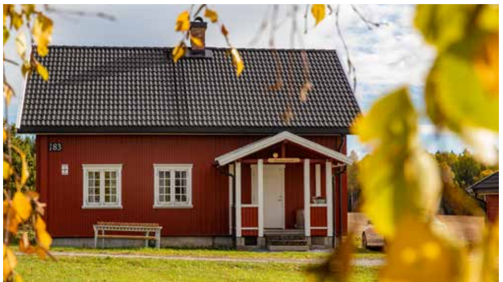
Arstun Vandrerhjem på Åsgård.

På nettsiden finner en denne informasjonen: “Vandrerhjem i bygning fra 1840 på en gård som er drevet av samme familie i 13 generasjoner. Pris kr 300. / Åpent hele året. / Avstand: 10 km fra leden (henter og bringer). /