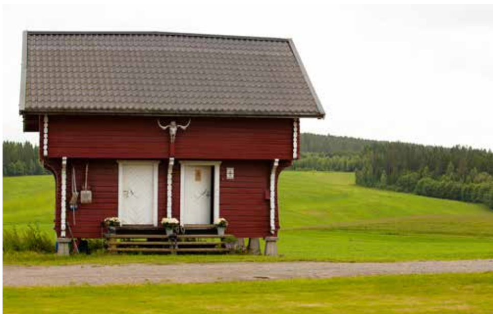
Arteid Pilegrimsherberge er beskrevet som en av Norges flotteste overnattingsplasser for pilegrimmer.

Dette overnattingsstedet er akkreditert og anbefalt av Nasjonalt Pilegrimssenter. Det har møtt samme krav og holder samme standard som overnattings-