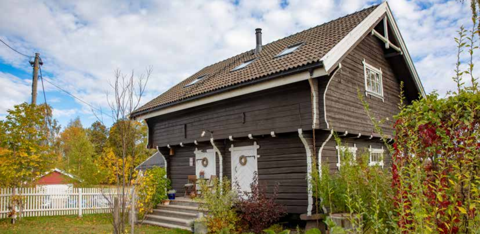
Det flotte stabburet på Fløgstad er innredet til et førsteklasses overnattingsted.

Betjent herberge. Frokost og matpakke inkludert. Leie av sengetøy og håndklær 70 kr. Internett.”