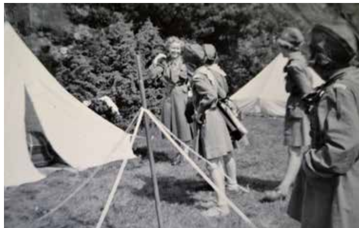
Troppsleir på Sjøstrand i 1956. Fremdeles er det hvite pyramide-telt.

Endelig kom beskjeden: Det ble leir for hele kretsen. Men