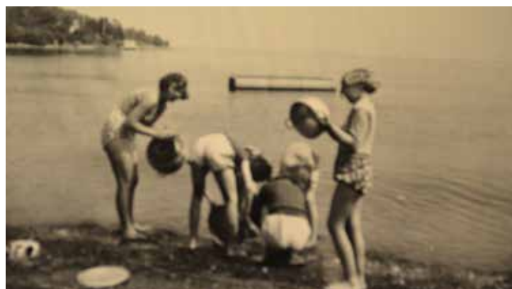
Skylling av oppvask i vannkanten på Sjøstrand.