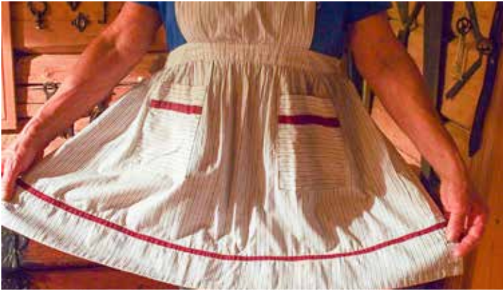
“Forklebildet er et av min mors forklær.”

“Jeg tror ikke at våre barn veit hva et forkle er. Hovedhensikten med bestemors forkle var å beskytte kjolen under fordi hun hadde så få.