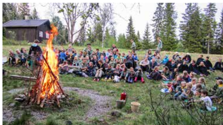
Leirbålet er et viktig innslag i speiderlivet. Her på Trollheimen i 2014.