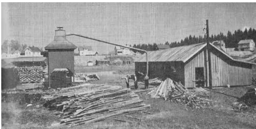
Saga i full drift: Her var det ikke bare en arbeidsplass for bearbeiding av tømmervirke. Tømmer og plank i store stabler, skogsduft og kvae inspirerte barna i Lørenfallet til spennende, men ikke helt ufarlig lek.