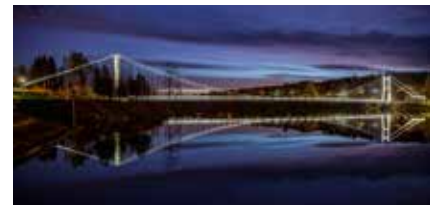
Rånåsfoss bru fremstår idag som et smykke i landskapet.