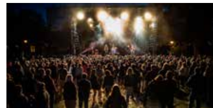
De siste seks årene har Kirsebom vært pådriver for å arrangere konserter på Blaker Skanse.