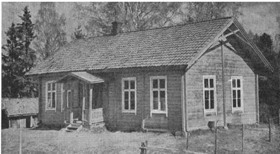
Avholdslokalet Alvheim: Stedet spilte en viktig samfunnsrolle i «gamle dager». Her var det foreningsvirksomhet av mange slag, både for barn og voksne. Sørum Totalavholdsforening hadde 176 medlemmer på det meste, men på slutten av 1930-tallet hadde antallet gått ned til 10. Faksimile fra Sørum Herred, Bind 2, 1961

Sørum Idrettslag ble stiftet i 1920. Idrettsplassen ligger sentralt og ble et samlingssted med mange aktiviteter – fotballbane, bane for herre- og damehåndball og skøytebane om vinteren. Det var et sted der familier møttes. Samlinger på St. Hans var populært. På slutten av 1950-tallet ble det første klubbhuset oppført sammen med Miniatyrskytterlaget og Sanitetsforeningen. Tidlig i 1960-årene startet Saniteten