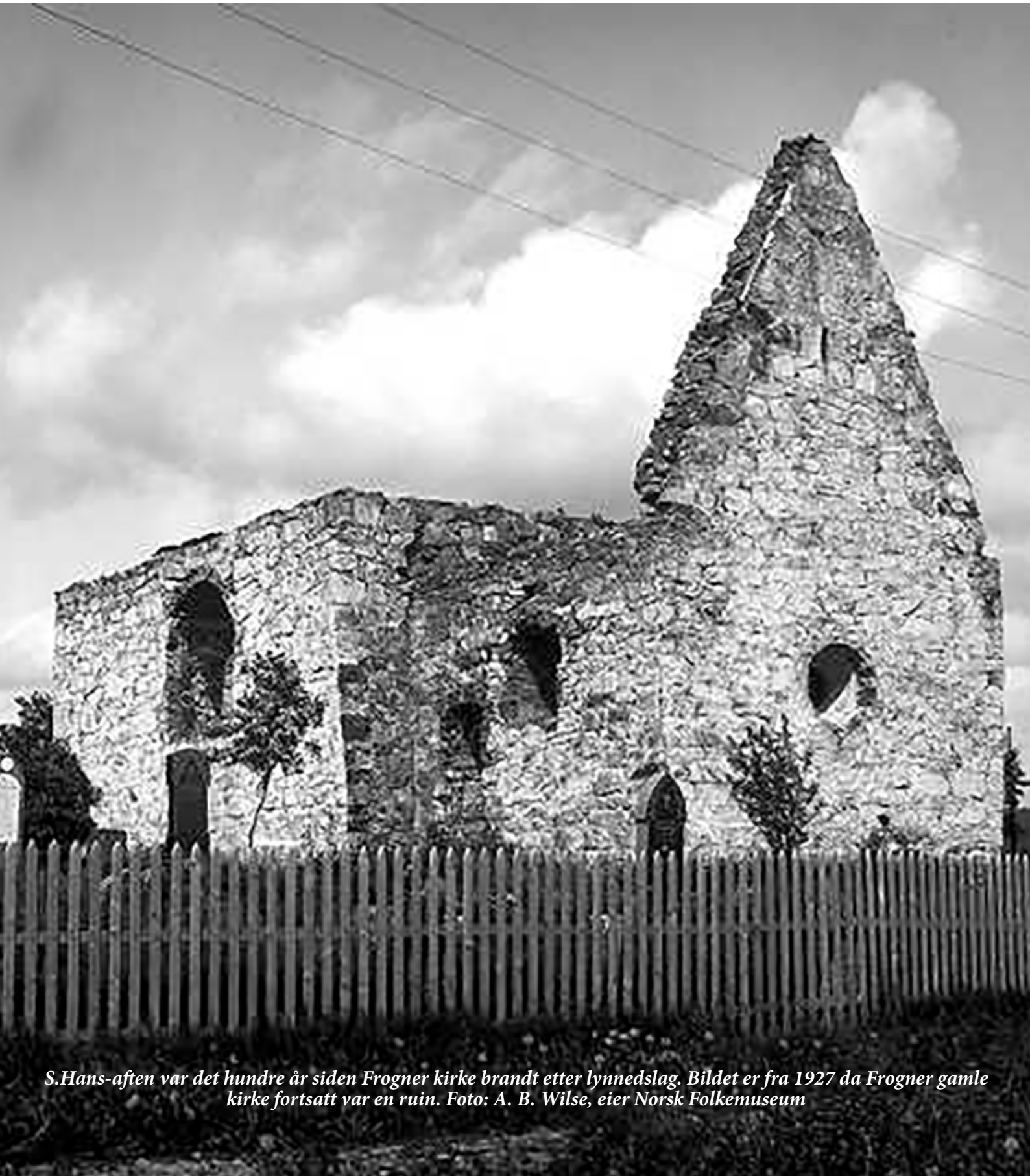
S.Hans-aften var det hundre år siden Frogner kirke brandt etter lynnedslag. Bildet er fra 1927 da Frogner gamle kirke fortsatt var en ruin.