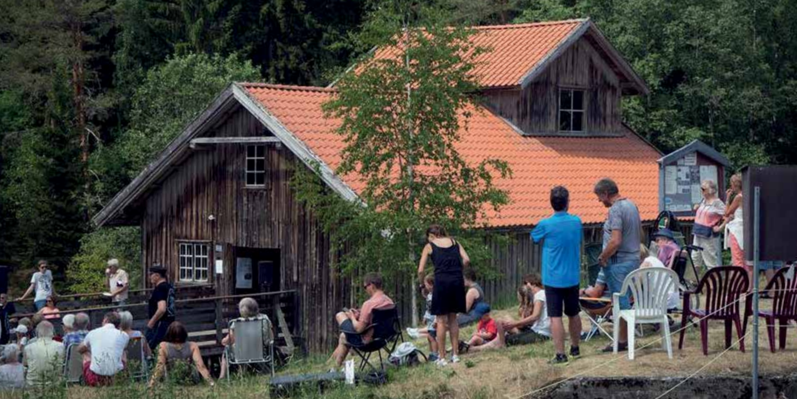
Fra Slora Mølles Dag tidligere i sommer.