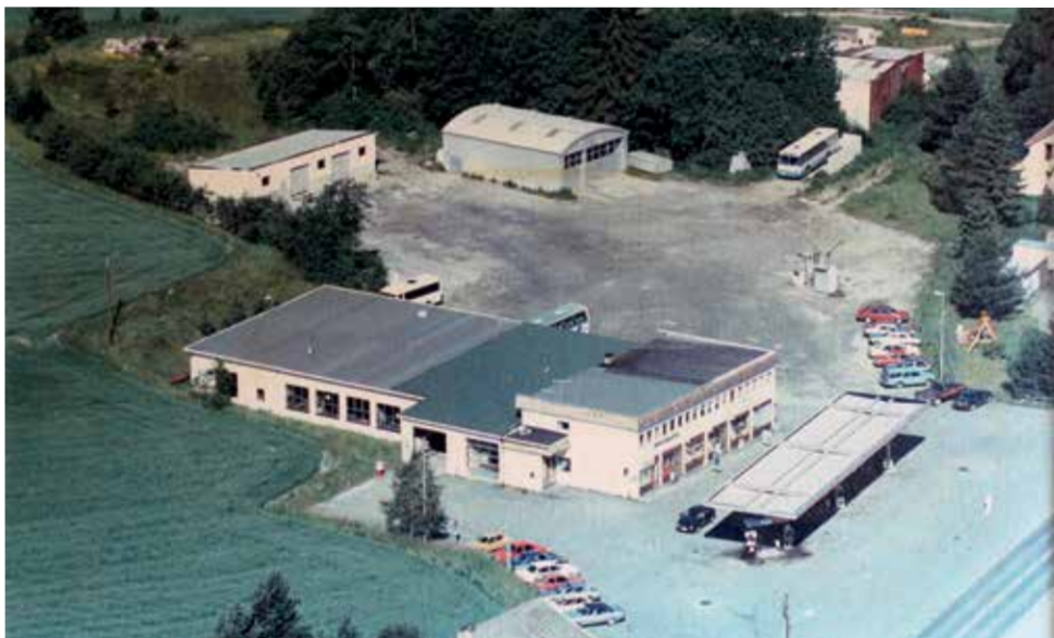
Bjerkes Rutebiler: Dette bildet ble tatt tidlig på 1980-tallet, mens stasjonen var merket Norol. I annen etasje holdt Sørums Bibliotek til. Bakerst i venstre hjørnet vises så vidt eiendommen Skogset, som brant ned på 1980-tallet.