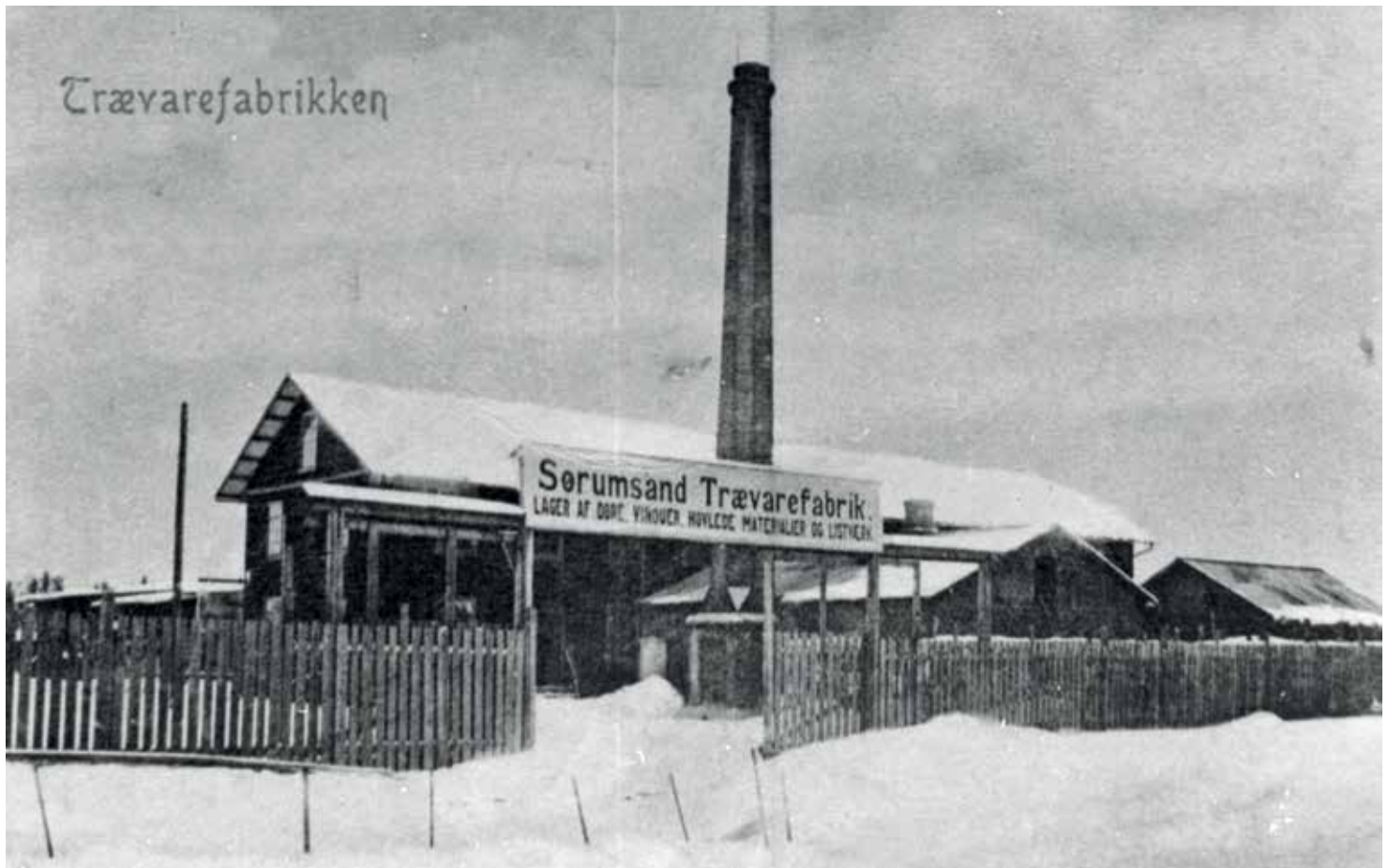
Postkort fra 1910 som viser inngangen til Sørumsand Trævarefabrik. Teksten på skiltet: «Lager af døre, vinduer, høvlede materialer og listverk». Kortet er utgitt av Larsen-Normann kortforlag. Gjengitt i Sørum bygdebok b. 3.