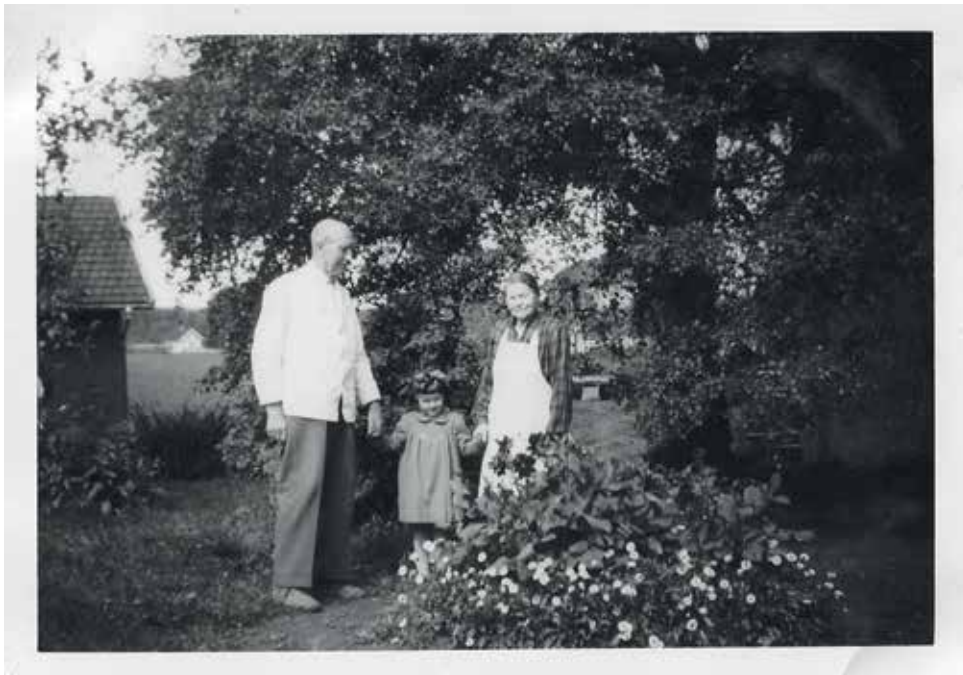
Mormor og morfar i hagen bak butikken (1952)