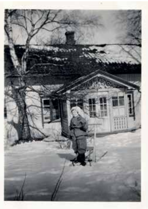
Huset der butikkeierne bodde. Her var den første landhandelen. (1952)