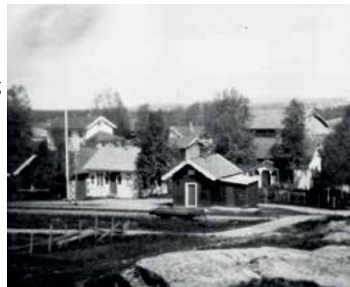
Utsikt over Kvevli-grenda fra Bikkjeberget (ca.1945)