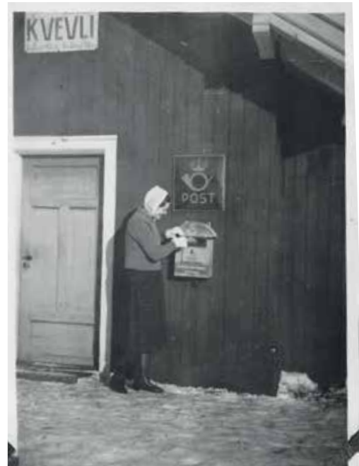
Postkassa hang på stasjonsveggen (ca. 1945)