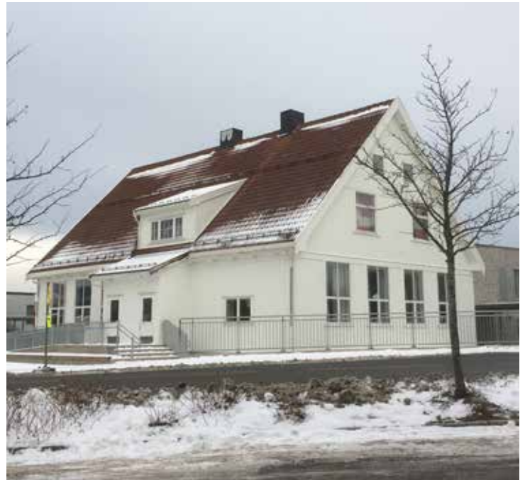
Forsiden med inngangsparti for oppussing.

Innendørs har alle panelovner, som begynte å bli gamle, blitt byttet ut. Det skal dessuten settes inn nye himlinger i gangen ved inngangspartiet. Å pusse opp skikkelig også