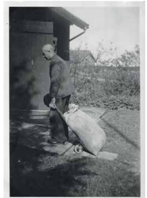
Morfar triller melsekk inn på lageret (ca.1950)

Framfor disse hyllene stod det en krakk. Der pleide karene å slenge seg nedpå hvis de var sendt for å handle, de satt ofte og pratet vel og lenge. Damer brukte sjelden å sitte, de hadde det mer travelt, og ofte hadde de med seg barn som maste og dro dem i skjortet. Til høyre var det en glassdisk med skap under, og inne ved veggen hyller med «manufaktur». Det var esker med undertøy til damer og menn og barn. Jeg husker de svære hvite og lakserosa dameunderbuksene, det virket helt utenkelig at en noen gang skulle ha på seg noe sånt. (Og det har jo ikke blitt noe av heller!) Så var det ruller med stoff, sysaker, garn, strømper og sokker. I glassdisken var det mange vidunderlige ting – smykker, hårspenner, ruller med blonder og silkebånd, glansbilder,