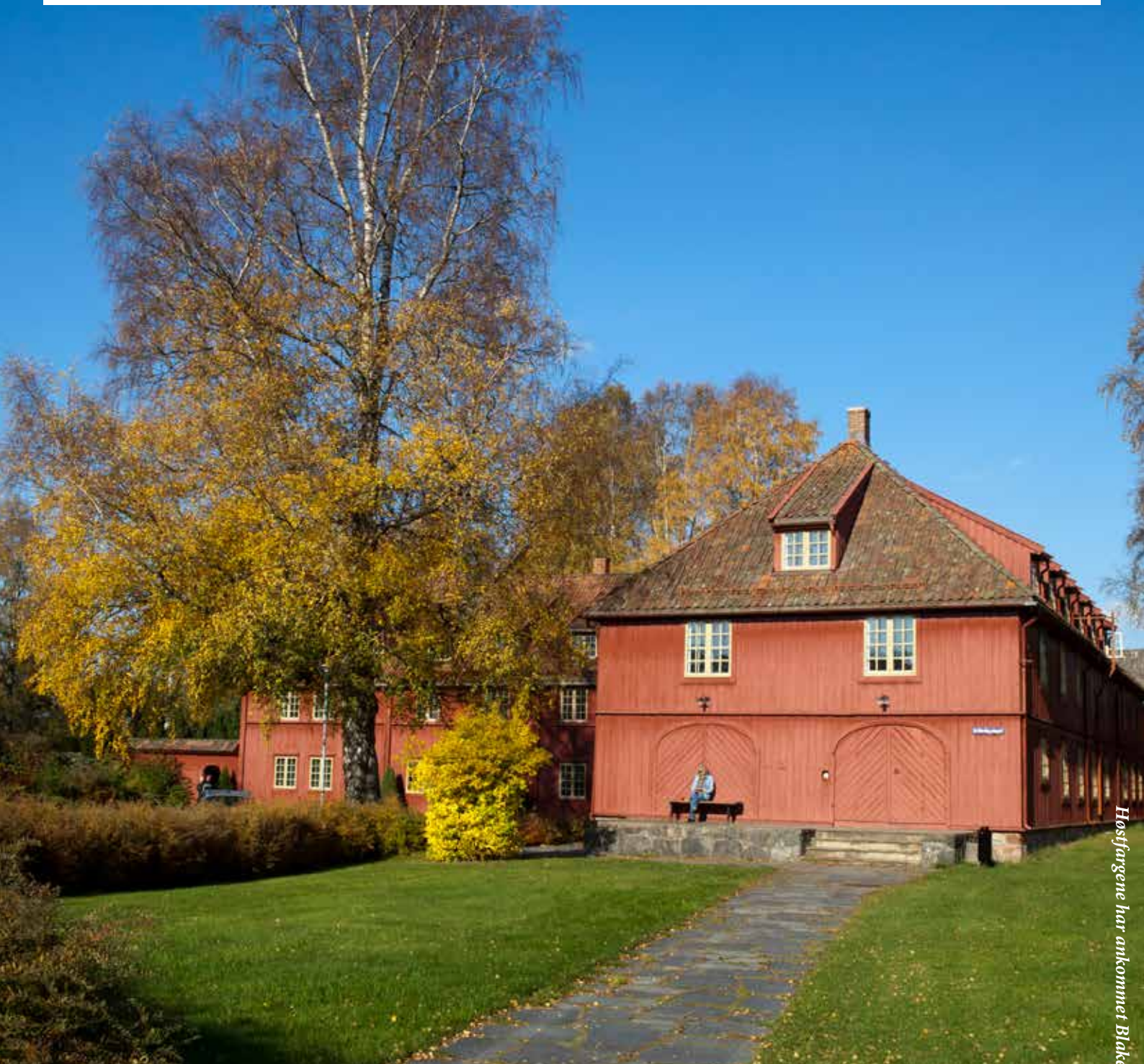
Høstfargene har ankommet Blaker Skanse.