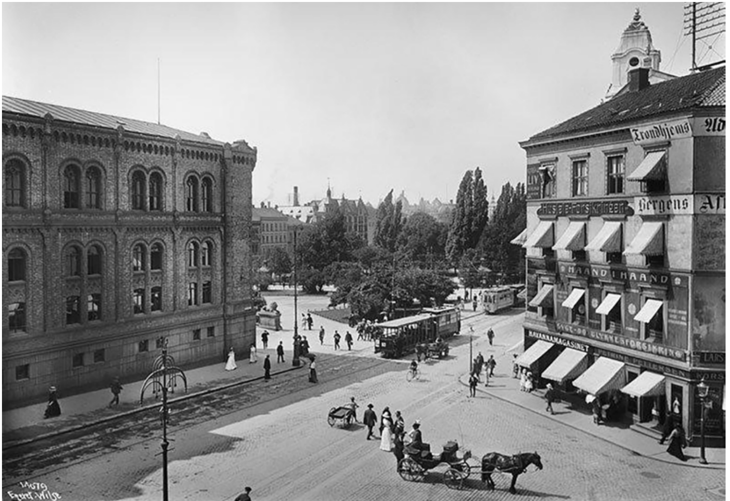
Bybilde fra 1912. Karl Johansgate med Stortingsbygningen til venstre. Kristiania fikk elektrisk sporvogn i 1894, men hesteskyss og drakjerrer var fortsatt sentrale transportmidler og det var ikke så mye folk å se i gatene.