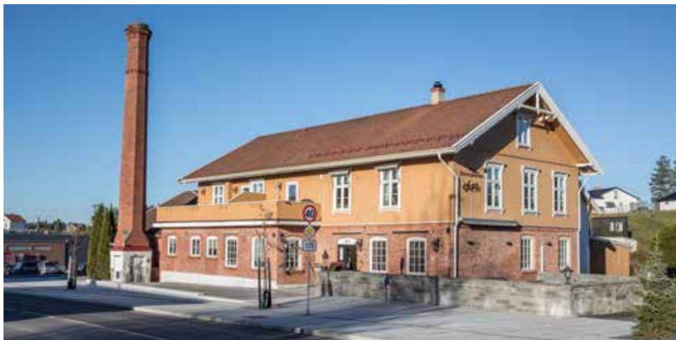
Sørum Meieri anno 2017, eller Meierigaarden Kro som den heter idag.