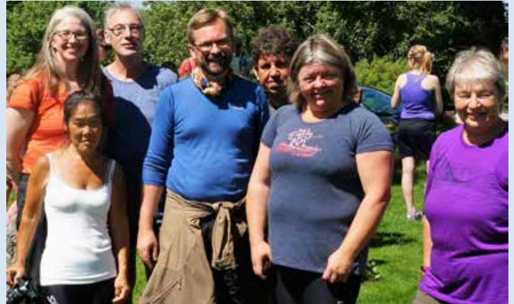
En gruppe pilegrimer tar en velfortjent hvil ved Frogner gamle kirke.

Langvandrende pilegrimer kom til Frogner gamle kirke på pilgrimsleden gjennom Sørum. Denne langvandringen går over Frogner hvert annet år. Det mellomliggende året går denne vandringen via Søsterkirkene på Granavollen i Gran kommune.