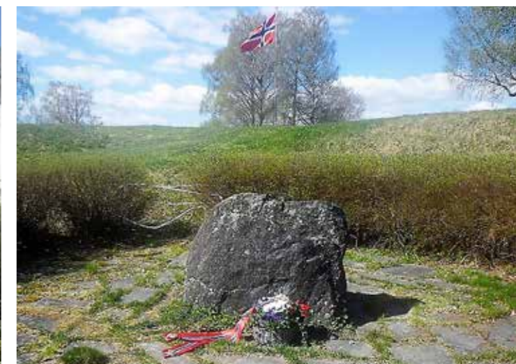
Krigsminnesmerket ved Blaker Skanse.