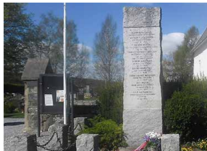
Krigsminnesmerket ved Sørum kirke.