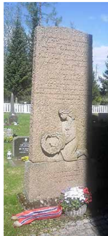
Krigsminnesmerket ved Blaker kirke.