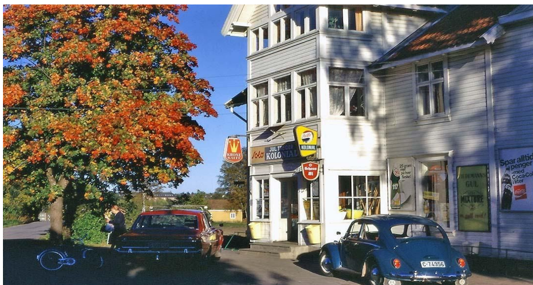
Treider landhandel ca 1970.