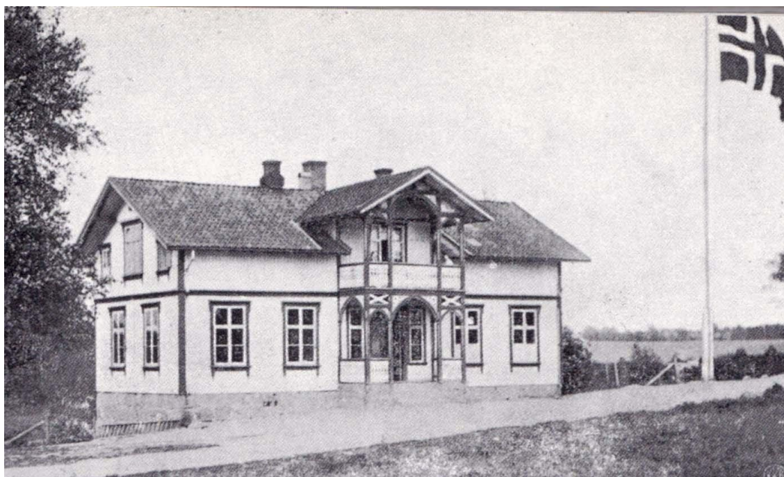
«Nyskolen» tatt i bruk i 1886. Foto fra ca 1915, ukjent fotograf. Kopi fra N. A. Dahl: «Aas herred»