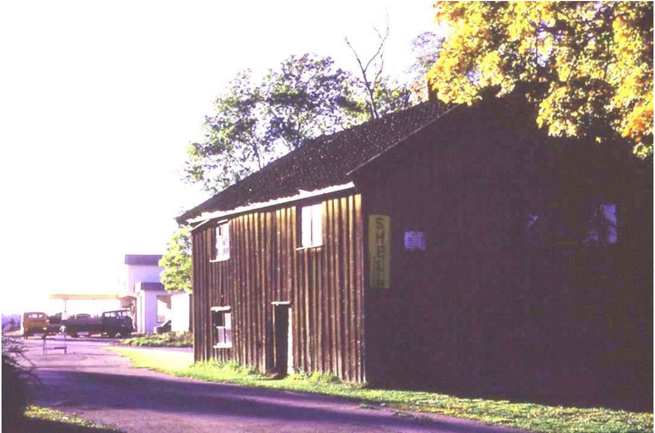
Korsegårdstunet. Skysstasjonen og skjenkestuen med Shell-merket på veggen. Stasjonen fra 1956 i bakgrunnen. Tatt i 1971.