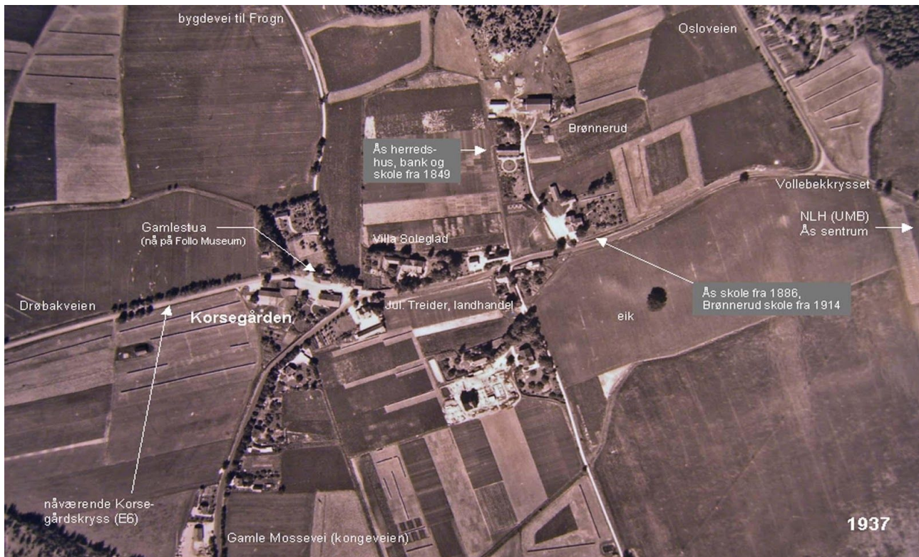
Flyfoto av Korsegården fra Widerø's samling tatt i 1937. Inntegning av Vidar Asheim