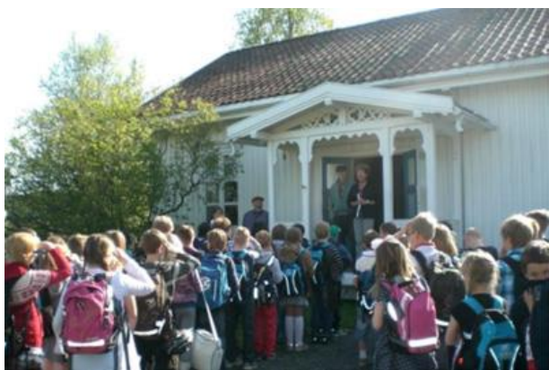
Bildet er fra gammeldags skole i 2012.

For å sikre kvaliteten, skal bruken av «Olavsrosa» være i samsvar med Norsk Kulturarv sine retningslinjer og godkjennes av dem. Innehavere av «Olavsrosa» betaler en årlig avgift som er differensiert etter omsetning. Norsk Kulturarv har et kvalitetssikrings- og oppfølgings-system som gjennom besøk og årlig rapportering sikrer at forutsetningene for tildeling av kvalitetsmerket fremdeles er gjeldende.