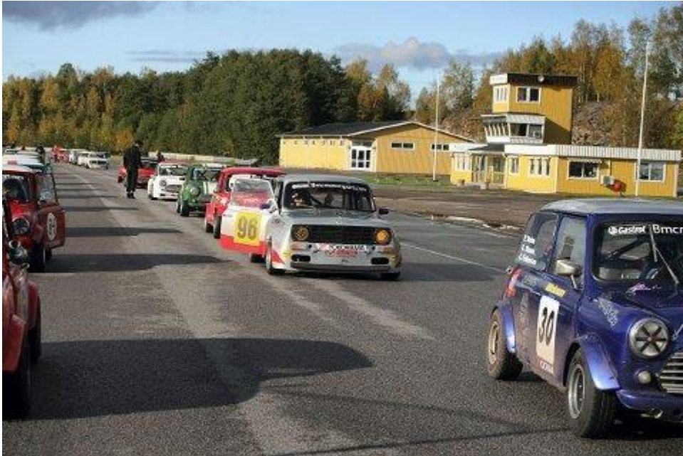
PÅ START-STREKEN: Sølvpilen Racing klar for fire timer på asfalten i Sverige.