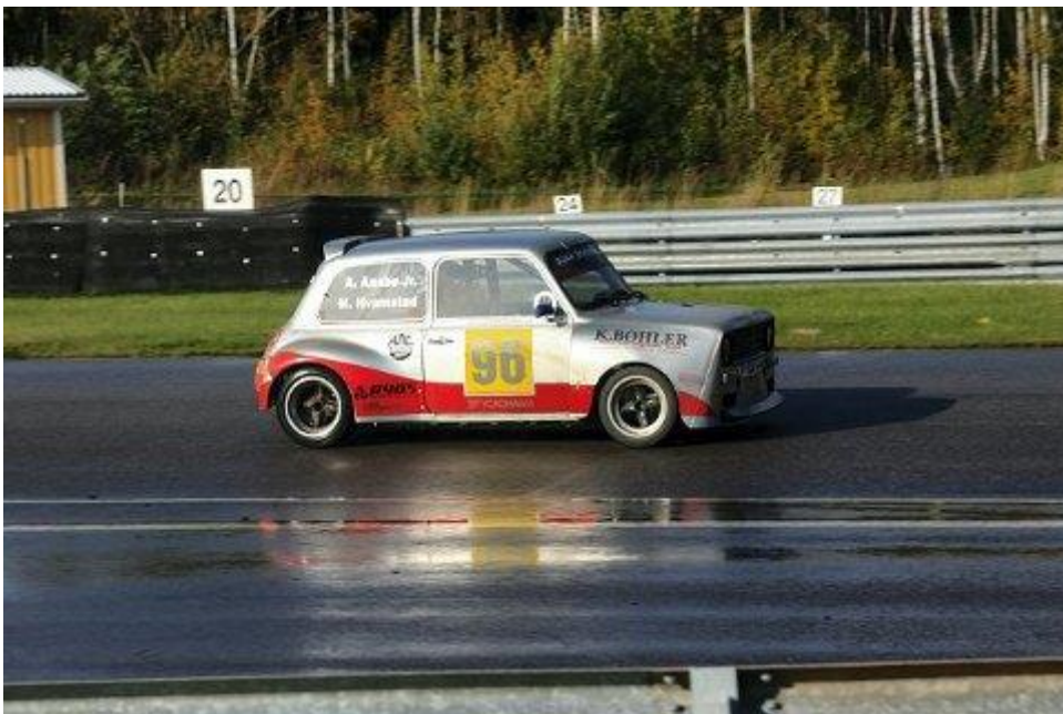
I FARTA: Minien i farta. Hastigheten kan komme opp i 180 kilometer i timen.