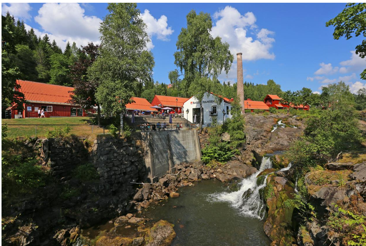
Parti fra Lomma ved Bærum's Verk