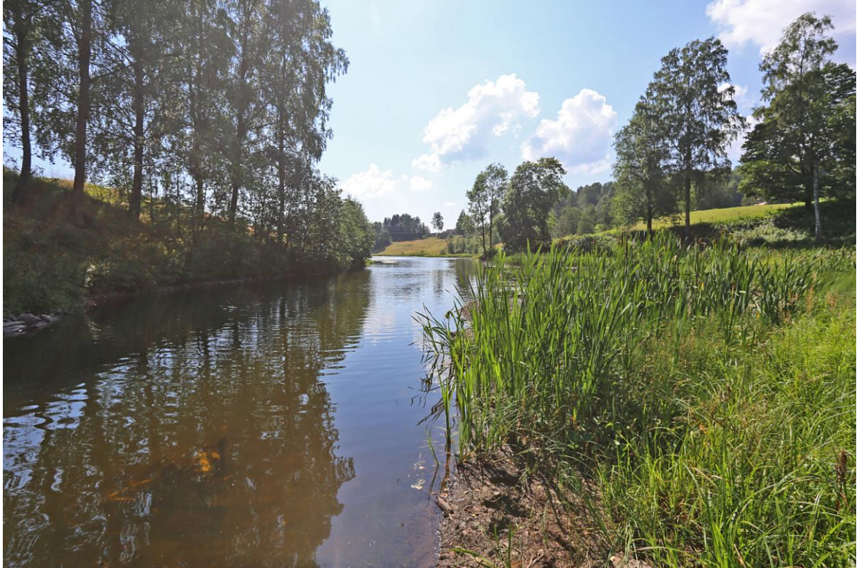
Parti fra Lomma ved Glitredammen

Vi har deltatt på møter i regi av Oslo Elveforum og Asker Elveforum. Vi samarbeider med Oslo Elveforum om undervisningsprosjektet Levende Vassdrag.