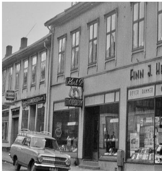
Butikken i Hagegaten på Tøyen i 60-årene.