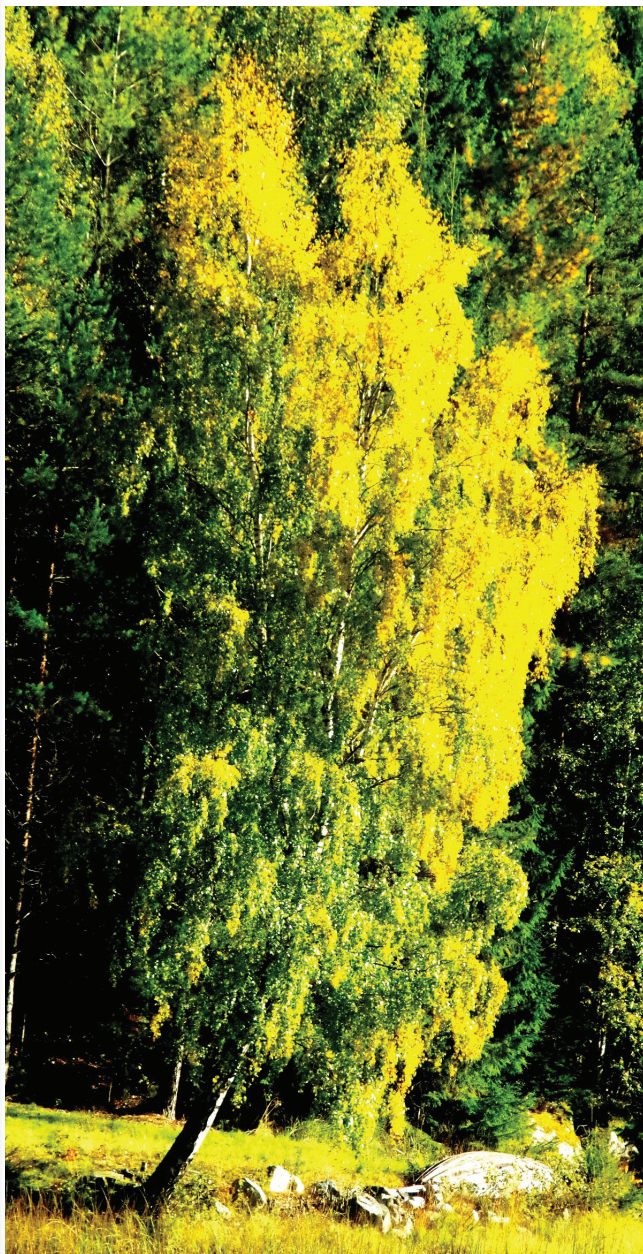
Bjerk i oktober