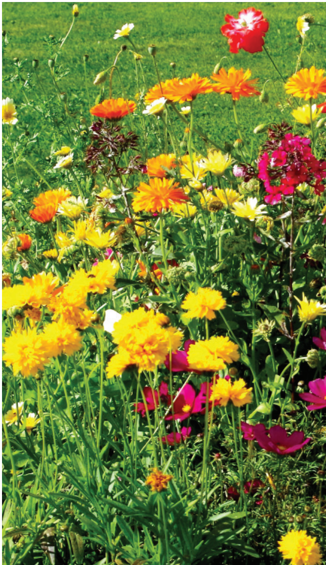
Fargesprakende blomsterbed. Tekst og foto: Vidar Lunde

I mars er vinteren på hell de fleste steder i Norge, og våren banker på døren. Den lyse og etterlengtede årstiden gjør mange av oss våryre og oppstemte. Vi ser frem til lengre dager og sola som ikke slutter å skinne før langt på kveld. Mange lengter etter latere dager, grilling, sommerregn, tordenvær, en fisketur og kanskje en svingom til trekkspillmusikk. Du har mulighet til å plukke blomster det ikke er mulig å kjøpe i en blomsterbutikk. Du ønsker denne årstiden veldig velkommen. Årstiden som tvinger mørket i kne. Det helt spesielle lyset du bare opplever i Norden. Mange fylles av spesielle minner. Inntrykk som kan tas med inn i høstens kaldere og kortere dager. I slutten av september er sommeren ugjenkallelig over. "Bildene" fra den lyseste årstiden, lagrer du i hodet og tar frem når du har behov for dem.