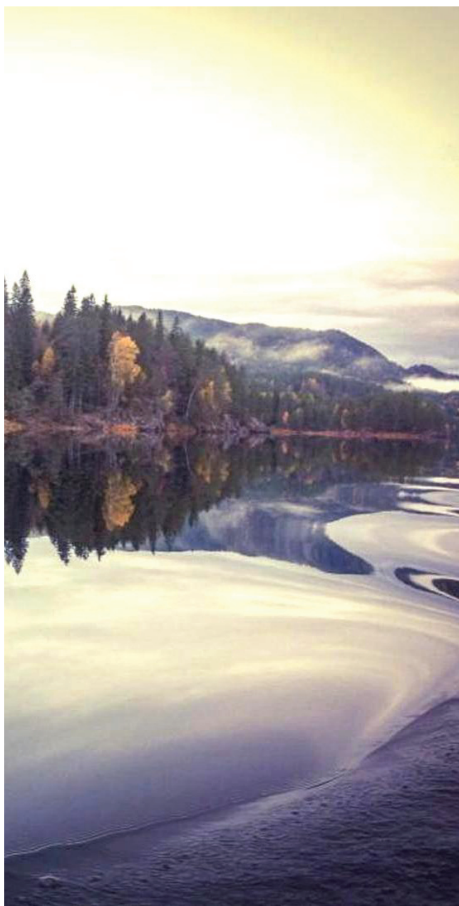
Høstbildet ved vannet. Tekst og foto: Vidar Lunde

En ny Losjesesong har startet. Brødre samles og kanskje snakker de om fiskestørrelser, sommerens lukter, lyder, smaker og positive opplevelser. Høsten er vakker med sine gyllne og røde farger og den friske luften. Det er tid til å kose seg inne. Kanskje å ta frem hobbyen som har hatt sommerferie. Høst betyr innhøstning av frukt, grønnsaker, bær, korn og sopp. Hummer- og krabbetegner gjøres klare, for hva smaker bedre enn et herremåltid med nettopp hummer og krabber. Noen foretrekker jakting og viltsmak i munnen til middag. Vinteren innbyr til skigåing og trolig brukes TV-søkeren mer når nettene blir lengre og kulda setter inn.