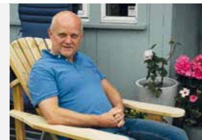
Tekst, melodi og arr: Eivind Johnsbråten 2016

Kopi fra Sørums Menighetsblad, nr. 5, 2015.