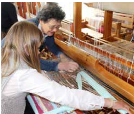
En fillerye blir til i samarbeid mellom den yngre og eldre garde.