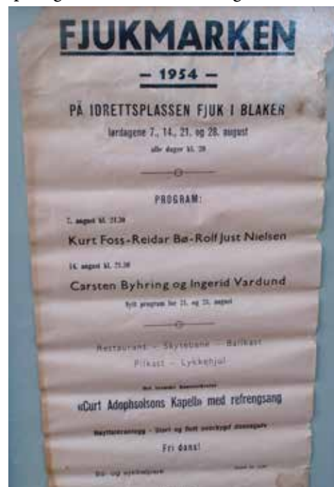
Plakat fra 1954. Som vi ser er det mange berømte artister ventende til Fjuk dette året! Tydeligvis er det blitt gratis å danse, men det er mange andre måter å skaffe inntekter på. Den observante leser vil se at Blaker Idrettslag står som arrangør her. I 1951 ble FSK og BIL slått sammen til ett lag.

Den artisten som samlet aller mest folk, var den svenske trekkspillkongen Carl Jularbo. Det var i 1955, og den kvelden var det mer enn 1500 besøkende. Han var svært berømt og populær, og den dag i dag kan de fleste antakelig nynne noen strofer av både «Livet på Finnskogen» og «Drømmen om Elin». Men egentlig skulle Jularbo hatt sin opptreden på idrettsplassen på Finstadbru – hos erkerivalen! Finstadbru Idrettsforening hadde nemlig også begynt med utefester om sommeren, og arrangerte sin «Finstadbrumarken» samtidig med Fjukmarken i nabobygda. FIF og FSK konkurrerte altså ikke bare på idrettbanen, men også om det samme publikumet og inntektene. Men dette året skjedde en tragisk ulykke på Finstadbru noen dager før arrangementet skulle gå av stabelen. Festlighetene der måtte dermed avlyses, men så kom noen på å spørre om å få leie Fjuk Stadion så Jularbo kunne komme likevel – det ville jo bli et stort tap hvis de måtte avbestille ham. Det gikk markenskomiteen på Fjuk med på, og dermed ble det en legendarisk