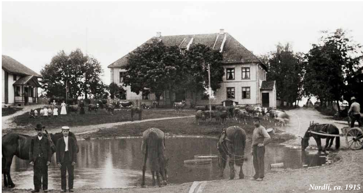
Nordli, ca. 1915