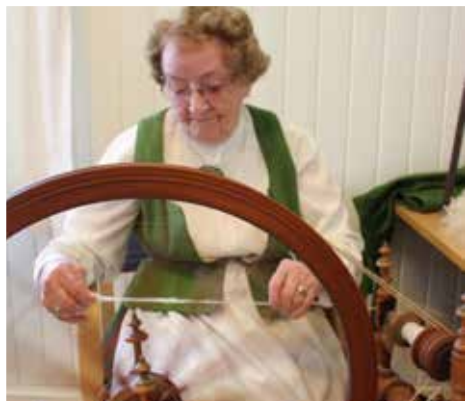
Jeg poengterer at hun kan bli en fabelaktig trommeslager, slik hun holder takten med det ene beinet, mens hendene trakterer ullråden i full fart.

En av elevene lurer på hvem jeg er, og når jeg sier at jeg skal skrive en sak om "Gammeldags skole", så oppfordrer han meg til å skrive at Vesterskaun er verdens beste skole med verdens beste lærere. Den unge gutten legger til at "Gammeldags skole" er kjempemorsomt. - Mye morsommere enn vanlig skole!