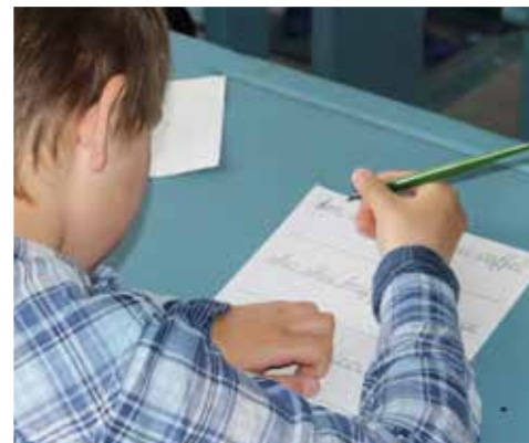
Det er enklere å skrive ved hjelp av tastaturet på datamaskinen, men resultatet blir vel ikke akkurat like sjarmerende?