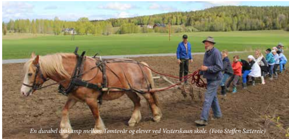
En durabel drakamp mellom Tømtevær og elever ved Vesterskaun skole.

Mandag 18. mai 2015 var en begivenhetsrik og spennende dag for både store og små på Vølneberg. Fjerdeklassingene fra Sørums og Vesterskaun skole deltok på den sekstende utgaven av "Gammeldags skole", som ble avsluttet med overrekkelsen av Norsk Kulturarvs kvalitetsmerke Olavsrosa til Vølneberg gamle skole.