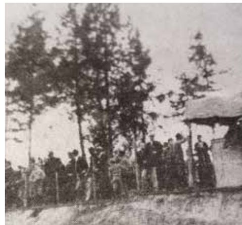
Fra denne boden ble det solgt trollkrem på innvielsen av Fjuk Stadion. Som vi ser er køen lang!