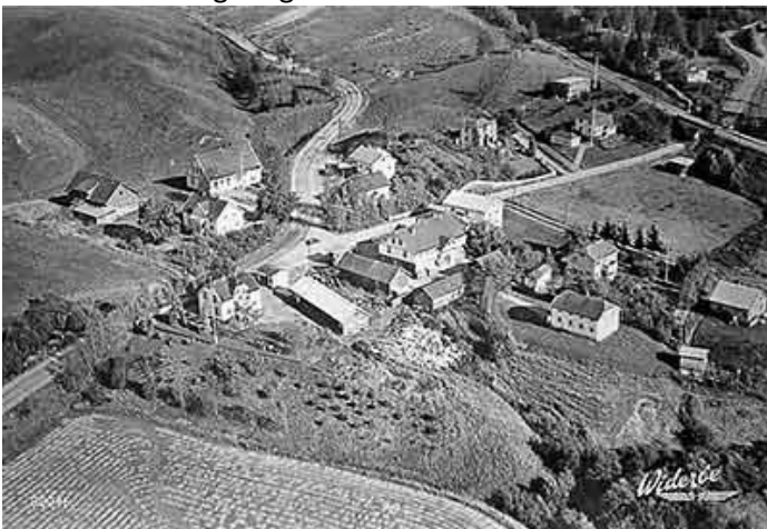
Flyfoto av Frogner i 1954.

På Leirsund var det meieri, landhandel, poståpneri, mølle og sag så den viktigste trafikken til og fra Børke gikk om Leirsund. Hovedbanen som åpnet i 1854, ble lagt over jordene på Børke øst for gårdstuna og krysset Leira mellom Børke og Frogner.