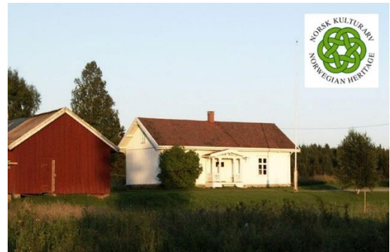
Vølneberg gamle skole