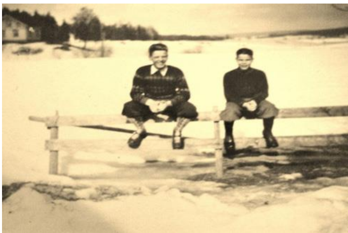
To av brødrene Hagen med nikkere, hjemmestrikkede strømper og gensere.

Mamma strikket også sokker av bomullsgarn som vi brukte om sommeren. Som oftest var de hvite, men av og til fikk vi tak i garn i andre farger. Jeg husker godt noen oransje sokker jeg fikk en gang jeg skulle i bursdag, og da følte jeg meg så fin med de sokkene og nye, hvite turnsko. Mamma hadde strikket dem om natta, og jeg syntes fargen var så fantastisk flott!