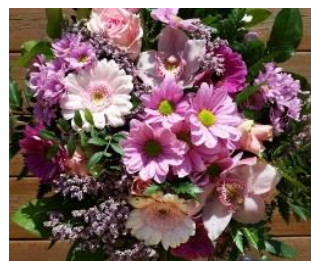
Flotte blomster ble overrakt av Dag Winding-Sørensen til dem som fikk hederstegn.

Støtte til de store prosjektene. Årsmøtet støttet de store prosjektene knyttet til historielagets eiendommer Slora Mølle og Vølneberg gamle skole spesielt ved å vedta punktene 5 og 6 med akklamasjon.