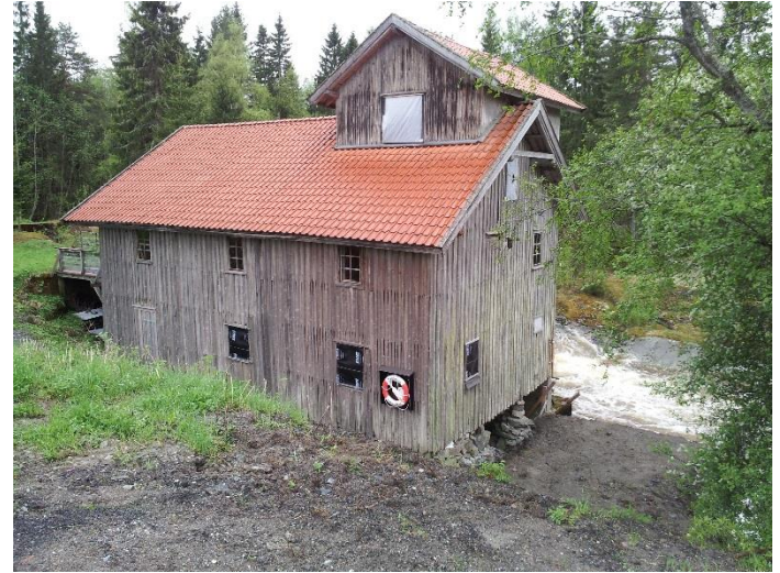
Slora Mølle.

fosser i Toreidelva som alle ble utnyttet til sag- og møllebruk, Slorafossen, Trangfossen og Mjølukfossen.