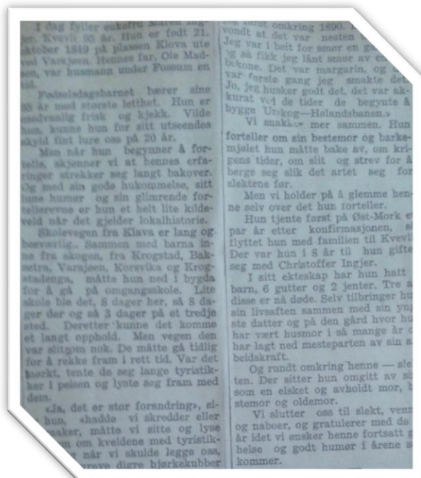
Intervjuet sto i Indre Akershus Blad 21.10.1944