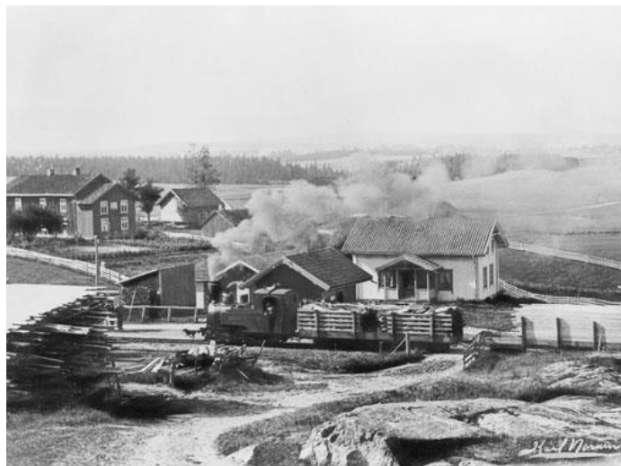
Postkort fra Kveli stasjon

Går vi fram til hennes alderdom, var ting helt annerledes. Fra hjemstedet på Ingjer var det under en kilometer til Kveli stasjon, og grenda hadde næringsliv av alle mulige typer: Gardene sendte mjølk til meieriene med Tertitten eller med bil, og man hadde sag, trevarefabrikk og kornmølle, for å nevne noe. Norge hadde gått fra jordbrukssamfunn til industrisamfunn, også på lands-bygda. Og ikke minst: Da hun forlot denne verden, hadde hun hatt stemmerett på lik linje med ektemannen i 37 år.