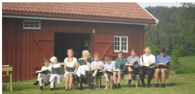
Skuespillerne er i gang med forestillingen, og på bildet nedenfor får de velfortjent takk for innsatsen.