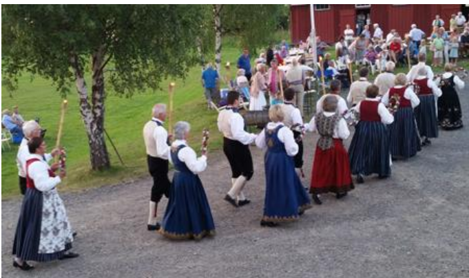
Sørum Leikarring i sine flotte bunader.

Og Sørum Leikarring avsluttet kvelden i sine vakre bunader og innviklede folkedans-turer med fengende trekkspill-akkompagnement, og betagende fakkeltog og sang ved solefall. En minnerik kveld for alle som var der.