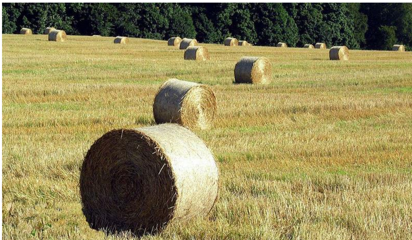
Halmballer er et velkjent og flott syn rundt omkring i Sørum på høsten.

SOMMEREN 2014 er på hell. De fleste har vel fylt batteriene sine til vinteren, dersom man har hatt anledning til å nyte livet i sommervarmen. Det har vært en begivenhetsrik periode på mange måter. Les Lederens spalte på side 2.