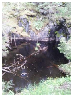
Tekst og bilder: Dag Winding-Sørensen