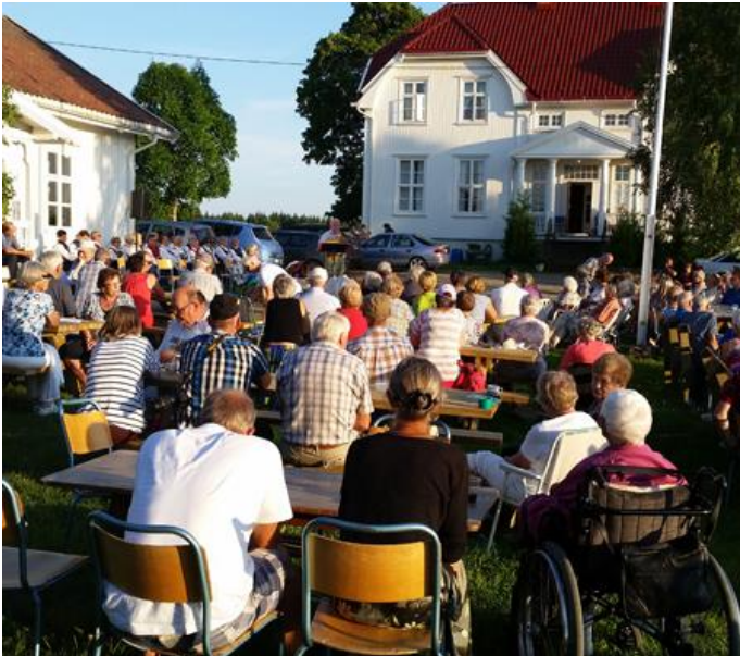
Mange kulturinteresserte tilhørere.