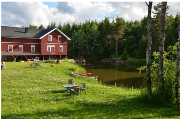
Bakke mølle.

Velkommen med på studietur med buss til Re kommune i Vestfold. Vi besøker Bakke mølle som er under restaurering, og som i likhet med Slora Mølle, har fått betydelige tilskudd fra Norsk kulturminnefond. Og vi får i tillegg omvisning på Våle gamle prestegård, som eies av Våle historielag og drives som museum og selskapslokaler.