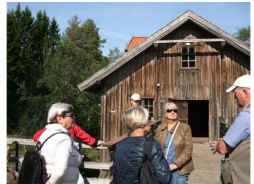
På Slora Mølle.