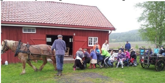
Moro med hest og vogn på gammeldags skole