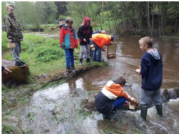
7. klasse i arbeid