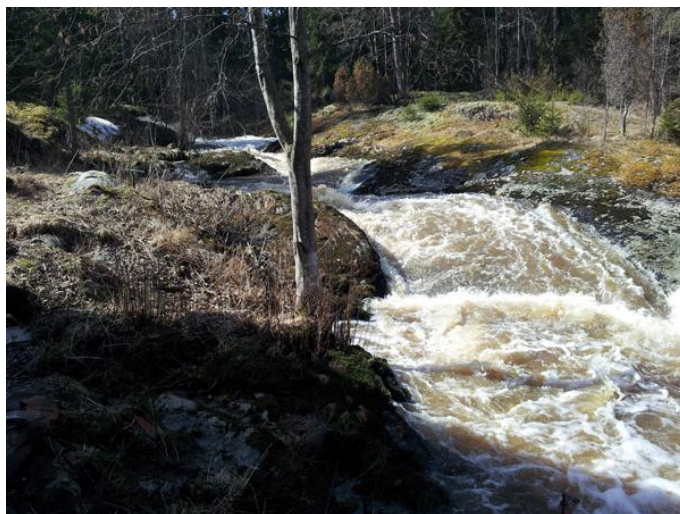
Slorafossen om våren

Tekst & foto: D.Winding-Sørensen, leder Slora Mølles Venner