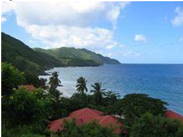
St. Croix - nordvest kystlinje

betenkning til Kongen der han frarådet å oppheve negerslaveriet.