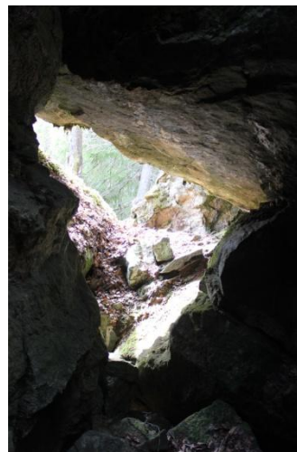
Utsikt inne fra "Tjuvhølet"