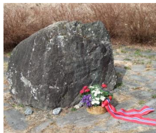
Bildene viser minnesmerkene ved Sørum kirke (øverst t.v.) ved Blaker kirke (øverst .h.) og ved Blaker Skanse.