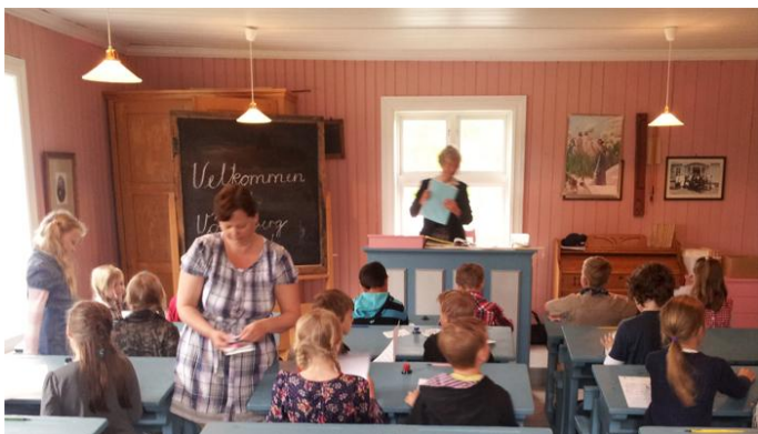
I den gammeldage skolestua.