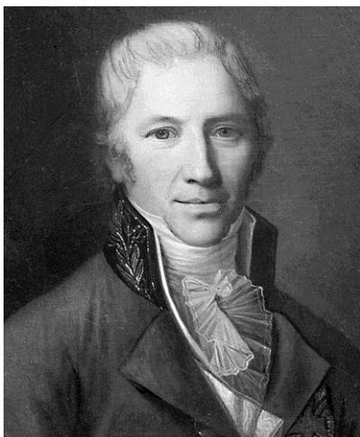
Christian Colbjørnsen. Maleri av Jens Juel ca 1790.