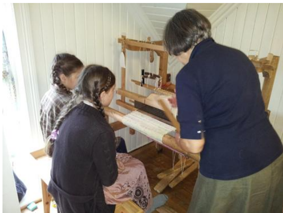
Gammeldags skole: Vevkunstens gåter...