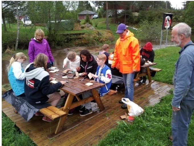
Kulturminneadopsjonsaktivitet på Slora Mølle 23.mai

Tanken er at den modellen kan vises på alle barneskoler i Sørum for å gjøre flere kjent med hva som finnes i bygda.