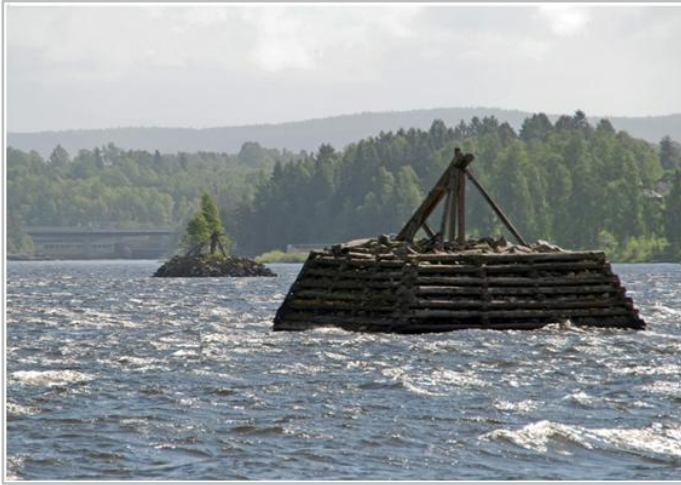
Bingen Lenser.