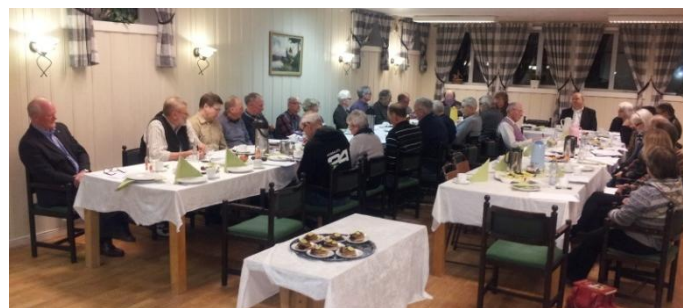
Årsmøtedeltagerne benket rundt bordene.

Finn Hallings jubileumbok om UHBs historie ble også flittig omsatt da serveringen startet til 32 sultne kvinner og menn kl. 20.00. Klok av skade hadde historielagets styre denne gangen sørget for varme karbonadesmørbrød og godt med kaffe, før høye rundstykker kom på bordet med diverse fristende pålegg. Da gikk samtalen livlig rundt bordene og små og store hendelser i bygda ble analysert. Kjøkkenet på Bruvollen fornekter seg ikke, og alle var tilfreds før årsmøteforhandlingene startet kl. 20.45.