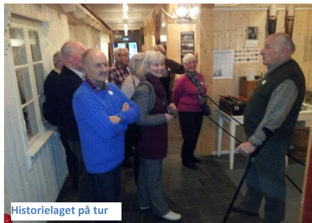
Historielaget på tur