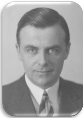
Arne Sørli.

«Arne Sørli (født 2. april 1904 på Sørum i Akershus fylke, død 17. mai 1969 i Tromsø), var en norsk komponist.