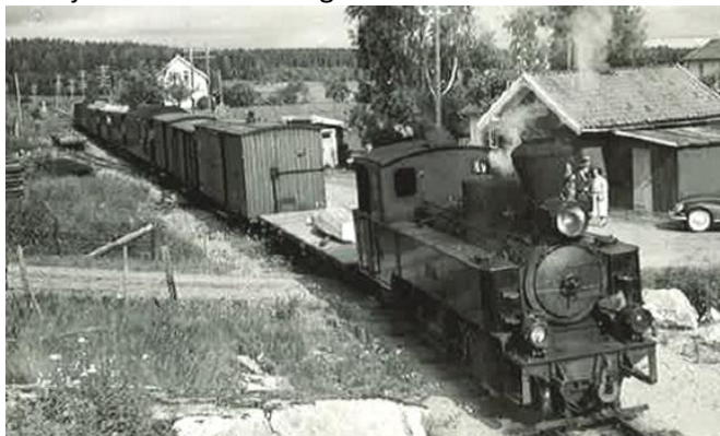
Tertittten kommer.

Om jeg fikk lov å prøve brekket, husker jeg ikke, det skal vel spørres. Uansett var det å være med på denne turen stort! På Bjørkelangen hadde jeg heller ikke vært før, for verden var ikke så stor for en tolvåring på 40-tallet. Jeg husker at jeg syntes det var best å holde meg i nærheten av stasjonen mens vi var der, så ukjent som jeg var. Hjemturen gikk med ettermiddags-toget, som vanlig betalende passasjer. Kjeldsrud hadde ikke tjeneste med det toget.