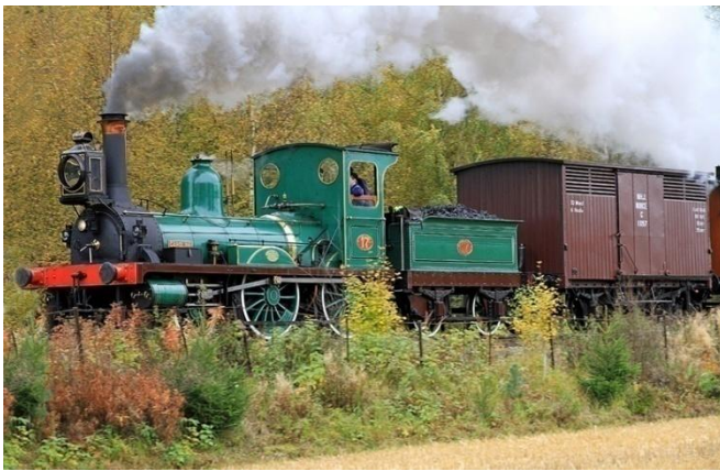
Caroline i damp og prakt

Disse tre mulige alternativene ble kalkulert og grundig vurdert. Den billigste løsningen ville være fra Trøgstad (Jessheim) via Kongsvinger til Magnor. Linja fra Lillestrøm via Fetsund til Kongsvinger ville bli litt lenger og derfor noe dyrere, men den totale reiselengde ville bli kortere med denne linja enn den fra Trøgstad. Linja Lillestrøm – Fetsund Blaker – Aurskog – Skillingmark ville bli den korteste, men likevel den dyreste da anleggskostnadene pr. kilometer ville bli over 80% høyere på denne linja. Et avgjørende moment for valg av linje var hvilken nytte den ville få for de distriktene den gikk gjennom. Linja om Aurskog – Mangen - Eidskog ville gå tre mil gjennom nesten ubebygde områder på norsk side, og på svensk side var det dessuten liten interesse for en jernbane gjennom Skillingmarksdalen. Det ble derfor argumentene for en linje via Kongsvinger som kom til å veie tyngst, og av disse to alternativene var argumentene for Glommalinjen de sterkeste. Denne