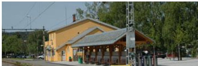
Sørumsand stasjon.