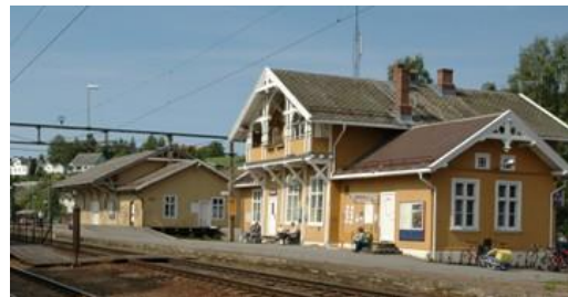
Fetsund stasjon.