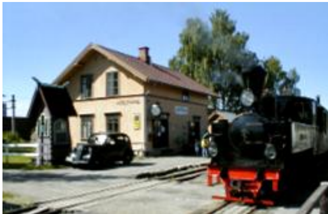
Tertitten på Sørumsand

Berghs visjon om en forbindelse fra Blaker til «Det haldenske Kanalanlæg» ble også virkelighet, men det tok lang tid. Først i 1896 ble den første delen av Urskog-Hølandsbanen åpnet for trafikk.