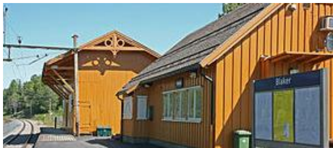
Blaker stasjon.