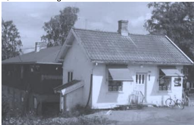
Kvevli-butikken, like før den ble revet i 1979. Det nye huset med leilighet og butikklokale skimtes i bakgrunnen.

Men tidene hadde forandret seg. Mange hadde nå jobb utenfor grenda, kom tilbake sent på ettermiddagen og handlet på hjemveien. Etterhvert hadde jo alle biler, slik at mange tok storhandelen på de nye kjøpesentrene der det var tilbud om billigere varer og større vareutvalg.