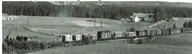
Tertittten med vogner. I bakgrunnen gården Myrvold.

En kunne f.eks. starte i Oslo, så ta toget til Halden og Tistedalen, for så å gå om bord i båten «Turisten». Der ble en fraktet opp Halden-vassdraget, med mange sjøer og sluser. Til slutt kom en til Skullerud. Der stod «Tertittten» klar til å frakte folk til Sørumsand. Så var siste etappe med Kongssvingerbanen tilbake til Oslo.