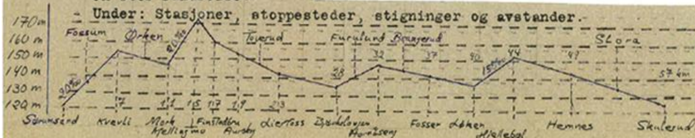
Urskog-Hølandsbanen - Den store rundreisen.

Under: Stasjoner, stoppesteder, stigninger og avstander.