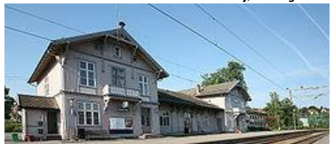
Kongsvinger stasjon

Kongsvingerbanen går mellom Lillestrøm og Charlottenberg, og ble åpnet til Kongsvinger 3.10.1862. I 1865 ble den tilknyttet det svenske jernbanenettet ved Charlottenberg over Furumoen. Banen ble elektrifisert i 1951, og hele strekningen fra Lillestrøm til riksgrensen er 121,7 km.