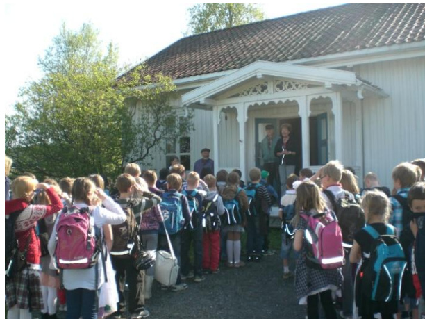
Elevene ved skoleinngangen.

Som foregående år har det igjen vært gammeldags skole på Vølneberg, med ca 220 elever fra 7 skoler.