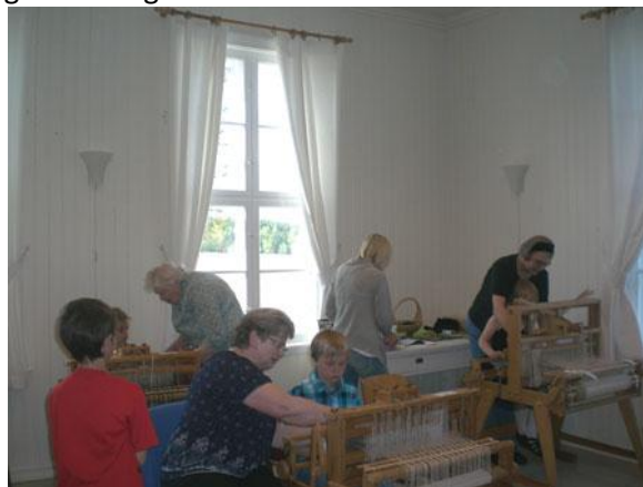
Veving er populært.