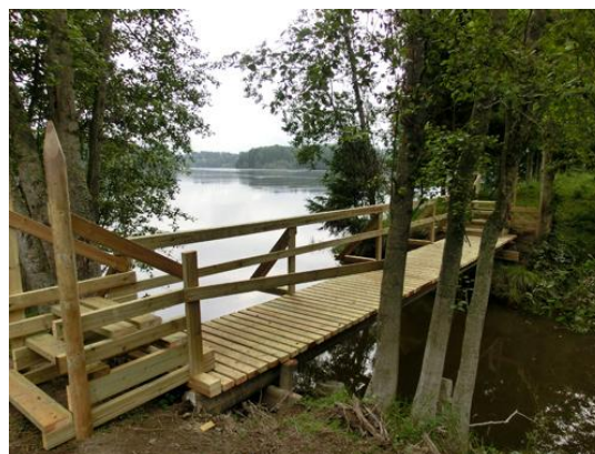
Brua er ferdig!

Historielaget setter stor pris på dette håndslaget. Det vil også Sørums befolkning gjøre når stien tas i bruk for søndagsutflukter. Ikke mange steder i Sørums kommer man så tett inn på beverens liv, historisk kommunikasjon og fløtingens historie som her.