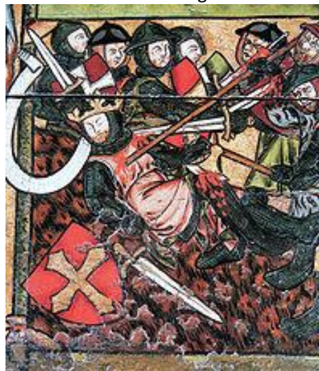
Olavs død på Stiklestad, alterbilde fra Nidaros.

I den norske kirkes kollektbønn for Olsok takker vi for Guds budbærere til vårt folk. Det handler ikke bare om Olav den hellige, men om alle troshelter og håpsbærere som har blitt risset inn i oss og skaper forbilder for kristne i dag.