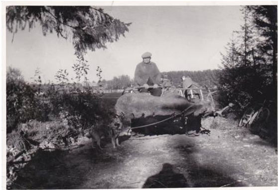
Elgkse skutt av Kristian Sæther i 1961. På Valsmoen.

Sørum skytterlag har arrangert treningsskyting og oppskyting. Fom 1990 har elglagene i Sørum stilt med anvisere. I 2008 ble skytebanen ombygget og fikk elektroniske skiver.