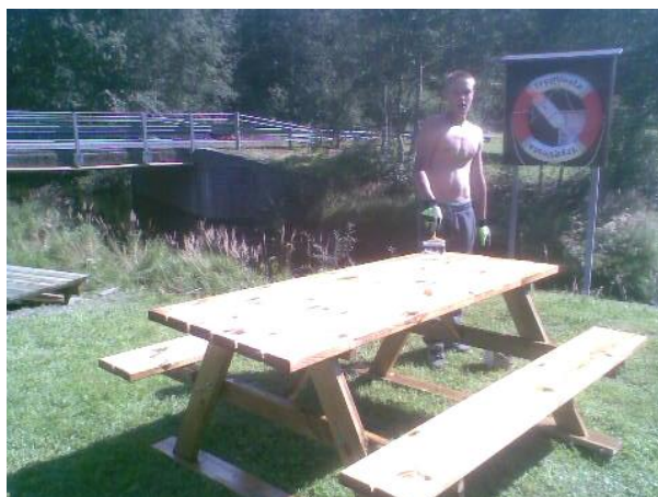
Sommerjobb på Slora Mølle bl.a. med rastebord.

Dugnaden har hatt godt fremmøte i år. Mange ting blir gjort. Pågående prosjekter er: - rehabilitering av "Grei"-petroleumsmotor,