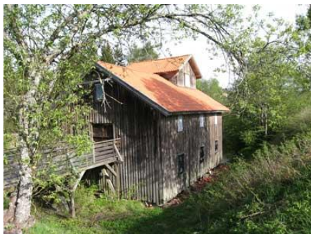
Slora Mølle.

(ref. hjemmesiden – www.sorum.historielag.no ).