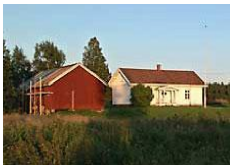
Vølneberg gamle skole.