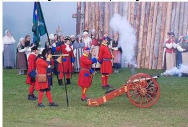
Skansespillet 2007.

Styret i Skansespillet på Romerike AL har igjen gleden av å invitere til Skansespill. Formålet er å gi en kunstnerisk presentasjon av historien rundt vårt flotte kulturminne Blaker Skanse. Vi ønsker samtidig å gi barn, unge og voksne mulighet til opplevelse, læring og utfoldelse i et meningsfylt og godt fellesskap. Vår visjon for Skansespillet er at det skal bli det beste og mest besøkte historiske spillet på Østlandet, og vi føler at vi er på riktig vei.