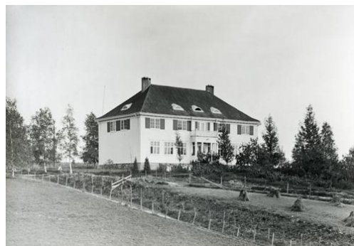
Vesterskaun skole.

I 1912 ble det vedtatt at Refsum og Sørvald skolekretser skulle slås sammen til en krets med navn Vesterskaun. Ny skole skulle bygges, og tomt ble innkjøpt av Knut Kirkeby på Negarn Asak. Skoletomta ble fradelt garden, men først tinglyst i 1918.