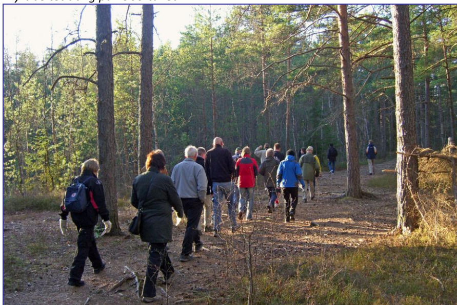
Fra rusleturen, over Åsmåsan, gamle torvtak