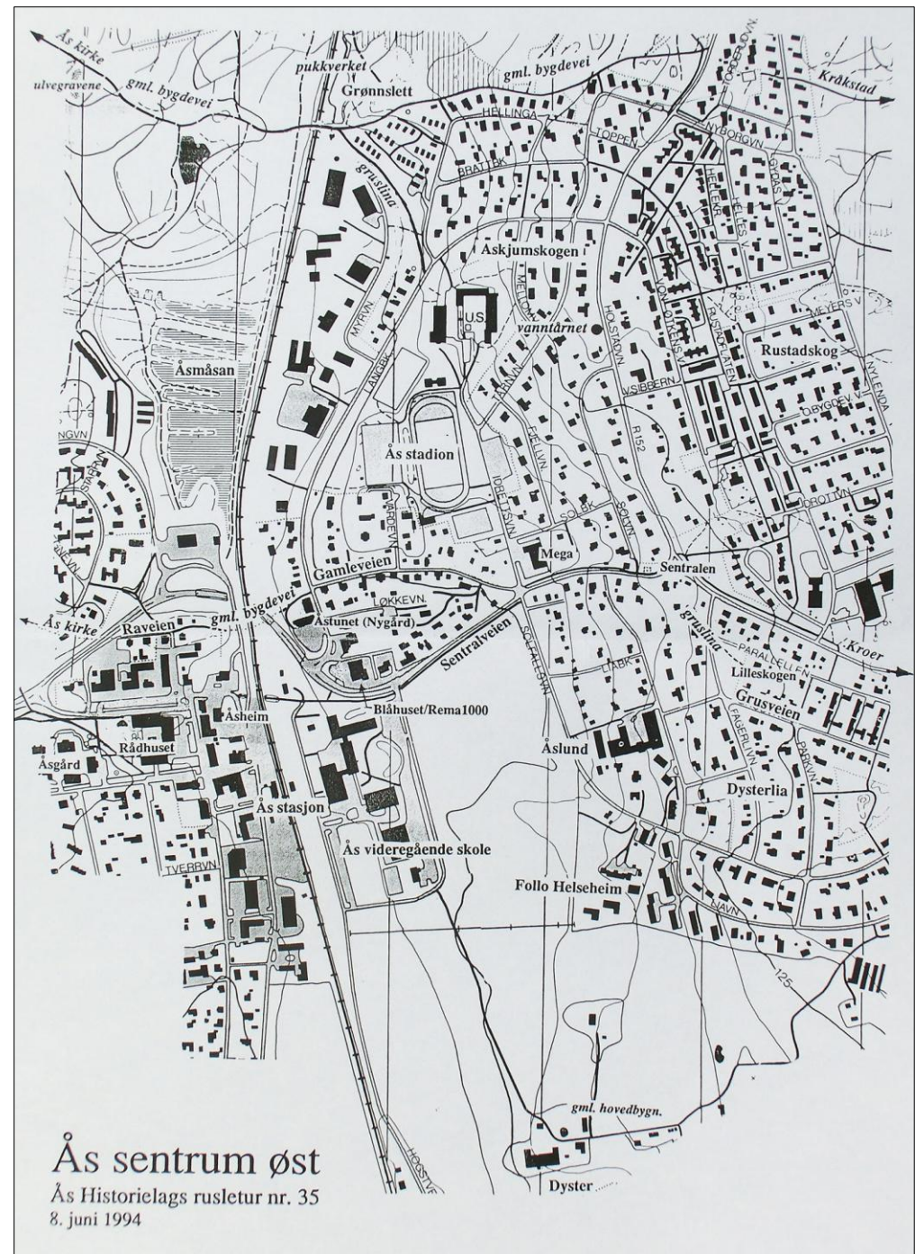
Ås sentrum øst Ås Historielags rusletur nr. 35 8. juni 1994