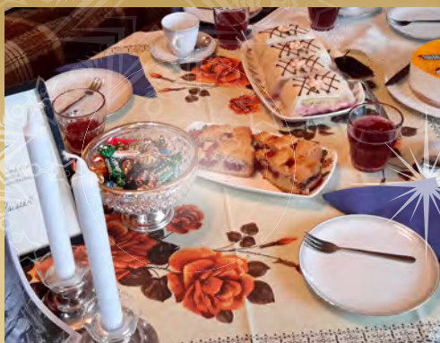
Æres den som æres bør