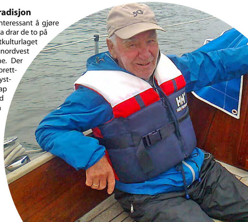
Torgny 90 år - fullbefaren matros med kledelig skjeggstubb og korrekt antrekk tar en velfortjent pust i cockpiten.

Ikke verst alderen tatt i betraktning , for å bruke Dags måte å uttrykke det på.