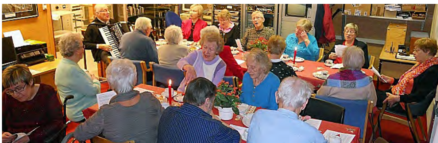
God stemning når trekkspillet drar i gang allsang på julekaffe i Tromsø.

etablert i 1995 i den gamle bygningen til Tromsø Kringkaster på Langnes i utkanten av sentrum. Denne ble bygd i 1935 av NRK og satt i drift året etter. I slutten av 1991 ble det slutt og de to 120 meter høye mastene er fjernet. Da ble langbølgesenderen på Ingøy satt i drift.