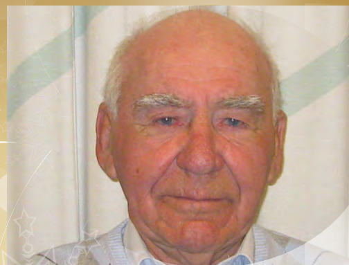
Torgny - et unikum