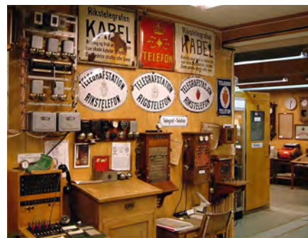
Mangt og mye har forandret seg.

etablert i 1995 i den gamle bygningen til Tromsø Kringkaster på Langnes i utkanten av sentrum. Denne ble bygd i 1935 av NRK og satt i drift året etter. I slutten av 1991 ble det slutt og de to 120 meter høye mastene er fjernet. Da ble langbølgesenderen på Ingøy satt i drift.