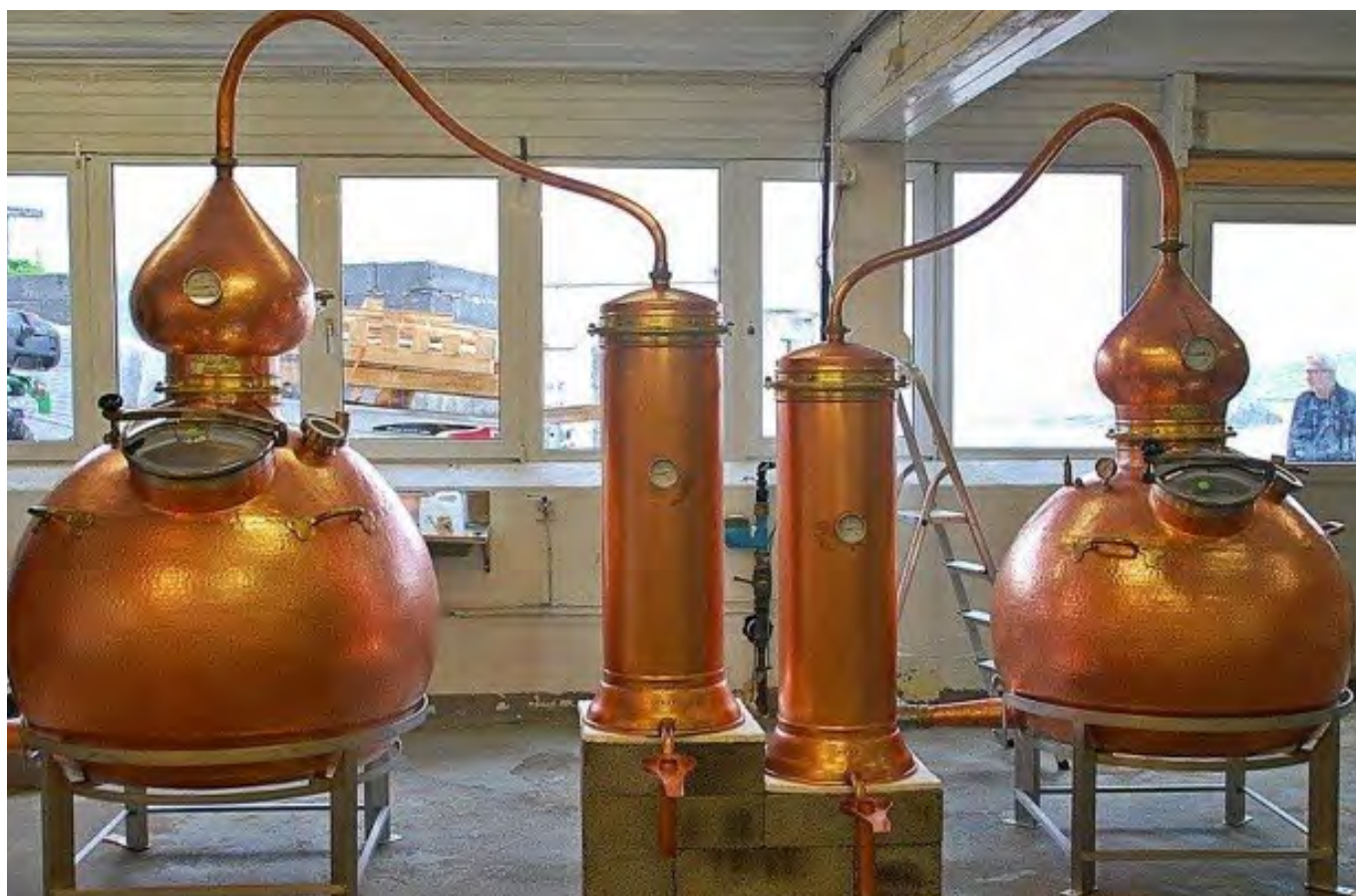
Destilleriets stolthet er pannene i håndbanket kobber fra Spania som brukes til whiskybrenningen.