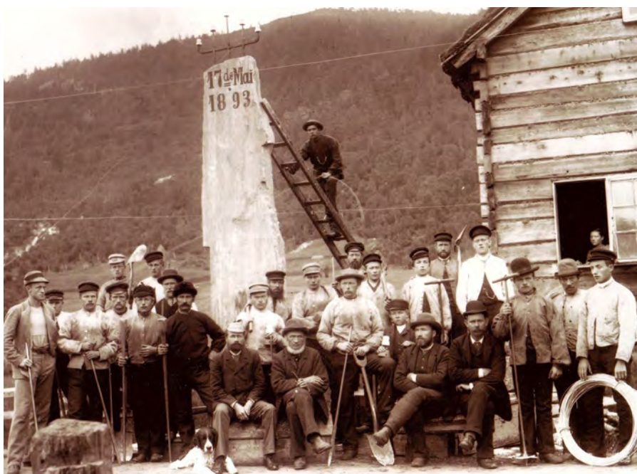
Mangt og mykje kan seiast både om mannen bak kameraet, dei staute telefonarbeidarane og dama i stoveglaset denne dagen. På kvar sitt vis – og med stor innsats – sytte dei for at bygdene i Indre Nordfjord og Sunnlyven på Sunnmøre fekk telefon. Den gedigne inntakstolpen til telefonstasjonen på Grodås kom seinare vekk.

På eit medlemsmøte i laget orda eg frampå at eg kunne ta meg av arkivsakane. Det var leiaren som klaga si naud. Mangt og mykje hadde samla seg opp desse 25 åra. Han visste ikkje heilt korleis han skulle bere seg åt. Eg tenkte dette kunne vere høveleg sysselsetjing i ledige stunder for ein nyslegen pensjonist. I alle fall kunne det ikkje vere meir ein eit godt dagsverk å ordne sakene. Og når så langt kom, ein tur til Fylkesarkivet på Leikanger for avlevering. Men dit hadde eg likevel ærend.