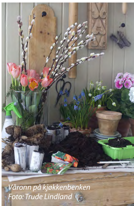
Våronn på kjøkkenbenken

Finn fram gamle og rene pottes, tomme isbokser og melkekartonger, fyll de med jord og så i vei. Bak på frøposene står anbefalt så-temperatur og så-dybde. Når du har sådd dusjes jorden med lunke vann og dekkes til med plastfilm eller glassplate. Sett pottene lyst, men ikke i direkte solskinn. De fleste frø spirer ved 18 - 20 grader. Spiretiden avhenger av frøsorten.