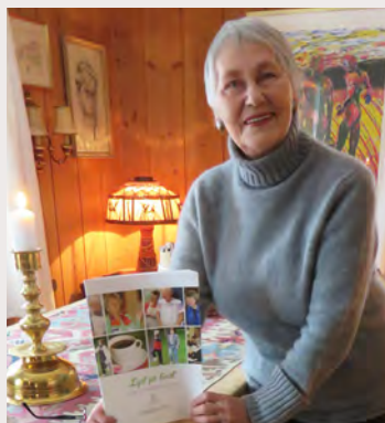
Ser lyst på livet