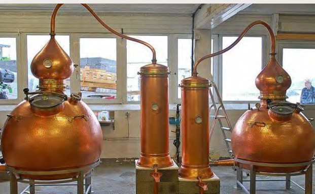
Fra fisk til whisky

Levanger Lokallag: Den minste av dem alle