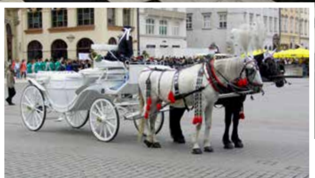
Standsmessig Kjøretøy på Markedsplassen i Krakow

I dag teller koret 30 medlemmer, godt over halvparten har vært med fra starten. De aller fleste av koremedlemmene er telepensjonister og er medlemmer i pensjonistforeningen vår.