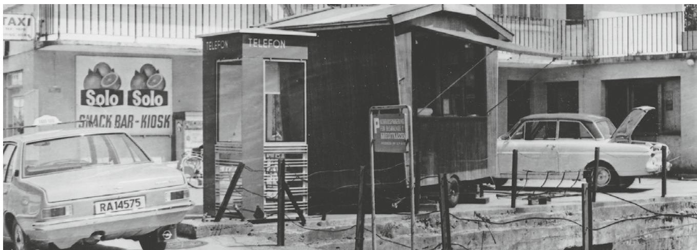
Pølsebua til Røde Kors ved drosjesentralen på Borhaug. På høgre side står telefonbua der dei kunne "daile" gratis til Amerika.

Setesdalen. Lengst vest var Søgne, og i aust Tveit. Lengst mot nord var Hovden i Bykle, på grensa mot Haukelid. Så det var eit stort område.