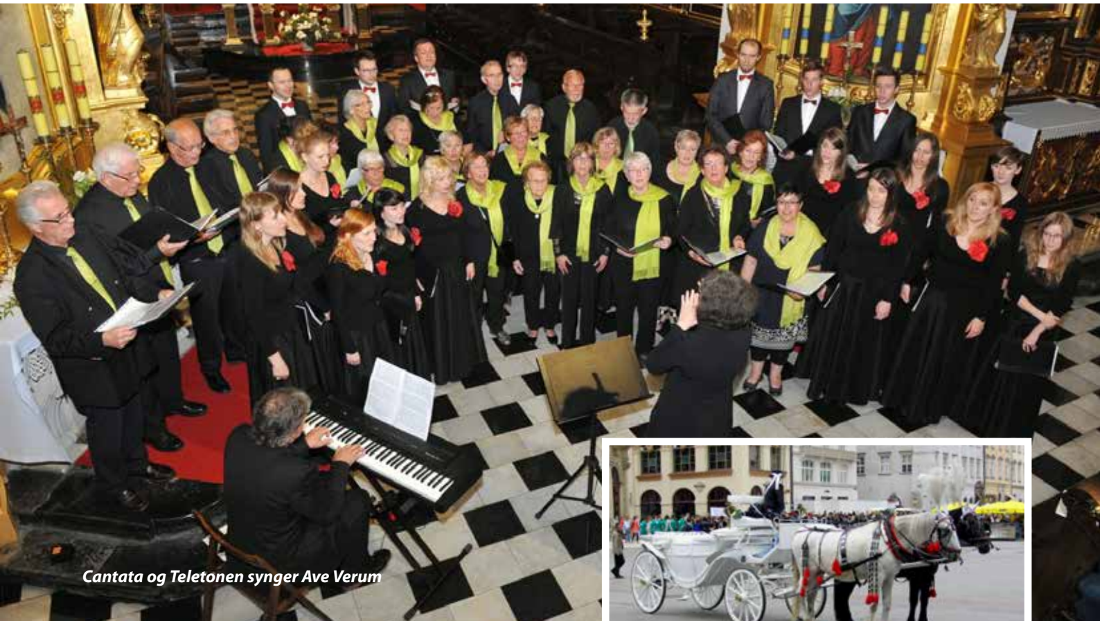
Cantata og Teletonen synger Ave Verum

Sangkoret Teletonen har 25-årsjubileum i år. Jubileet ble markert med en tur til Krakow. Koret ble stiftet i 1989 og hadde da 40 medlemmer, alle ansatt i Telenor Bergen.