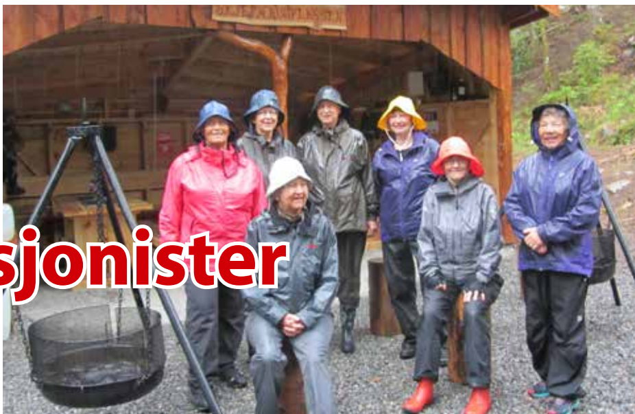
Kledd for en tur i øsende regnvær.

Telepensjonistene på Stord er en gruppe på 15 medlemmer som er organisert gjennom Telepensjonistene i Bergen. En gang i året har styret i Bergen møte sammen med medlemmene på Stord for å utveksle informasjon. Det blir også tid til kaffe og prat med kjente kolleger.