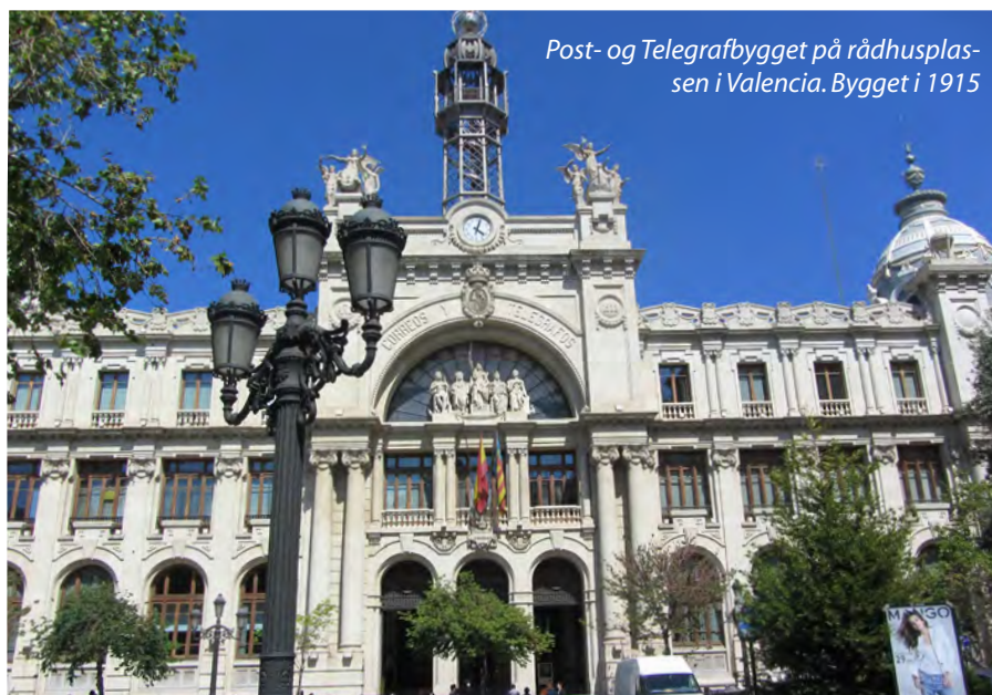
Post- og Telegrafbygget på rådhusplassen i Valencia. Bygget i 1915

Som så mange andre nordboere besøker jeg Costa Blanca i Spania minst en gang i året. I fjor dro vi på dagstur fra Albir til Valencia. Det var et besøk som gav mersmak. En dagstur gav oss bare en anelse om hvor mye flott der er å se på i byen. I år hadde vi derfor satt av to dager til å utforske Valencia.