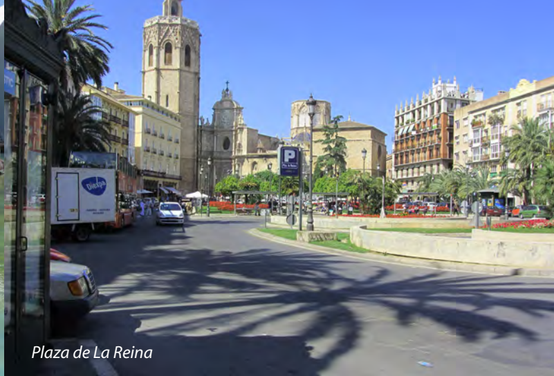
Plaza de La Reina

bygde opp jordbruk og industri, og Valencia ble et regionalt senter. I det 13. århundre ble maurerne jaget ut og Valencia ble innlemmet i det katalanske kongedømme. Arkitekturen i gamle bydeler gjenspeiler skiftende regimer og stilarter. Mange har opp gjennom hundreårene markert sin status og makt med flotte monumentale bygg. Kirker fra forskjellige trosretninger er det mange av, likeså offentlige bygninger fra forskjellige perioder.