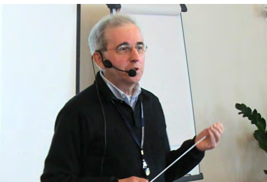
Tidligere forbundsleder Odd Kåre Kvalheim