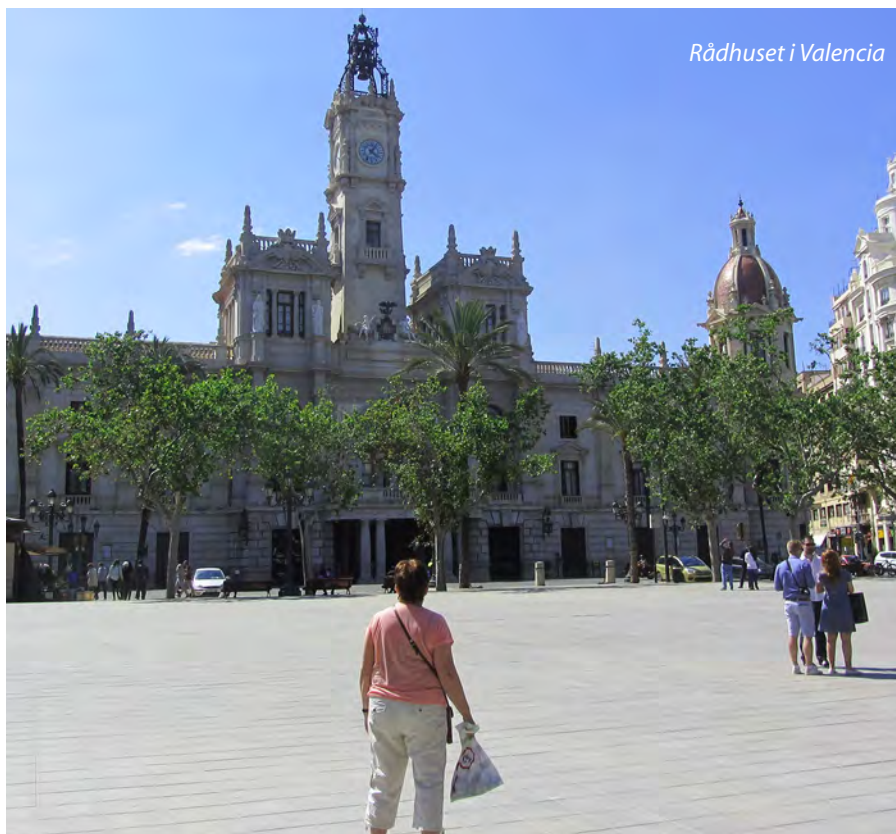
Rådhuset i Valencia

Valencia ble grunnlagt av romerne etter år 138. De konstruerte vanningsanlegg for jordbruk og bosetting. Senere ble de drevet vekk av visgoterne, som igjen ble jaget ut av maurerne i 711. Maurerne