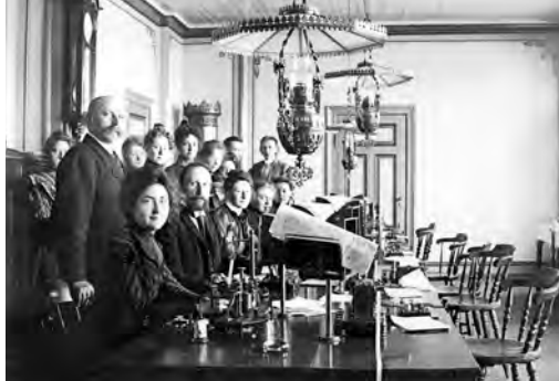
Fra fotoarkivet: fra Løddingen