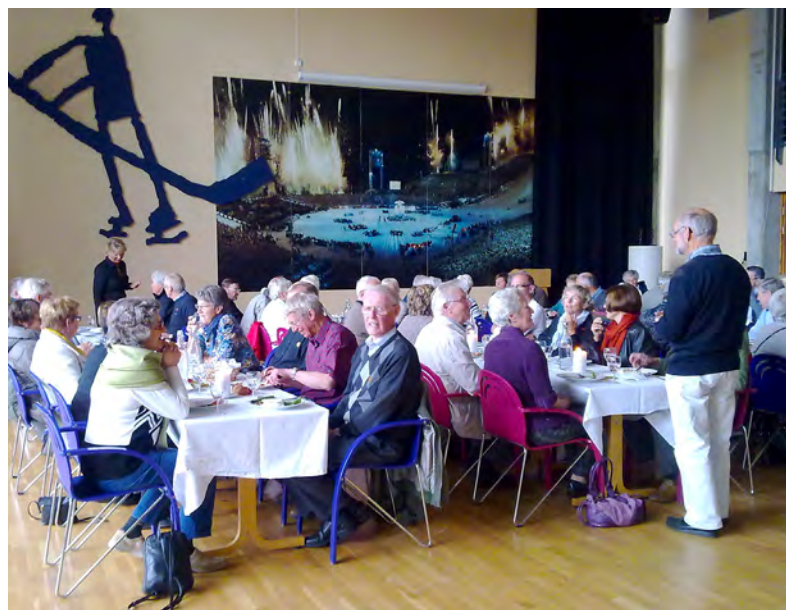
Felles medlemsmøte med Hamar Telepensjonistforening i Håkons hall, den største OL-hallen på Lillehammer.

Bildet på veggen er fra åpningsseremonien av OL 12. februar 1994.