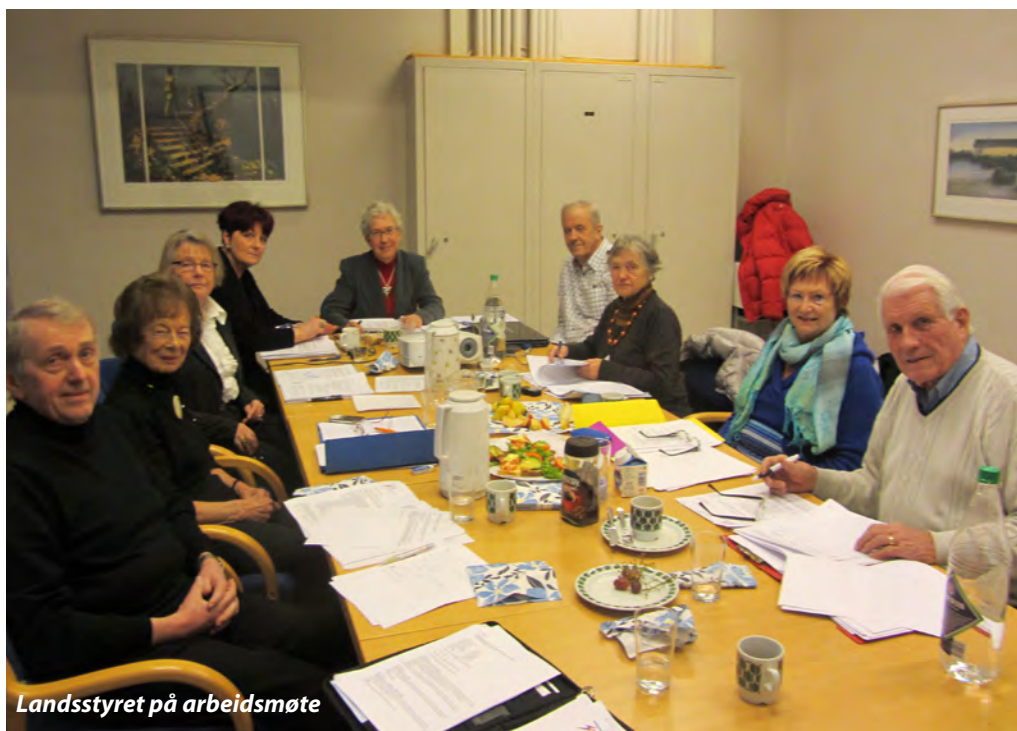
Landsstyret på arbeidsmøte

For meg er det vanskelig å utpeke de viktigste sakene – her er det mange viktige saker både for Forbundet og for lokalforeningene. Personlig er jeg mektig glad for at vi i forslag til Rammebudsjett for neste landsmøteperiode har avsatt midler til opplæring av tillitsvalgte. Som stabil talsperson for livslang læring og iboende tro på at trygghet i forhold til oppgavene alltid bidrar til trivsel og det beste i oss, håper jeg Landsmøtet støtter opp om dette.