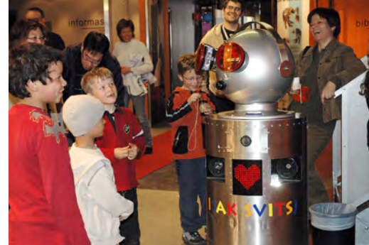
Roboten Isak underholder små og store