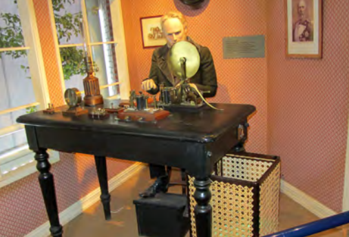
Moderne kommunikasjon midt på 1800-tallet