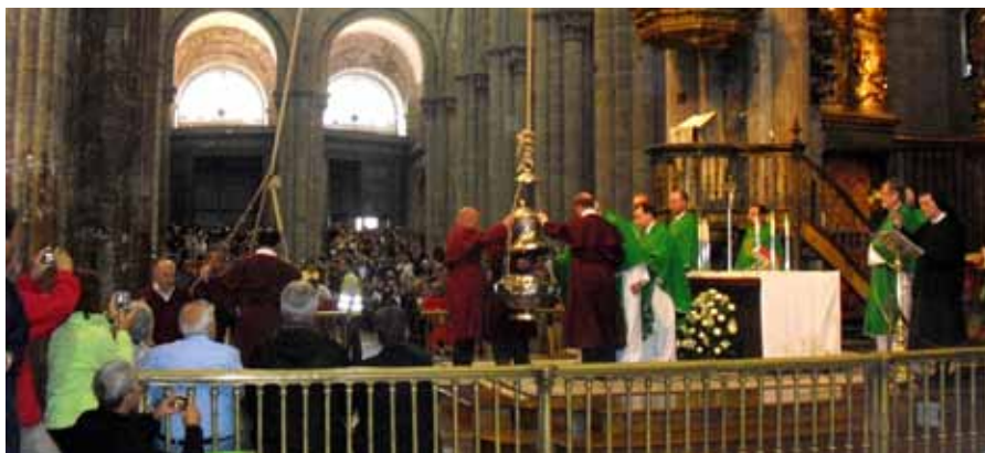
Røkelsskaret tennes i domene

Dagen i Santiago starter med sightseeing med lokalguide. Været viser seg ikke fra sin beste side, og vi var glad vi kunne gå inn i Katedralen og finne oss en plass, slik at vi fikk med oss den Katolske pilgrimsmessen som skulle starte kl. 12.00.