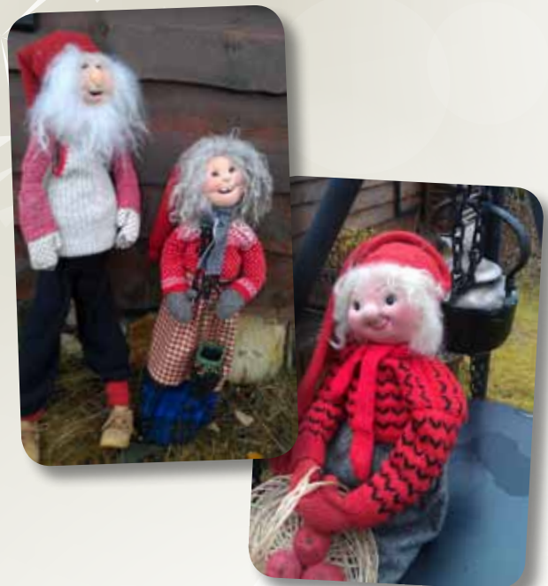
Nissene er laget og fotografert av Åshild Bjelland Kalleklev.