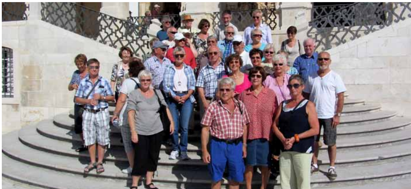
Reisefølget på universitetstrappen i Coimbra.