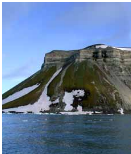
Fjellet Eremitten på Vaigattbogen.