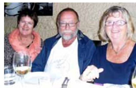
Venter på mat og drikke

Neste dag gikk turen via Frankfurt til Bergen.