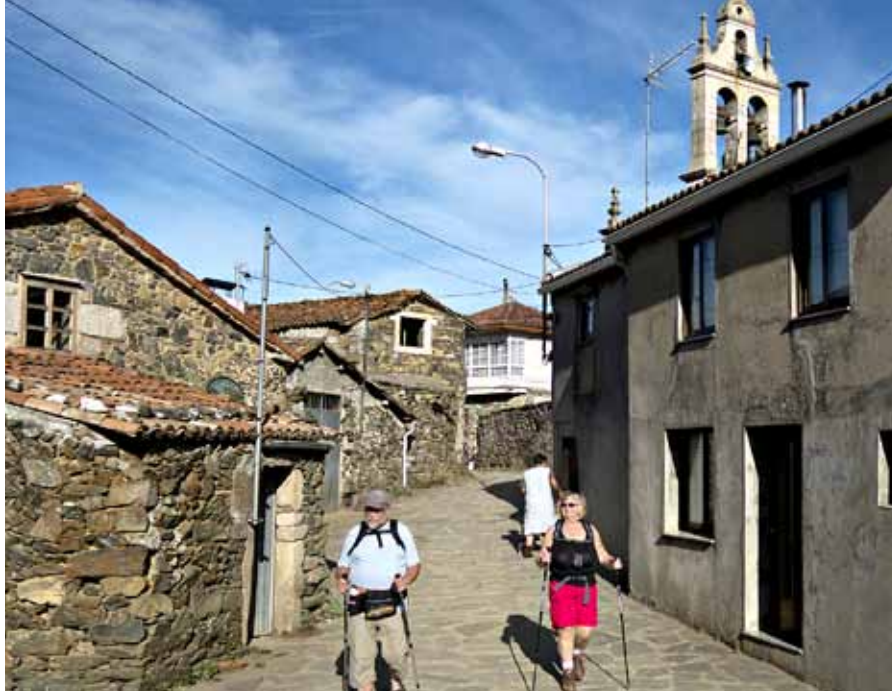
En nydelig liten by

Fremme i Melide venter bussen, vi kan gå videre til Arzua, men vi foretrekker å ta bussen fordi den skal kjøre oss helt til Santiago og Hotel Compostela.