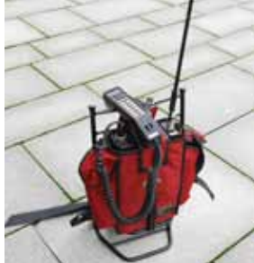
En Simonsen NMT med bæremeis fra 1981