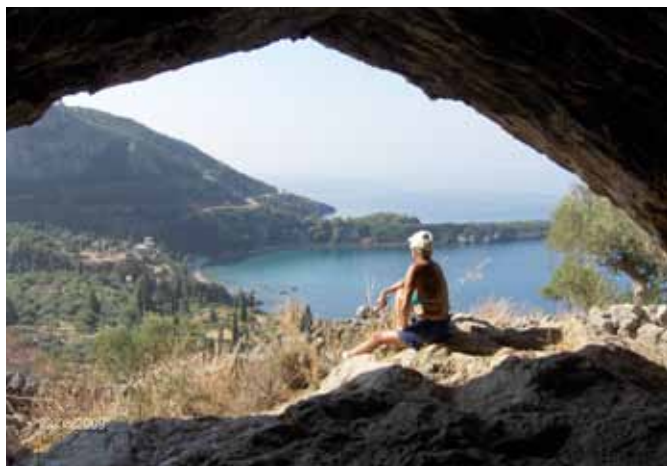
Utsikt over Kardamilli og Taygetosfjellene