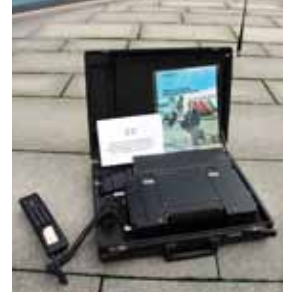
Siemens NMT for den travle forretningsmann fra 1981

Mobiltelefonen har en lengre historie enn mange av oss kanskje tror. 10. november 1981 ble NMT – Nordisk MobilTelefon – verdens første helautomatiske system satt i drift i Oslo. Dermed var grunnlaget for det virkelig store mobileventyret lagt.