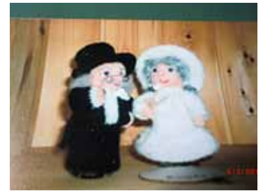
Oldemor og oldefar på bytur

Dette hendte for eit par år sidan. Ma'en min og eg steig på bussen ved Haukeland sjukehus. Han dumpa ned på eit sete på tvers av bussen, der det berre var plass til han. Eg måtte då setja meg på eit vanleg sete like ved. Ingen kunne veta at me høyrde saman og det var då ideen vart skapt til å skaffa litt action på ein elles kjedeleg busstur. Eg spurde ma'en min, med høg røyst, Er du gift? Hæ? svarte han. Eg gjentok, er du gift? Ja? ? Han såg uforståande ut, som om det hadde rabla for meg. Då sa eg: Viss kåno di ikkje er sjalu, så lurte eg på om me kunne gå på kafe ilag. Eg spanderar. Eg såg at folk i bussen følgde med, dei tenkte sikkert at eg var eit usedvanleg frekt kvinnfolk, som la an på ein gift mann. Ma'en som ikkje forsto eit bøss av heile greia øydela opplegget med å svara at: Ja, det er jo du som har pengane..... Men eg oppnådde å skapa litt smålott blant nokon av dei som sat på bussen. Og me sjøl har ledd mykje av dette i ettertid.