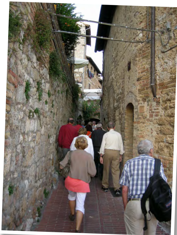
På vei gjennom trange "små" i Siena.

hadde 1 ½ times guidet rundgang til disposisjon i dette muséet. En fullgod vandring i muséets lokaliteter ville kunne pågå i dagevis!