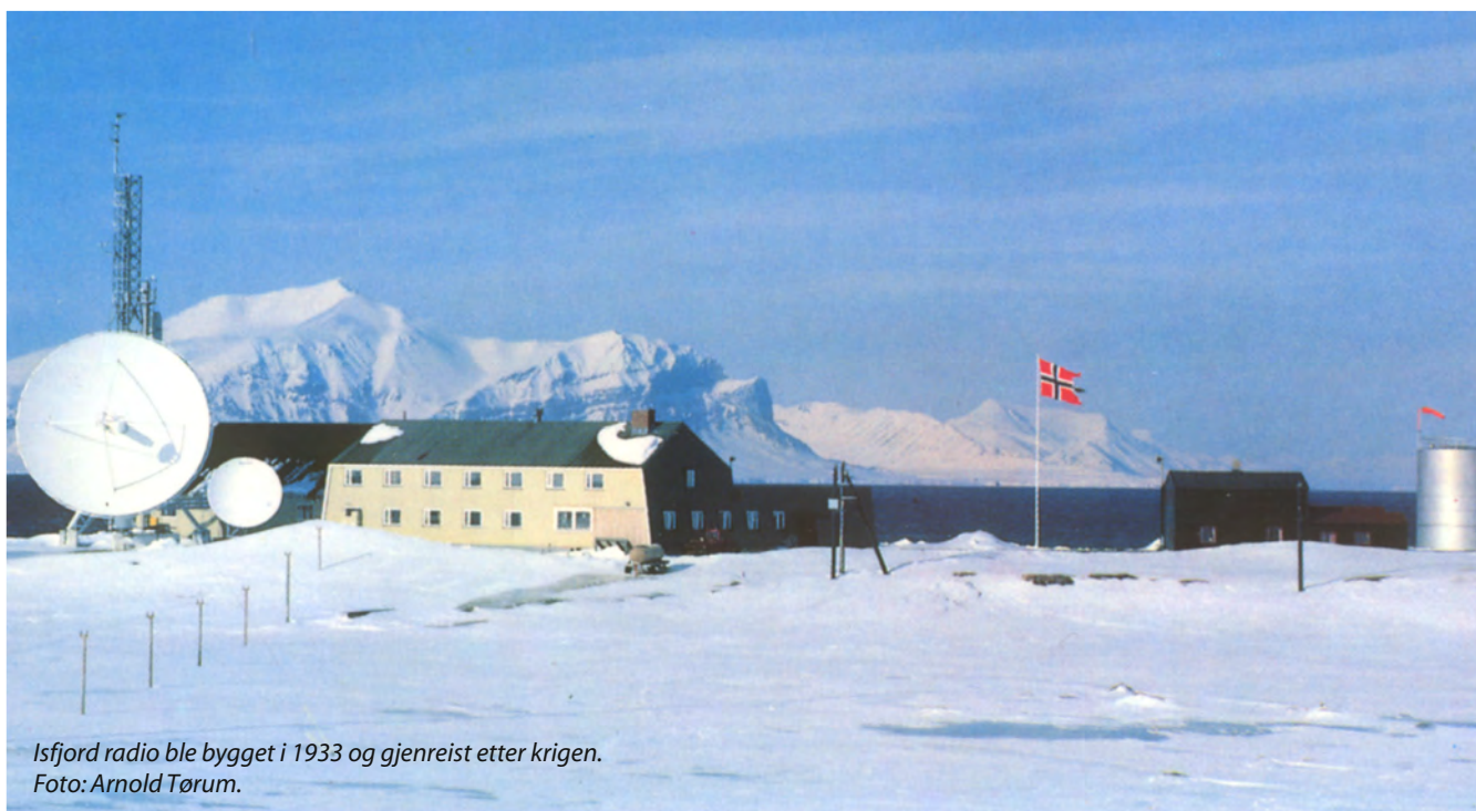
Isfjord radio ble bygget i 1933 og gjenreist etter krigen.

Telenor var i 1980-1990 årene under kontinuerlig organisasjonsmessig forandring. Dette måtte også få betydning for virksomheten på Svalbard. Resultatet ble at Svalbard ble et eget aksjeselskap og 24. november 1995 ble selskapet formelt etablert.