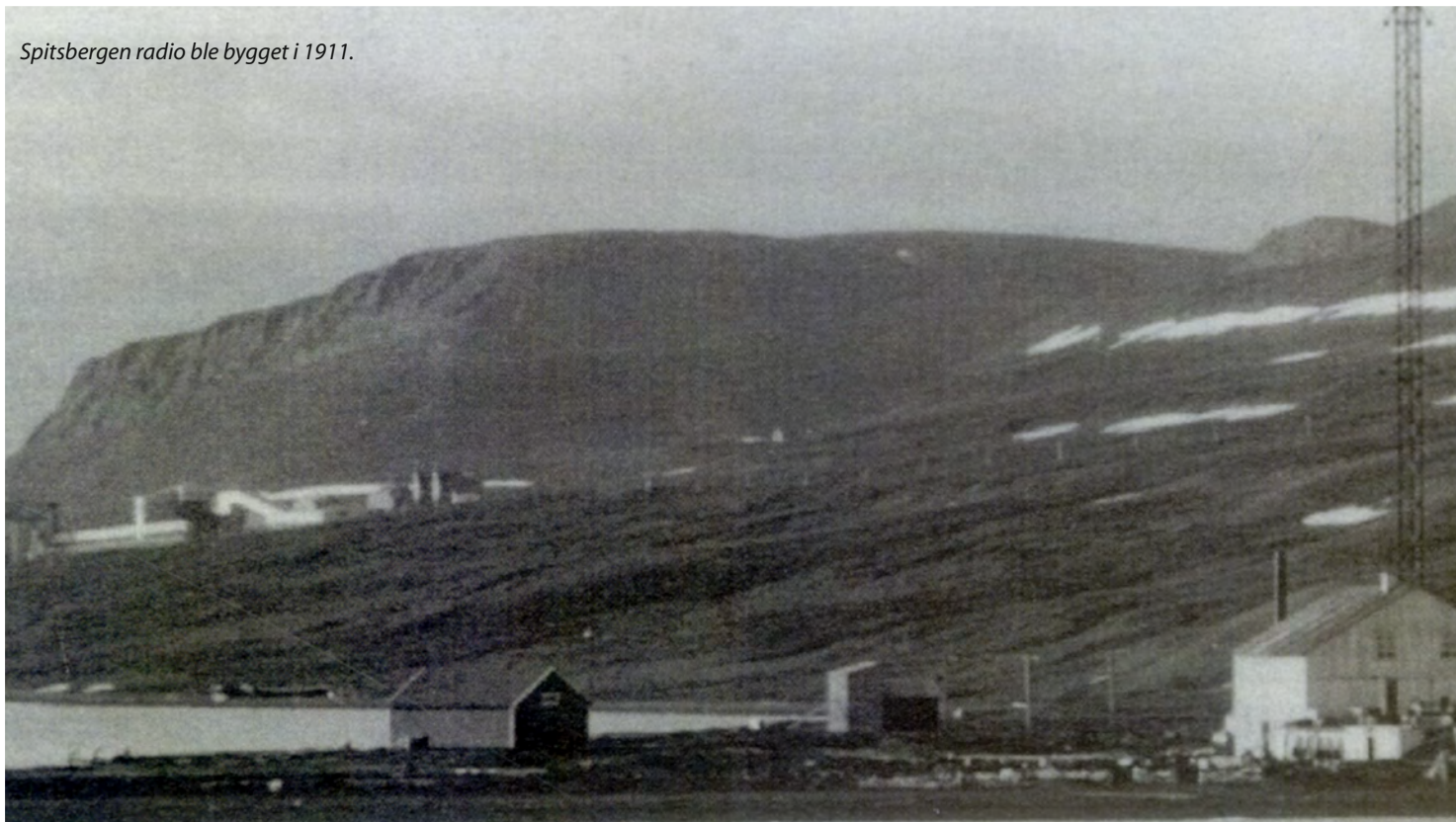
Spitsbergen radio ble bygget i 1911.

Både Svalbard radio og Isfjord radio ble satt ut av drift da evakueringen ble foretatt. Tyskerne gjorde flere flyraid over Svalbard og som