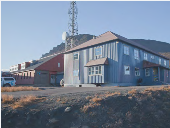
Telenors administrasjons- og tekniske bygg på Skjæringa i Longyearbyen.

Til tross for mye dårlig vær den sommeren ble arbeidet sluttført 13. september. En ny imponerende bragd gjennomført på utrolig kort tid 13. november 1933 kom stasjonen offisielt "på luften" med betydelig bedre kvalitet enn det som var tilfelle fra stasjonen i Longyearbyen. Isfjord radio ble nå den viktigste stasjonen på Svalbard. Virksomheten på Isfjord radio holdt fram helt til andre verdenskrig kom.