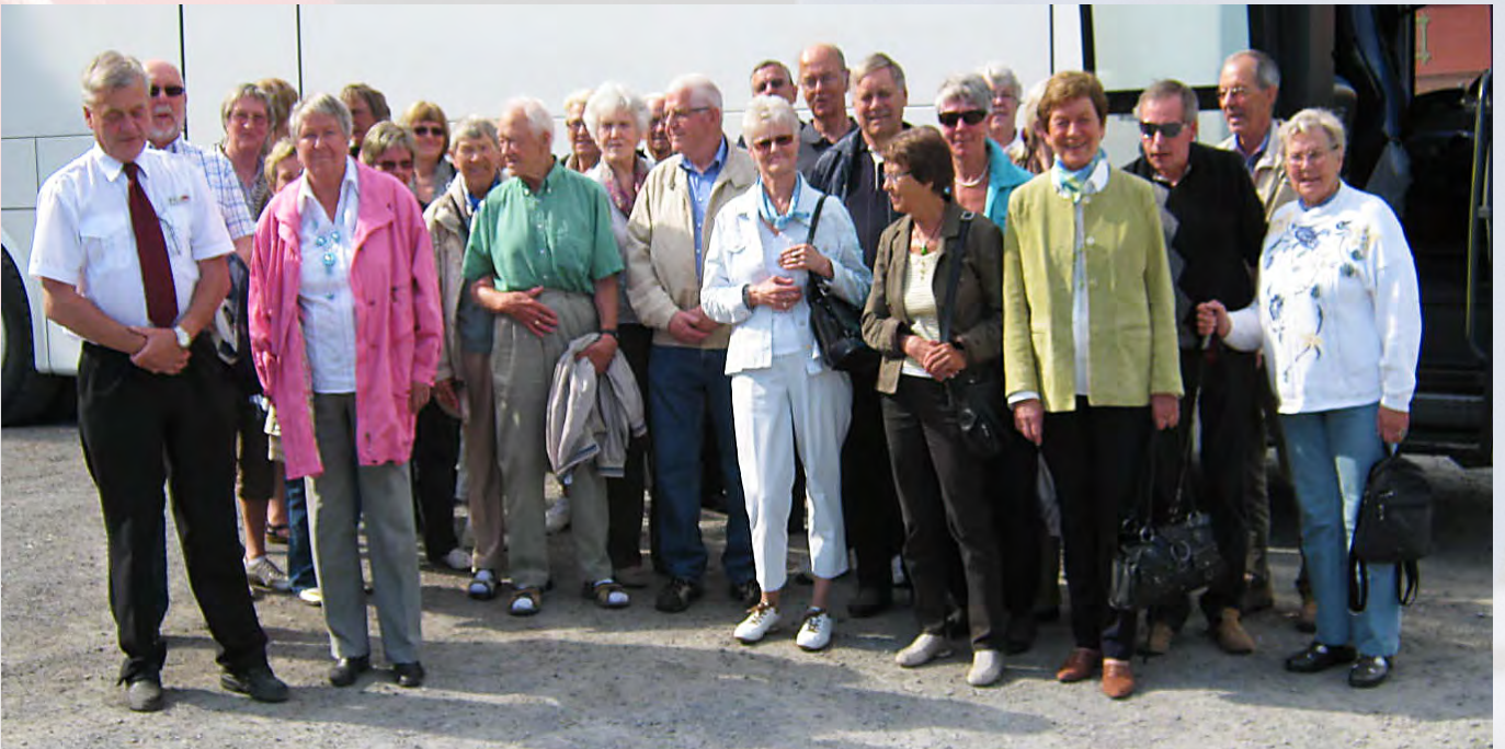
30 forventningsfulle telepensionister