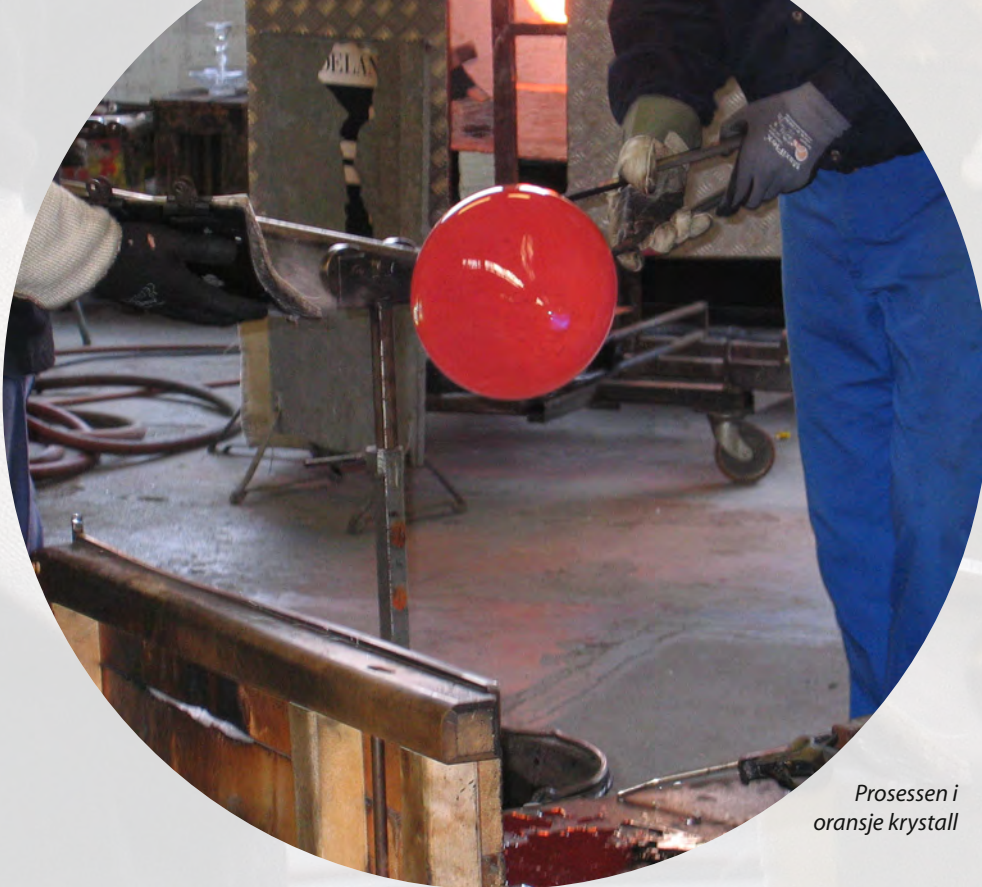
Prosessen i oransje krystall