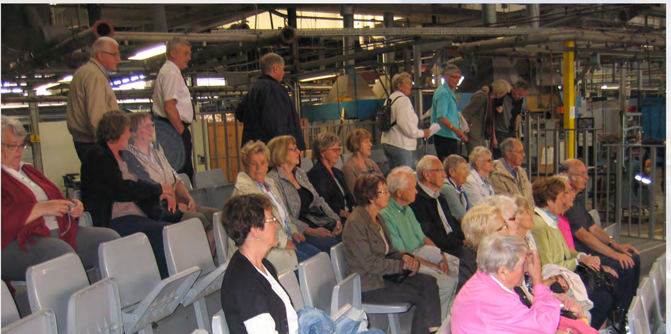
I auditoriet i Glassverket