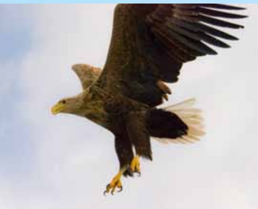
Havørn i flukt.