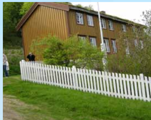
Knut Hamsuns hjem på Hamarøy vakte interesse blant telepensjonistene.