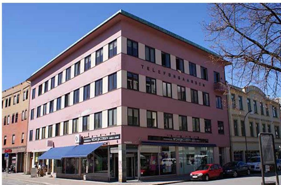
Telefongården i Fredrikstad

Telefongården huset den gang i 4. etasje hovedsentralen, denne var tilknyttet de telefonabonnentene man hadde i sentrum