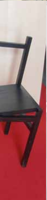
Over, th: Kaffe på Hamsunsentret Midten th: Etter middag på Tranøy fyr nøy vi nok en kaffe ute! Under th: Tranøy fyr Over, tv: Mye interessant å beskue. Midten, tv: Se de stolene!