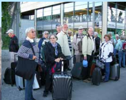
Klar for avgang fra Hotel Opera.