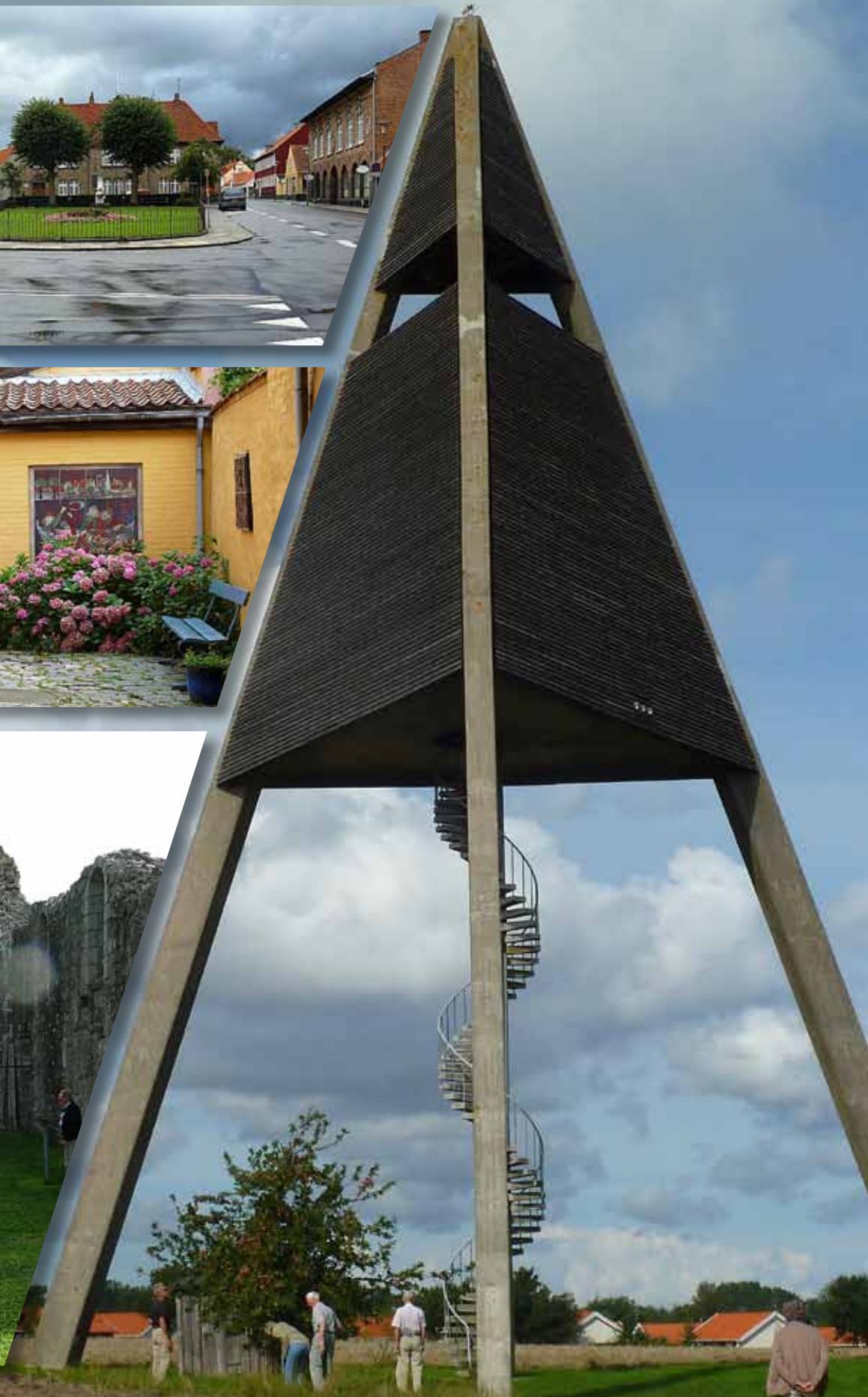
Øverst: Bybilde Rønne Midten: Baggård i Rønne Nederst: Østmarie kirekeruin