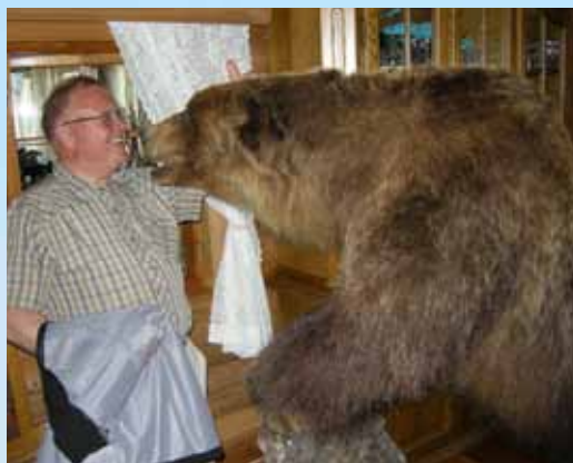
Både Koj og bjørnen kom fra møtet med livet i behold.