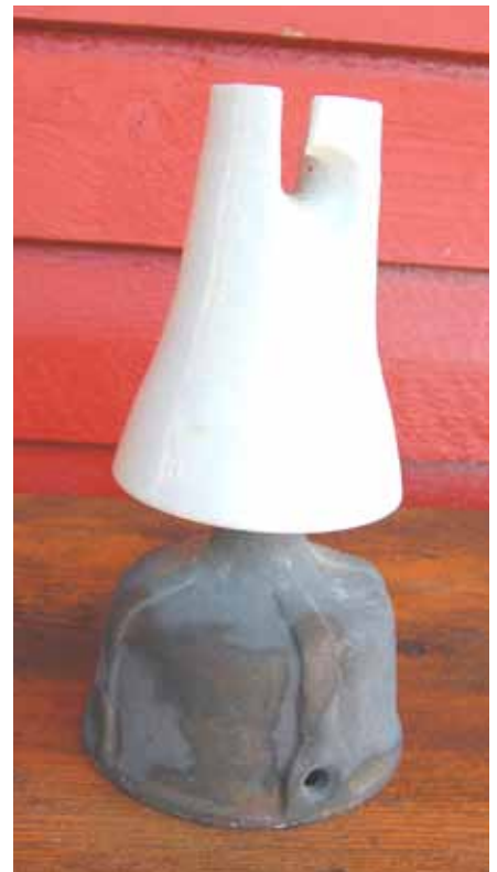
Dei store telegrafisolatorane er tekne vare på. Gode å bruke som vabein!

Man blir gammel altfor fort og klok så altfor sent.