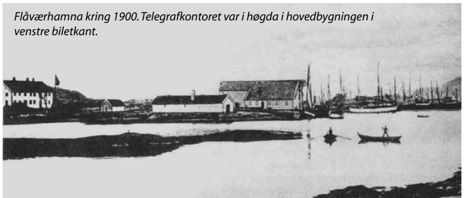
Flåværahamna kring 1900. Telegrafkontoret var i høgda i hovedbygningen i venstre biletkant.

og påbygg i lengda: "4 kakkelovnsværelser, kjøkken i 2dre etage, 1 kvistværelse og clædekammer i 3dje etage, rum til budet i borgstuen samt nødvendige ydre rum, det vil sige adgang til kjælder, stolpebod, vedbod og lokum." Merkeleg nok vart telegrafekspedisjonen plassert i andre høgda, utsletne trappetrinn vitnar om det.