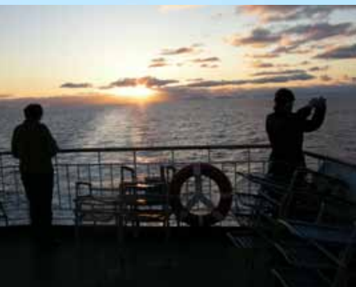
Drømmen om midnattsolen ble oppfylt noen sjømil syd for Brønnøysund.