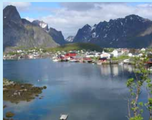
Svolvær ligger som en perle i et forgyldt landskap.

Trollfjorden er et kapittel for seg. Turister som kommer "innedørs" i denne fjordarmen, bør ikke lide av klaustrofobi! Fjellene på begge sider stuper loddrett i sjøen. Steinartene er forsket til å være omkring 3,5 milliarder år gamle! Trollfjorden er 2,5 km lang, med en dybde på mellom 30 og 70 m. I godt vær går hurtigruten inn i fjorden, til stor begeistring for passasjerene. Ved hjelp av en sidepropell vender skipet så å si på en femøre innerst i fjorden. På-tvers-liggende kan hurtigruten nesten funksjonere som en gangbro mellom de to fjellmassivene, som er fra 500 m opp til 1 000 m høye.