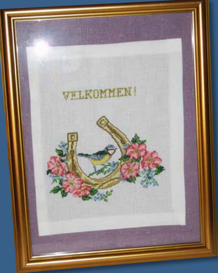
Årspremie for oppmøte på medlemsmøter i Gjøvik.