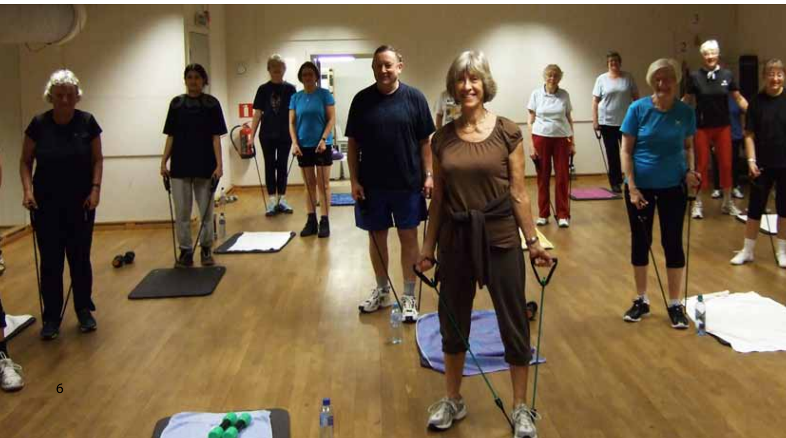
Seniorene i styrkesalen.

Fysisk trening er den beste medisin for både kropp og sinn og anbefales til alle, ikke minst til pensjonister.