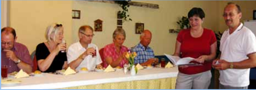
Norsk delegasjon på besøk hos Telenor i Moskva.