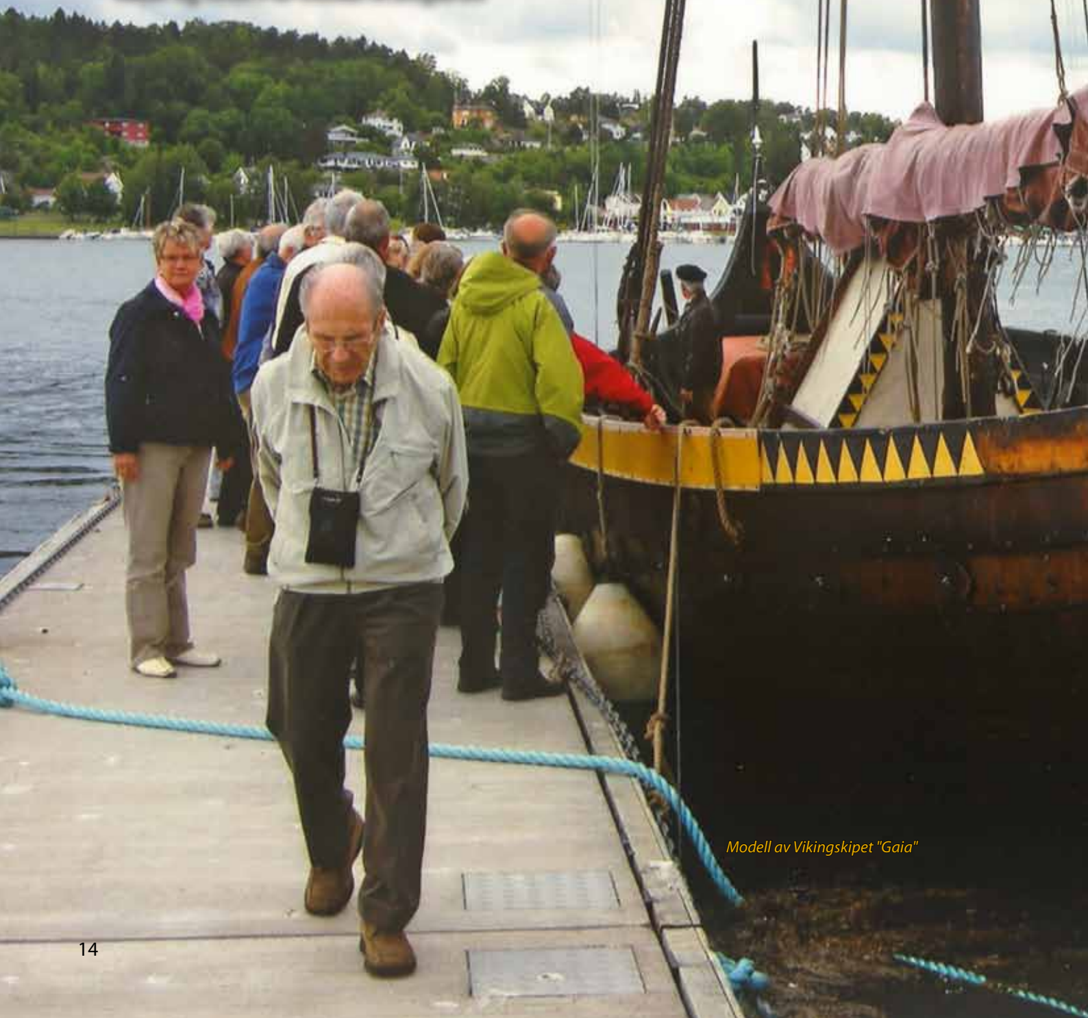
Modell av Vikingskipet "Gaia"