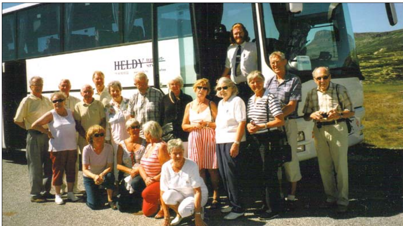
Busstopp og luftepause på Ringebu fjellet.