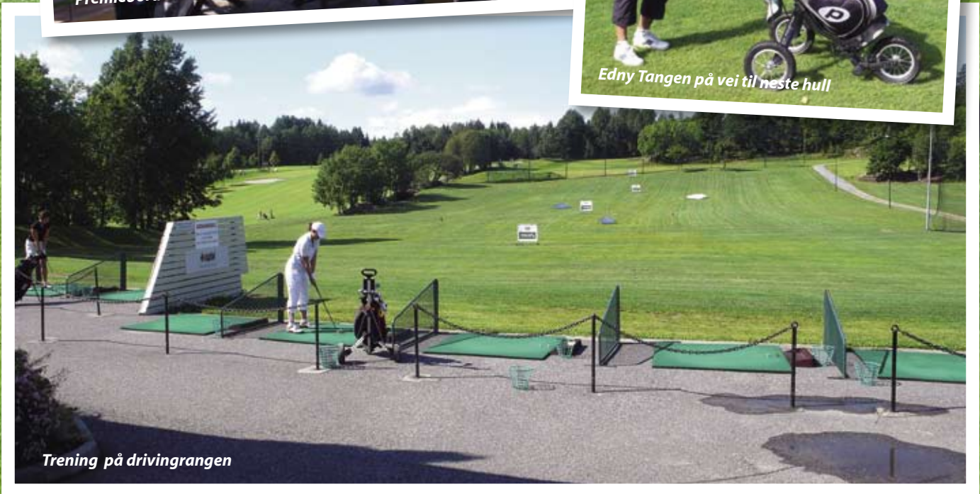
Trening på drivingrangen