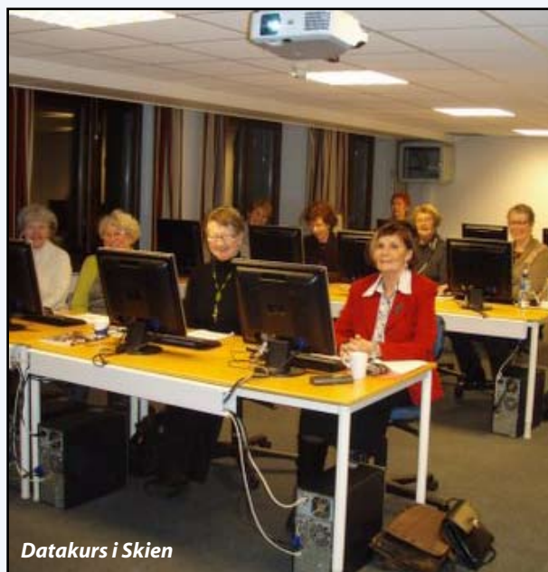
Datakurs i Skien