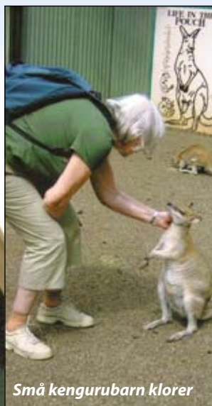
Små kengurubarn klorer