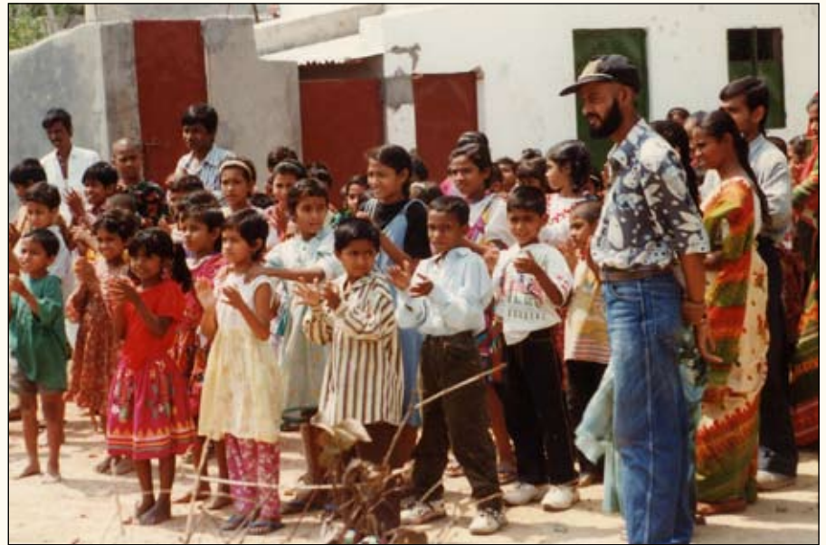
Barneheim i Dakha