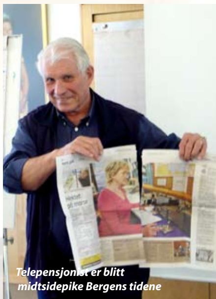
Telepensjonist er blitt midtsidepike Bergens tidene