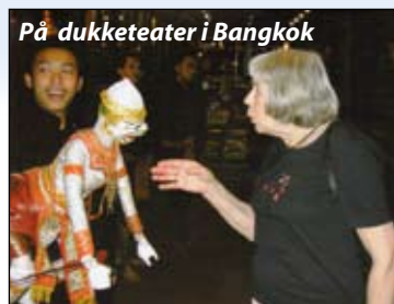
På dukketeater i Bangkok

Vi fløy videre til Bangkok. Dit er det ikke farlig å komme når man har gode guider fra ambassaden. Gullbelagte slott og Buddha'er tok nesten pusten fra oss. Vi tok båttur til Grand Palace med 30 avdelinger og gallerier og lunsjet ved elvebredden. Om kvelden besøkte vi et fantastisk dukketeater innen vi avsluttet med et godt Taimåltid til vakker dans og musikk.