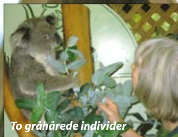
To gråhårede individer