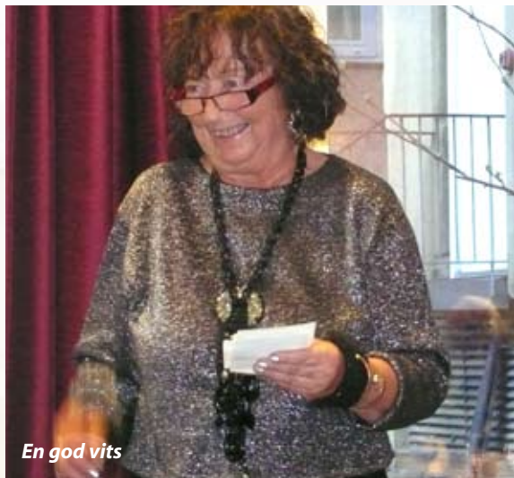
En god vits