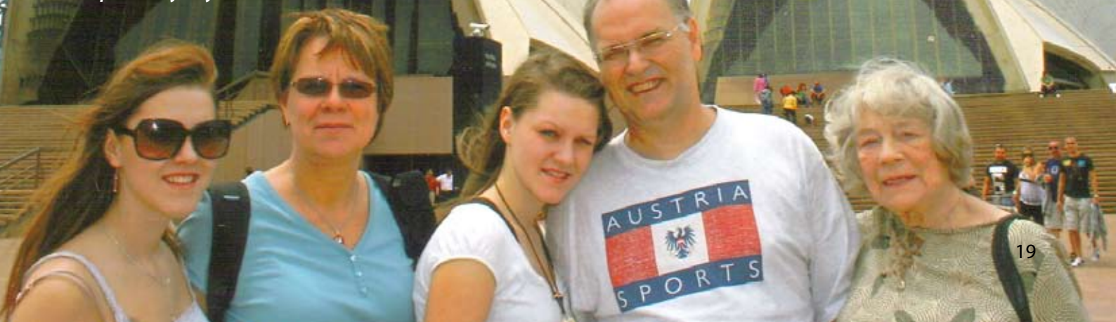
Operaen i Sydney