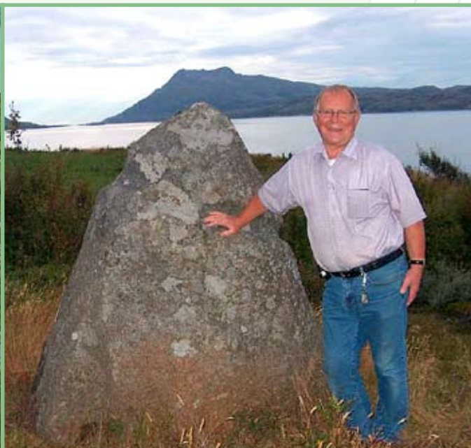
Forfatteren lar seg imponere over fallosens form og størrelse. (Foto: Anne-Marie Ulvang).